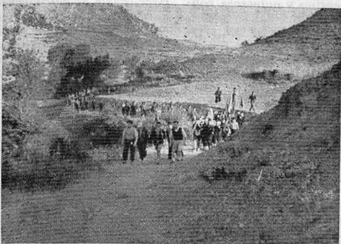
En ruta hacia el pico más alto de la provincia, los montañeros del Frente de Juventudes, acompañados por romeros de los pueblos comarcanos, llevan a hombros la preciosa imagen de la Virgen.