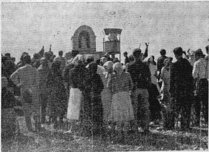
La imagen de Nuestra Señora del Rosario, entronizada en su capilla de la cumbre del Javalambre.