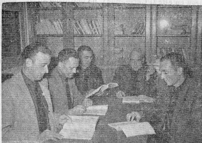
II Curso de Jefes Locales de Teruel: Una Escuadra en pleno trabajo.