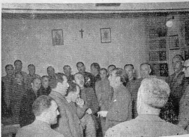
II Curso de Jefes Locales de Teruel: Jerarquías Provinciales visitan a los camaradas del Curso.

Innovación en este Curso ha sido lo que dimos en denominar el problema del día, y que consistía en plantear los problemas más importantes y frecuentes que se dan en la esfera local; las contestaciones, formuladas por escrito, fueron cuidadosamente estudiadas y al finalizar el día, en reunión