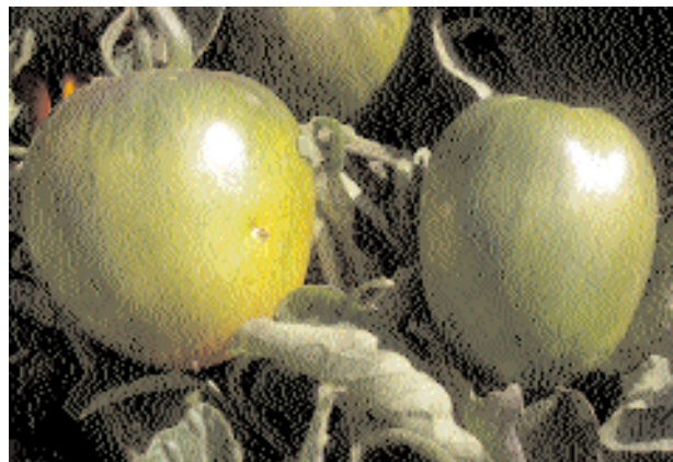
Variedad con alto contenido en Licopeno.

El efecto de este antioxidante tiene por lo tanto un efecto beneficioso en su consumo, lo que lo hace también interesante para su cultivo, siempre y cuando o bien la producción o bien el precio lo sean también. Posteriormente nos referiremos a ello.