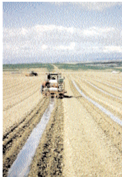
Siembra directa con riego por goteo.

Se ha visto también condicionada la producción final por una disminución del cuajado de los frutos, pudiéndose establecer que ha habido una dificultad de la agrupación de la cosecha que se ha visto además dificultada por la alta pluviometría y bajas temperaturas en la época de maduración de los frutos.