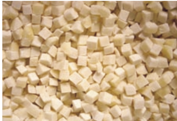
Los dados de patata congelada deben mantenerse consistentes, sin síntomas de desintegración y con color blanco, tanto tras el escaldado como una vez cocinados.

La industria es muy exigente a la hora de admitir una patata para congelado; por eso, para su valoración las muestras deben pasar por dos test de calidad, el primero tras el escaldado es el denominado procedimiento industrial, que determina la calidad del producto que se va a congelar, y el segundo y definitivo tras el congelado, es el procedimiento de cocinado que muestra el resultado que obtendrá el consumidor al cocinar la patata. Una variedad se considera apta para la industria cuando es valorada como aceptable en los dos test.