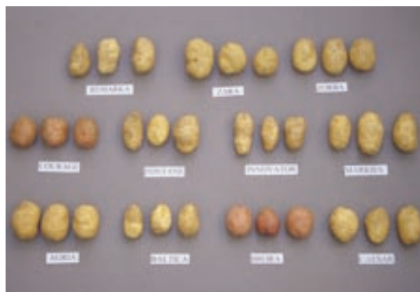
Variedades ensayadas en 2001 en Torremocha.

Las variedades Harmony, Monalisa y Zorba, por ser de ciclo más corto, tienen producciones más bajas que el resto, desventaja que se compensa con la posibilidad de una recolección más temprana. Harmony ha sido la más productiva sin diferencia significativa con Monalisa.