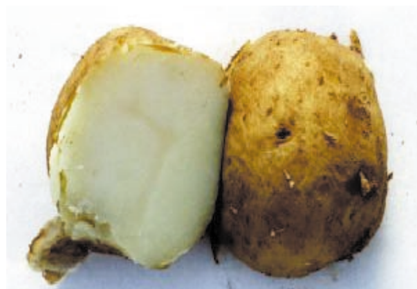
Tubérculos aptos para hervido: consistentes y con ligera desintegración.

En el cuadro nº 8 aparecen los parámetros que definen la calidad para la cocción con su escala de valores. Según éstos, la variedad ideal es la que alcanza en todos sus parámetros la puntuación 1, siendo utilizable para la elaboración de ensaladas y ensaladillas; no obstante, a nivel práctico se consideran variedades también aceptables para hervir aquellas que presentan desintegración nula o ligera, consistencia firme o bastante firme, no harinosas o ligeramente harinosas, de estructura fina o bastante fina, sabor neutro o ligeramente pronunciado y sin oscurecimiento o ligero.