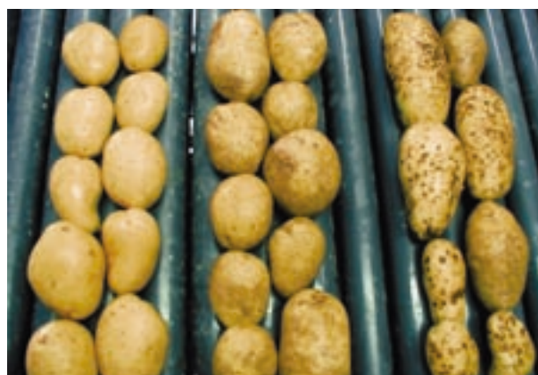
Categorías de lavado: 1ª (Izquierda), 2ª (Centro), No apta (Derecha)

Las industrias envasadoras y comercializadoras de patata son conscientes de que el consumidor, además de exigir el cumplimiento de las normas de calidad, valora de manera creciente el aspecto y presentación de la patata y la calidad de ésta al cocinarla de distintos modos. Por ello, a la hora de adquirir patata para lavar, han añadido a las normas de calidad exigidas por la Administración, otros criterios de valoración más exhaustivos que les permiten clasificar los lotes como aptos o no aptos para patata de calidad o de segunda categoría. Y en los envases, junto al etiquetado obligatorio, indican el uso culinario más adecuado para cada variedad e incluso unos consejos de cocinado.