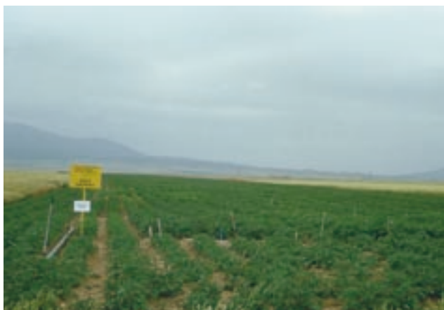
Microensayo variedades de patata para industria en Torremocha (Teruel)

Por todo ello, desde el Centro de Técnicas Agrarias siempre se ha considerado muy importante comprobar y analizar en todas las nuevas variedades que se van ensayando en Aragón además de su comportamiento agronómico y productividad, sus características y aptitudes para comercializar en fresco o en los diferentes tipos de transformación industrial a los que tradicionalmente se destinan.