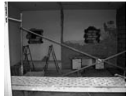
Obras en la ludoteca de Valareña.