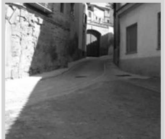
Estas calles forman parte de la zona medieval más característica de la ciudad. La calle Mesón Viejo daba a una de las puertas de la muralla y en ella, como su propio nombre indica, existía un mesón cuya explotación adjudicaba directamente el concejo de la Villa. La calle Trebedes hace referencia a «estruedes», utensilio de los antiguos hogares.

En cuanto a las obras incluidas en el PIEL II, la primera es la Reparación de calles en el entorno de la Plaza del Ruffán , por un montante de 53.598,30 euros, consistente esencialmente en la sustitución de la red de abastecimiento de la calle Gramática. La segunda, la Sustitución de sumideros en la calle Toril , por un valor de 16.000 euros, consistirá en el cambio de rejillas y en la colocación de sumidero aprovechando la tubería de desagüe de las aguas pluviales.