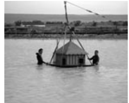
Colocación de una caseta para patos en El Bayo.