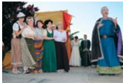
Varias comediantes de Ejea interpretaron la farsa «Las tremendas hijas del Rey Jaime»