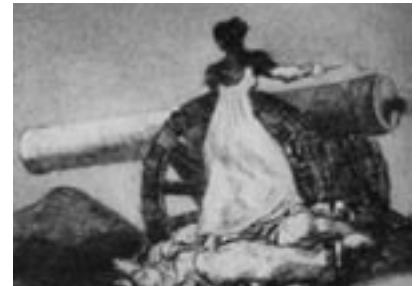
Agustina de Aragón.