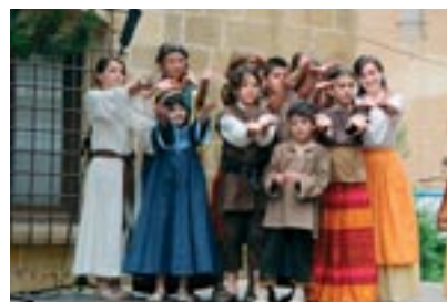
El grupo de niños protagonista de la farsa «El aprendiz Blasco de Grañén».