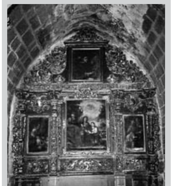
Retablo de Santa Ana.

Asimismo, el Gobierno de Aragón está ultimando el proyecto técnico de restauración de la fachada noroeste de la Iglesia del Salvador, para firmar a continuación el correspondiente convenio con el Ayuntamiento de Ejea y poder así empezar las obras en el año 2009.