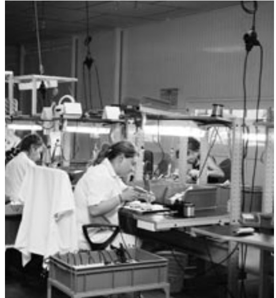
Trabajadoras de Electrojea S. Coop. en el Polígono Valdeferrín.

Cableados de Valareña S. Coop. la forman 8 trabajadoras. Empezaron a trabajar para Alcad hace tres años, fabricando aparatos para antenas de televisión. Se ubican en una nave alquilada a la Cooperativa San Miguel.