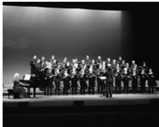
Coral Polifónica Exea.

La Agrupación Musical La Armónica recibirá 5.443 euros. Se trata de la histórica Banda de Rivas, que el pasado año celebró su 125 aniversario, que recibe a través de su asociación esta ayuda para financiar las actividades formativas de sus alumnos, una cantera que garantiza la vida de esta banda de larga tradición y