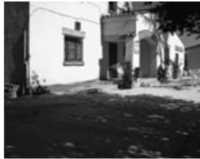
Construcción rampa acceso minusválidos en Hogar de Mayores de Bardenas.

Esta obra está enmarcada dentro de un amplio proyecto de reparación de aceras. A modo de experiencia piloto se utilizará como material de ejecución el hormigón estampado de tipología tradicional acorde con el entorno.