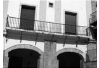
Antiguo Ayuntamiento de Ejea.