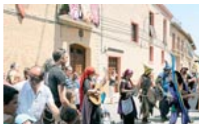
Zarrakatralla y Cuerno de Cabra se unieron improvisadamente para rondar animadamente las calles de La Corona.