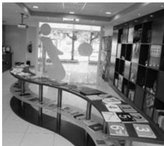
Oficina Municipal de Turismo.

Los objetivos que persigue el programa «Voluntarios de Turismo» son: mantener un horario de apertura estable de las iglesias de