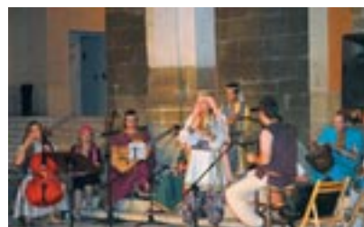
El grupo vocal e instrumental de Aires de Aragón durante el espectáculo que tiene lugar en la plaza de la Virgen de la Oliva.