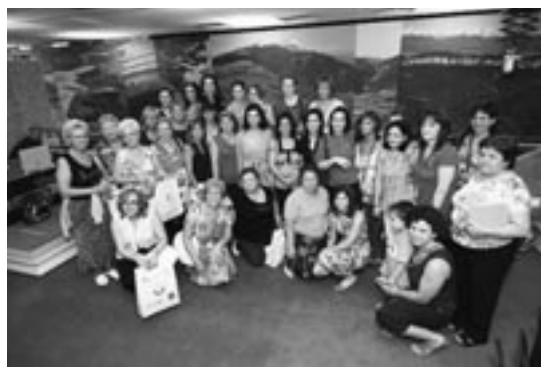
Mujeres ejeanas asistentes al acto.

ral femenina, ya que a su juicio es el auténtico estandarte de muchos pueblos, y le ha apuntado «como protagonista futura de la nueva Zaragoza y del nuevo Aragón tras la Expo». La consejera Fernández ensalzó a la mujer rural por su «implicación en la vida política y social de los territorios» y le ha apremiado para «continuar luchando en un mundo eminentemente masculino». Ana Fernández aprovechó la oportunidad para incitar a las mujeres presentes a aprovecharse de las nuevas políticas relativas al medio rural como el Plan de Igualdad, «que plantará cara a la precariedad y el abandono de los pueblos pequeños», o la Ley de Desarrollo Sostenible del Medio Rural, «que dotará al medio rural de nuevos servicios». Todo para «defender al medio rural como una alternativa de futuro», ha indicado.