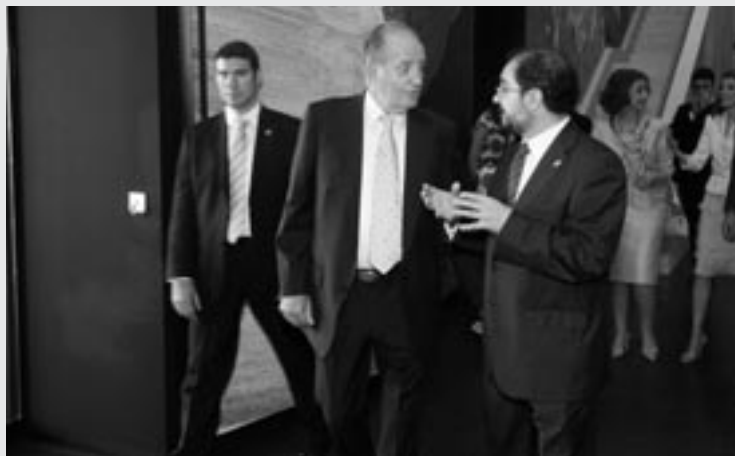
Javier Lambán explicó al Rey los problemas y los proyectos de la provincia de Zaragoza.