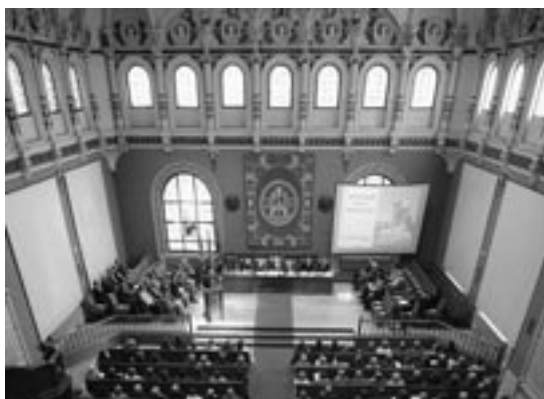
Apertura del curso académico de la Universidad de la Experiencia de Zaragoza.