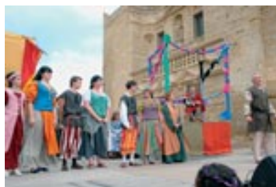
El grupo de teatro «Andanzas» se estrenó en la Fiesta Medieval.