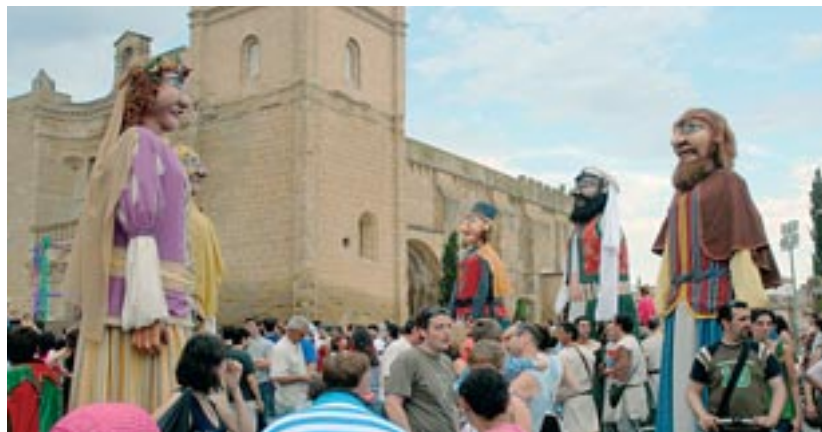
La Comparsa de Gigantes flanquea la entrada a la Plaza de Santa María, a la espera de la llegada de Pedro IV y la familia real

Muchas gracias desde esta breve reseña a todos los protagonistas: a las nuevas incorporaciones ya mencionadas, a la compañía Pingaliraina, a Aires de Aragón, la Banda de Música, la Coral Polifónica, la familia Arbués, el grupo de Teatro del Centro de Mayores, el Grupo de Gigantes y la Escuela de Música Tradicional, Zarrakatralla Folk, el Club de Ajedrez, el Taller de Trajes Tradicionales, los alumnos de ADIS-CIV, los jóvenes del IES Cinco Villas, los figurantes del casting y, por supuesto, a los vecinos del Barrio de La Corona, que accogen siempre con tanto cariño este proyecto.