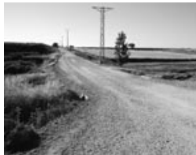
Arreglo del camino del cementerio de Santa Anastasia.