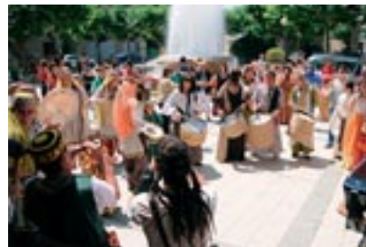
Un grupo de tambores de las Cofradías se incorporó este año a la Fiesta Medieval.