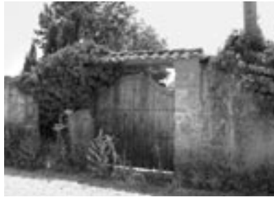
Antiguo convento de Franciscanos de Ejea.