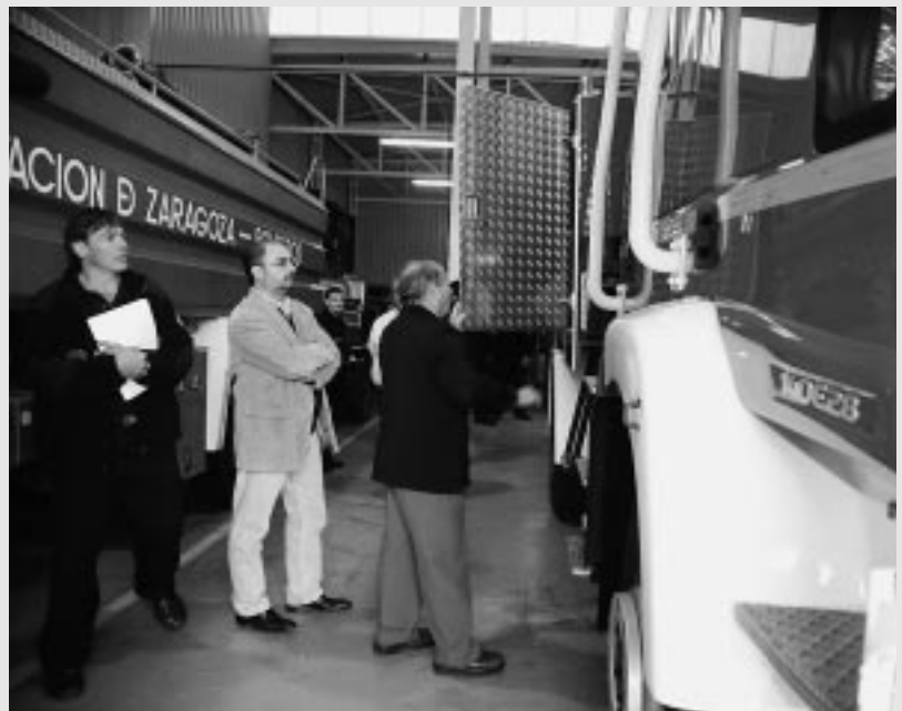
Javier Lambán inspecciona el nuevo vehículo.

El Parque está atendido por un cabo-jefe de parque en funciones (vacante la plaza de Sargento Jefe de Parque), cuatro cabos y 14 bomberos.