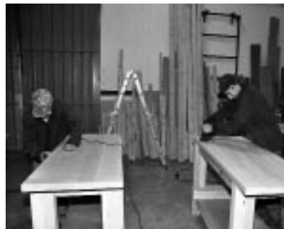
Alumnos en pleno trabajo formativo.