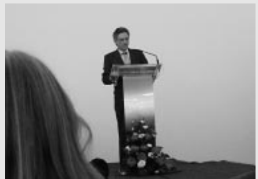
Conferencia de Luis Rojas Marcos.

La charla que se prolongó durante más de una hora resultó muy amena, pues constantemente hacía referencia a situaciones cotidianas consiguiendo transmitir sus mensajes de una forma muy gráfica.