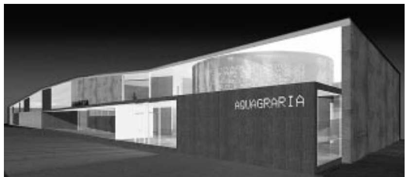
Primer boceto del edificio de Aquagraria.

El Parque Lineal del Gancho supone la culminación del cierre del casco urbano de Ejea por el sur. De este modo, se integra la Estanca del Gancho, que se convertirá en un lago urbano, en el barrio de La Llana. Se trata de un proyecto muy respetuoso con el medioambiente.