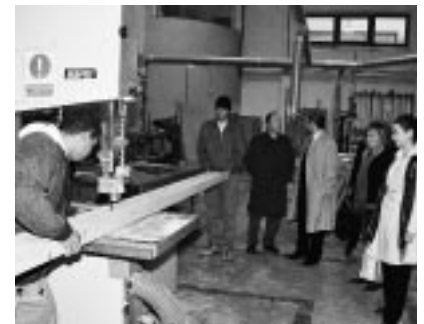
Módulo de carpintería de la Escuela Taller.