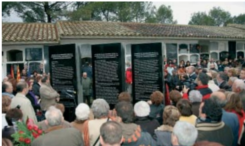
Momento del descubrimiento del Monumento Memorial.