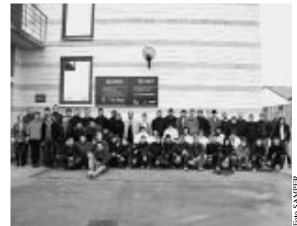
Todos los alumnos y monitores del Centro.