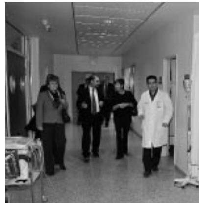
Área de urgencias.