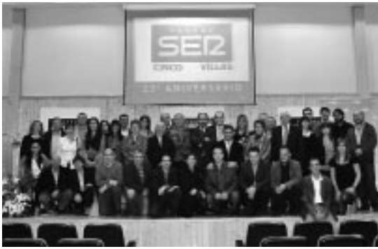
Imagen de grupo de profesionales y colaboradores de SER Cinco Villas.