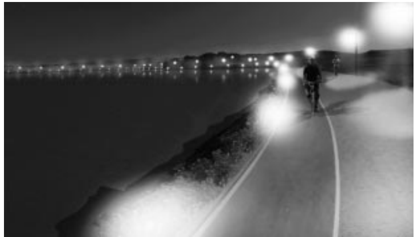
Recreación nocturna del Parque Lineal de El Gancho.