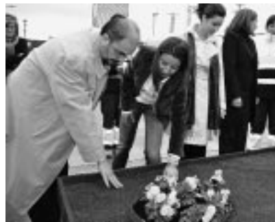
Trabajo del taller de jardinería.

Las empresas interesadas en participar en la 11 Feria de Ejea pueden consultar y descargar la documentación necesaria (reglamento de participación, hoja de solicitud y características técnicas de los stands) en página web www.sofejea.com .