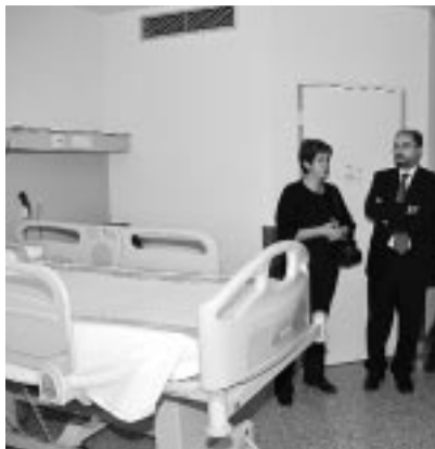
Una de las habitaciones del hospital.