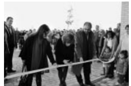
Corte de cinta.