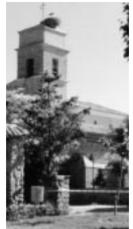
Rivas es, junto a Farasdués y los pueblos de colonización, una de las ocho piezas que forman el engranaje del plan estratégico que va a trazar el camino de su futuro.

El acto de presentación será aprovechado por la Junta Vecinal de Rivas para rendir homenaje a los riveranos que hace cincuenta años se afincaron en los recién creados pueblos de colonización para desarrollar un nuevo proyecto vital.