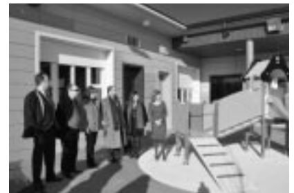
Zona de juegos.