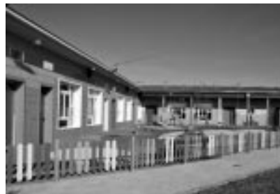
Patio de la Escuela Infantil.