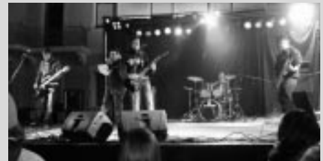
Los amigos del pollo.

Y continuando con más música, el lunes 14, la Casa de la música acogió al músico Angel Celada, batería de Vitoria, que ha colaborado en grabaciones y giras con los artistas pop rock españoles más importantes; El Último de la Fila, Mecano, Joan Manuel Serrat, Nacho Cano, La Unión, Malú, Manolo García o Miguel Bosé, entre otros. Así como en el mundo del Jazz y la música instrumental.