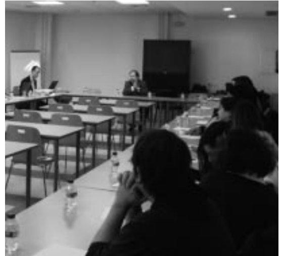
Una de las sesiones de trabajo con las Juntas Vecinales.

En 2010, como arranque del plan, se van a poner en marcha tres proyectos dinamizadores en los pueblos de Ejea: confluencia del cooperativismo agrario, desarrollo de un turismo sostenible y emprender en los pueblos. Antes se activarán los mecanismos de organización interna del plan mediante un comité de gestión, los consejos sectoriales y un comité de seguimiento y evaluación.