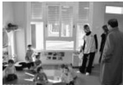
Una de las aulas.