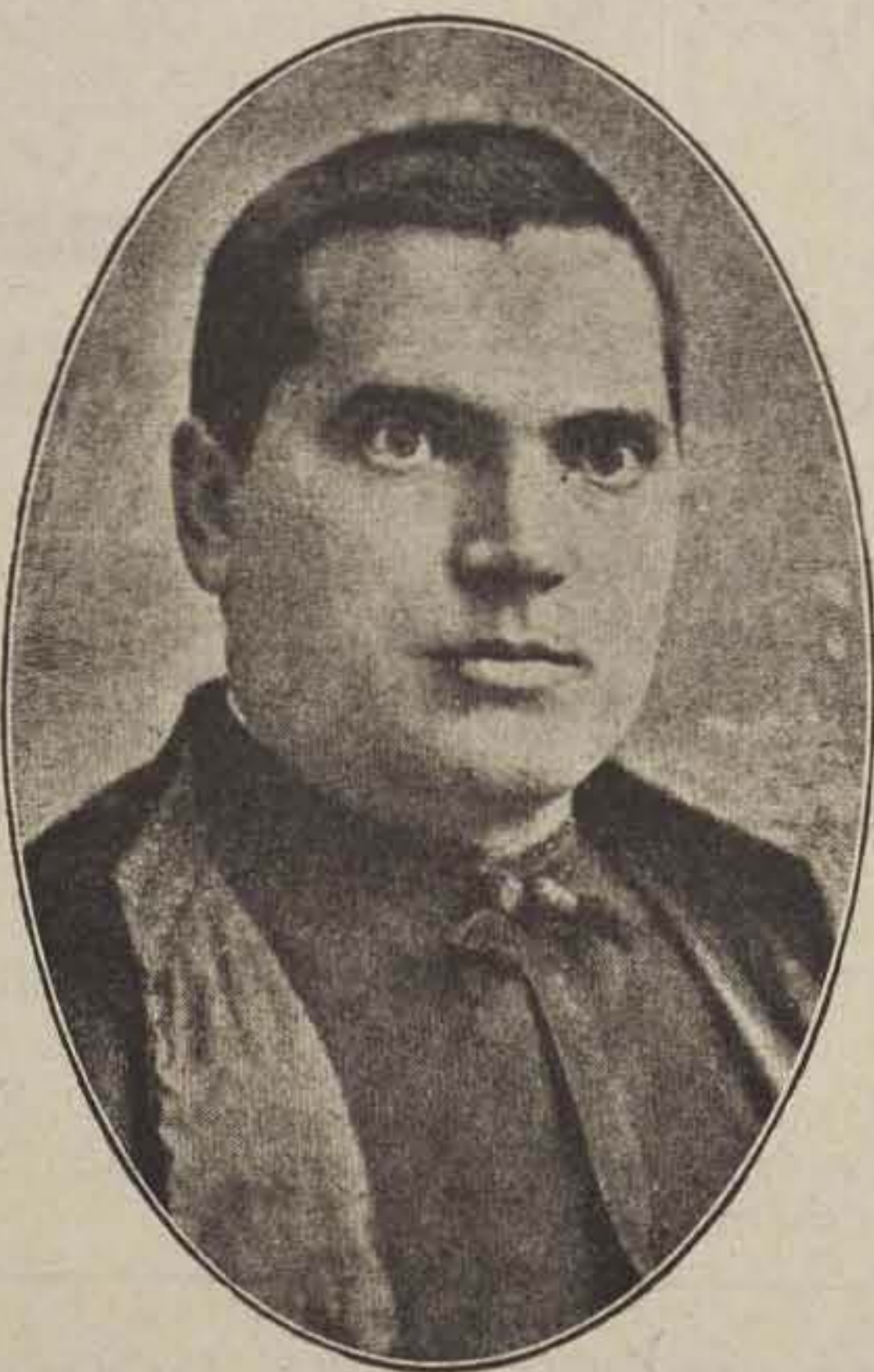
P. AGUSTIN NARRO Provincial de las Escuelas Pías de Aragón

den sagrada del Presbiterado y en 1897 se doctoró en Sagrada Teología. En junio de 1899 se presentó a oposiciones para la canonjía Lectoral de Zaragoza saliendo triunfante y comenzó a desempeñar en su Seminario la cátedra de Disquisiciones Teológicas. Fué preconizado para el Obispado-Priorato de Ciudad-Real el 27 de marzo de 1905, celebrando su consagración el 16 de julio en Zaragoza. Fué electo para la Sede episcopal de Segovia el 28 de mayo de 1914. A esos datos biográficos, que nos revelan ya las dotes extraordinarias de tan insigne Prelado, hemos de añadir que siempre ha descollado como orador profundo y elocuente y así existe en esta Ciudad