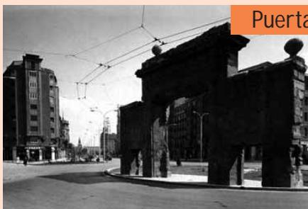
Puerta del Carmen