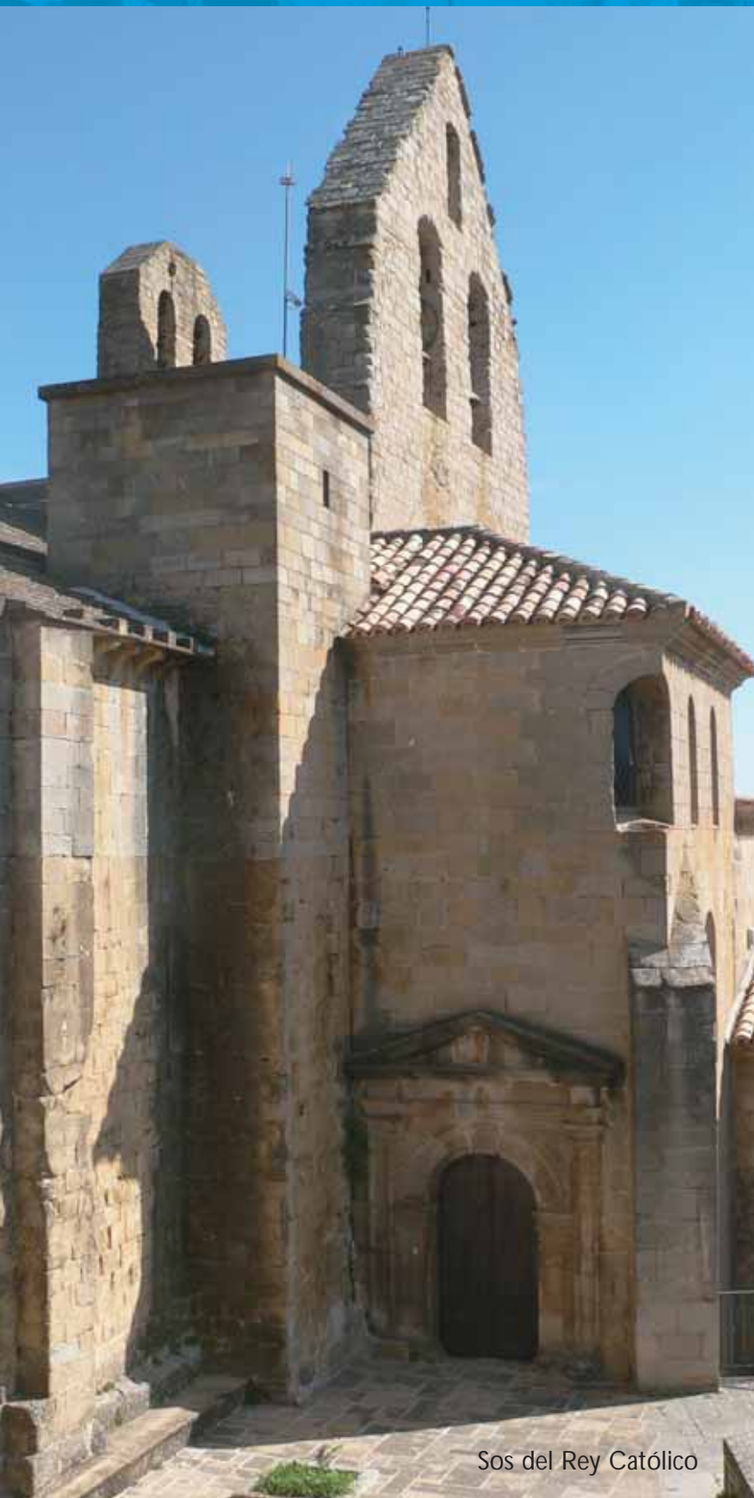
Sos del Rey Católico

Para alcanzar en el ejercicio 2008, los objetivos fijados en el área de mayores, el IASS dispondrá de una dotación presupuestaria de 95 millones de euros, que sufragan entre otros gastos, los programas de Transporte Adaptado, Balnearios, Hogares, Aulas y Universidad de la Experiencia. ■