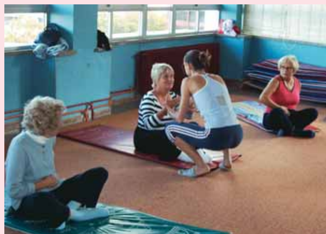
Seminario de Gimnasia.

"Soy Jubilado desde hace cinco años y vengo a Aulas desde hace dos. Este año he optado por la Informática y el Inglés. Nunca es tarde para aprender. He sido carpintero toda la vida y nunca toqué un ordenador ni por supuesto he nece-