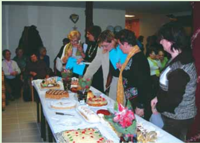
Talleres en Fraga.