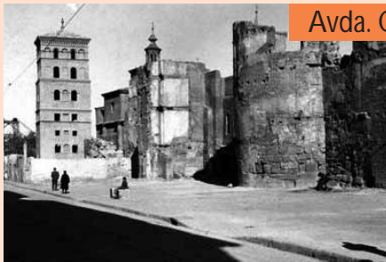
Avda. Cesár Augusta

A lo largo de la década de los 70 el casco antiguo de Zaragoza empieza a quedarse vacío y a deteriorarse muchísimo. ■