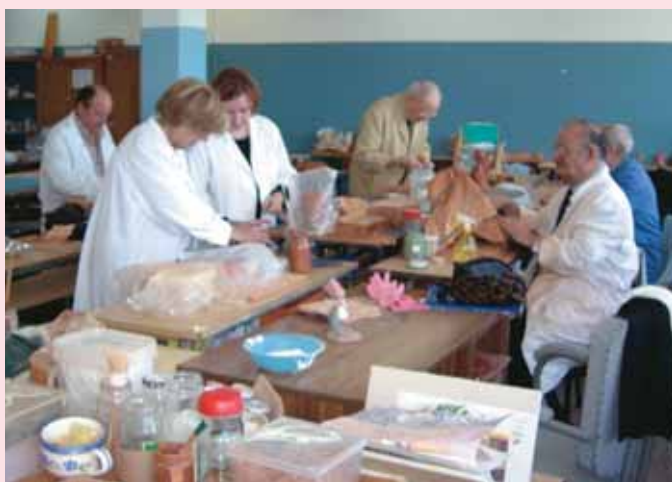
Seminario de Cerámica.

Estas son algunas de las opiniones recogidas: