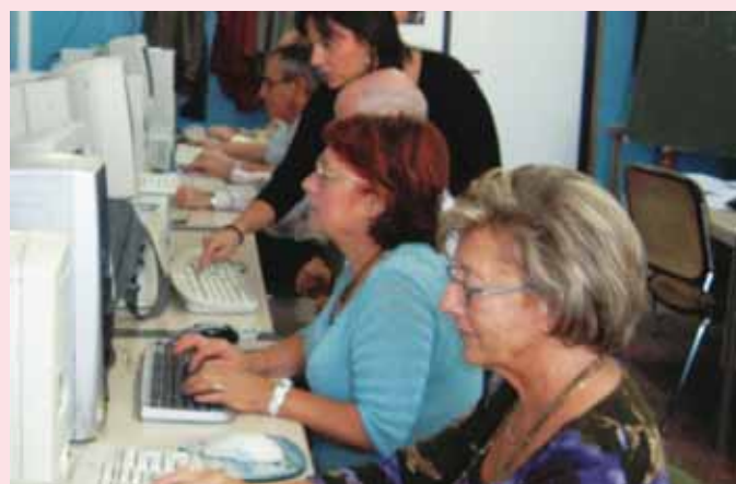
Seminario de Informática.

"Tengo 82 años y ahora vengo a Pintar. He sido alumna de muchos cursos, llevo aquí casi diez años, en Aulas, pero por la edad y la pereza, los achaques me he centrado en la pintura. Disfruto tanto con lo que hago... Vengo no sólo a clase, también a pintar por libre y luego la profesora me corrige y orienta... No podría vivir ya sin pintar" (Alumna del Seminario de Pintura). ■