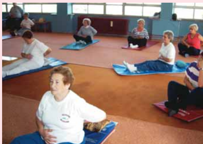
Seminario de Educación Física.

Acompañando las distintas clases teóricas de cada materia, se realizan viajes culturales vinculados a determinados seminarios, conciertos, exposiciones y una jornada de puertas abiertas para que todos aquellos interesados puedan ver y disfrutar del trabajo de los mayores durante todo el año. Se pretende que la educación que reciban los inscritos sea multidisciplinar y de lo más completa.