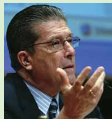
Federico Mayor Zaragoza, ex director general de la UNESCO

Para celebrarlo se han realizado varios actos. Entre ellos, destacamos la conferencia que corrió a cargo de Federico Mayor Zaragoza, ex director general de la UNESCO. ¡Cuántas personas habrán pasado por las aulas de los colegios calasancios por toda España en general y en Aragón en particular! ■