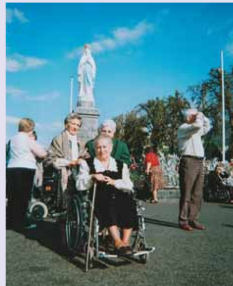
Paseo por Lourdes.

recientemente, que necesita muletas para poder andar. Una vez que llegamos a ese lugar, conseguimos que una voluntaria nos llevase a la Gruta, en realidad, una iglesia subterránea, para presenciar la procesión de los enfermos, que me impresionó enormemente. Una de las cosas más impactantes es que, ante tanto dolor, se ve a los enfermos llenos de serenidad y paz interior. La visita a Lourdes supone una gran lección para los que nos plegamos ante cualquier problemilla. ■