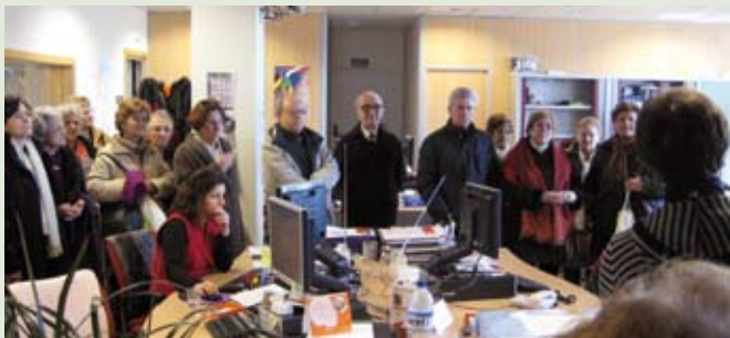
Walqa, Aragón TV y Radio.

El parque tecnológico WALQA, en Huesca, dedicado a las TIC (tecnologías de la información y comunicación), puede definirse como un gran centro de empresas, dedicadas a “fabricar” ideas y productos de alta tecnología: los teléfonos móviles del futuro, coches de hidrógeno, aplicaciones domóticas, soluciones informáticas y redes de comunicación.