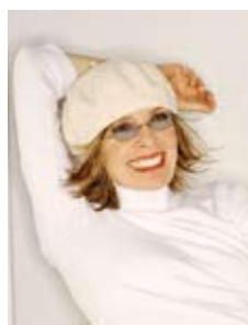
Diane Keaton con L'Oreal.

Lo cierto es que las compañías de servicios financieros están esforzándose para atraer al mercado