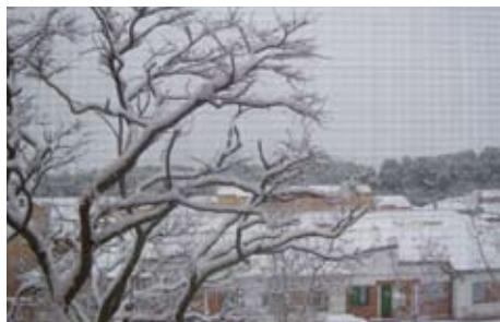
Foto de Andorra recién nevada.

Por fin se cumplió el sueño de la mayor parte de los andorranos. Los vecinos de la localidad turolense saludaron al nuevo año con una nevada.