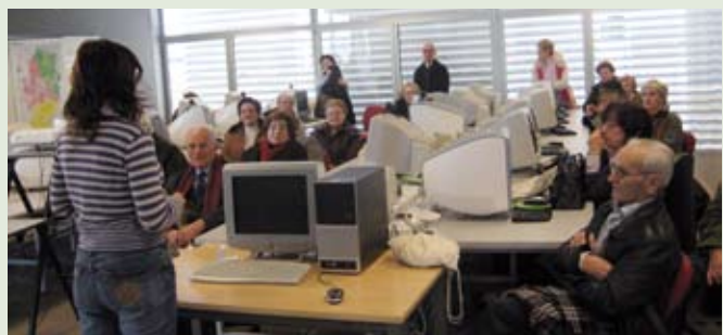
Walqa, laboratorio de usabilidad.

En definitiva, nos dispensaron una gran acogida y la información que recibimos nos trasladó a un futuro que desde aquí parece próximo. ■