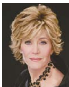
Jane Fonda con L'Oreal.

La empresa Guillem lleva muchos años analizando y comparando las necesidades de una sociedad que cada vez es más mayor y que podríamos dividir en tres grupos. Los prejubilados (entre 50 y alrededor de 62 años), los jubilados activos (entre 62 y alrededor de