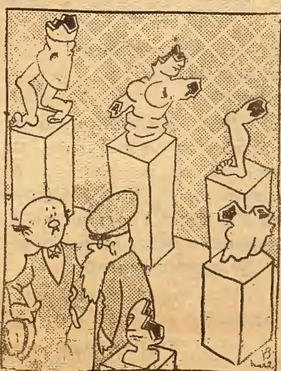
El visitante.—¿Algún terremoto? El consejero.—Ca, no señor. Es que ayer le tocó de visita a los falangistas.