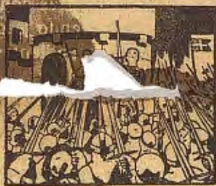
Diez mil espadas inglesas alzáncse jurando fidelidad a Las Cruzadas.