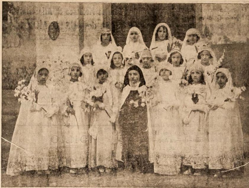
Alumnas del Colegio de San Vicente de Paúl de esta ciudad que recibieron por primera vez la Sagrada Comunión

La inadvertencia más pronunciada que notamos en estos contextos de solución es la que se desprende de la manera de concebir el problema que nos ocupa, considerándole como lo consideran una cosa aislada de otra serie de cues-