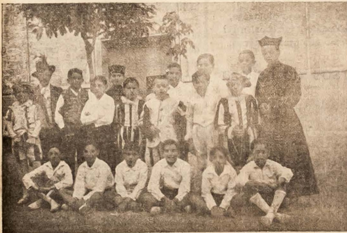
En las fiestas celebradas en este Colegio de Escolapios para solemnizar la Canonización de San Pompilio, estos niños, representaron magistralmente la inspirada zarzuela del P. Félix «El Taumaturgo de Nápoles».

dios necesarios y precisos para emprender la lucha por el pan cotidiano a causa de su inhabilidad para la clase de trabajo en aquellas imperante. Tras esto, viene la indignación, el pauperismo con todas sus terribles consecuencias. La concurrencia excesiva de brazos, crea la falta de trabajo y con ello se impone la premura de atender al problema, la mayor parte de las veces, con remedios no solo ineficaces, sino contraproducentes. La prestación de asistencias o socorros individuales, la apertura de obras improductivas y temporales y otros recursos similares, lejos de solucionar el problema, lo exacerban y agudizan; el espejuelo del auxilio individual y la percepción de un salario en trabajos no especializados, ni necesarios, no productivos, atrae a las ciudades más y más campesinos, agravando la cuestión y acumulando conflictos para el ma-