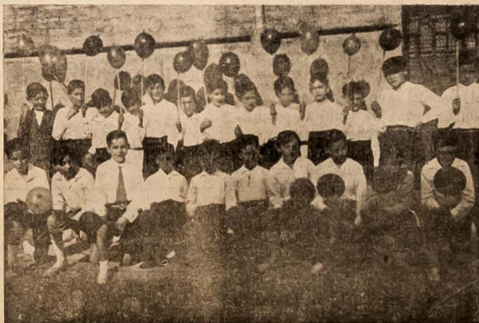
«El juego del Globo». Número musical de sorprendente efecto que estos niños ofrecieron al selecto público en la velada de los PP. Escolapios, bajo la dirección del competente profesor de música D. S. Peñas Echeverría.

Católico y amante del S. Corazón de Jesús, acude mañana a la Hora Santa de la S. I. Catedral a honrar al S. Corazón, a ofrecerle de buena voluntad el tuyo, para que Jesús le llene de vida espiritual, sobrenatural, elevada y única que puede darte la paz, la alegría y el consuelo.