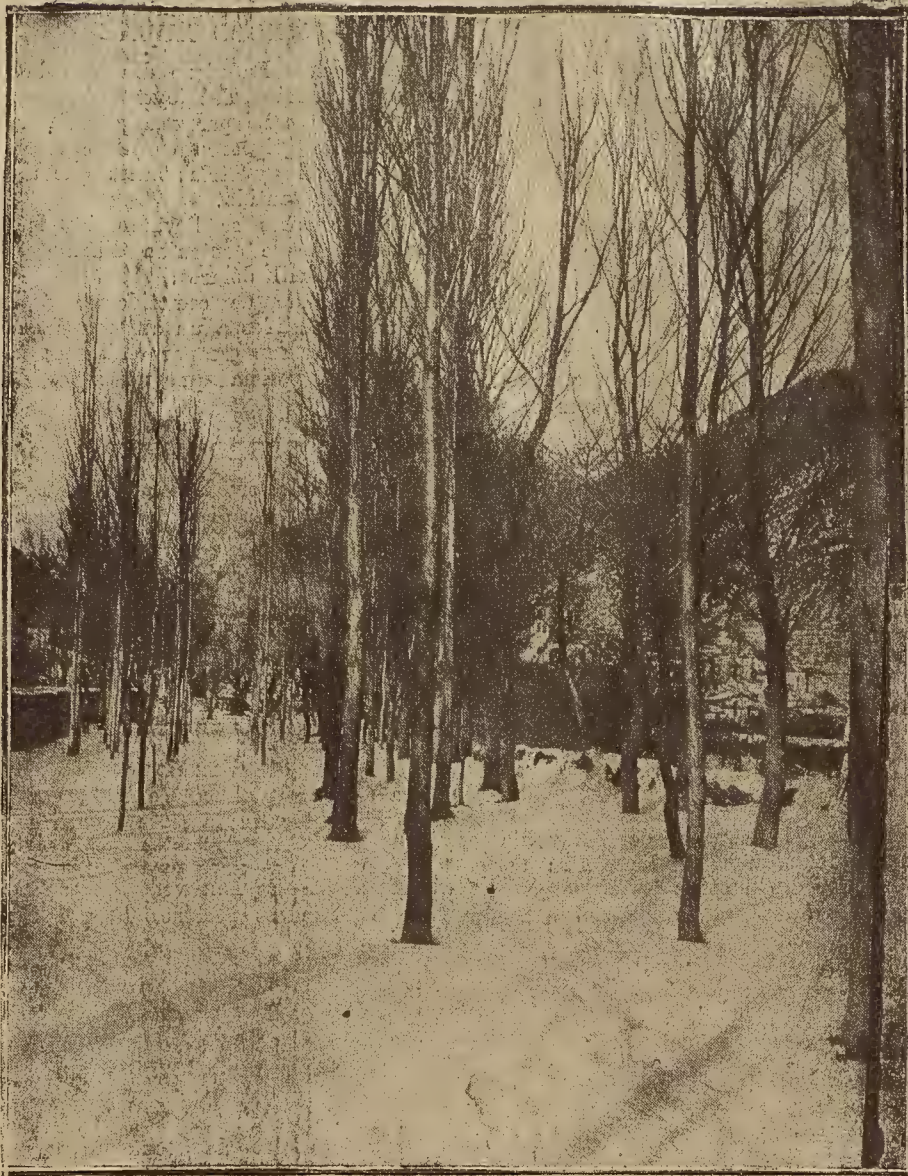
ARAGON PINTORESCO.—LA CONCHADA, DE BIESCAS