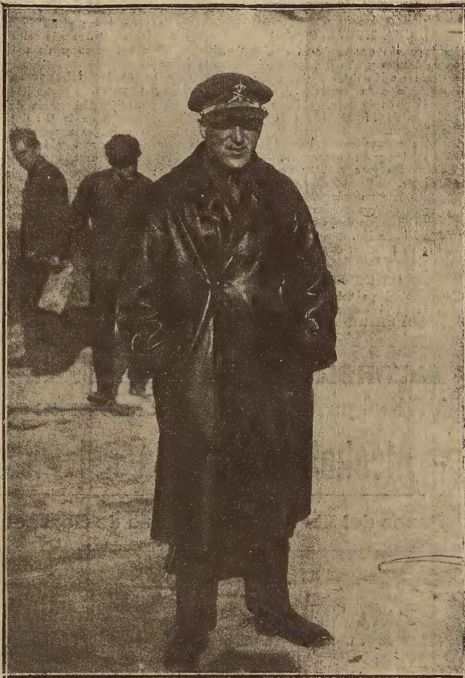
FIGURA DE ACTUALIDAD.—EL CAPITAN RUIZ DE ALDA, QUE ACOMPAÑA AL COMANDANTE FRANCO EN EL «RAID» DE AVIACION CADIZ-BUENOS AIRES

Claro es que personalmente no lo habrán conocido, porque el que fué director del Banco de San Carlos y ministro del intruso rey José, vivió a fines del siglo XVIII y comienzos del XIX.