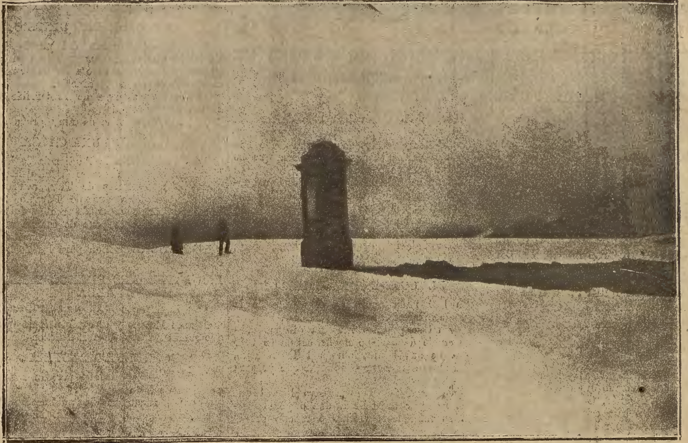
EL PUERTO DE SOMPORT.—EL POSTE FRONTERIZO HISPANOFRANCES DURANTE LA ULTIMA NEVADA

túmbrese a extraer el cerebro antes de dar tierra a los cadáveres. También se han hallado restos de ciervos y osos y montones de moluscos fósiles.