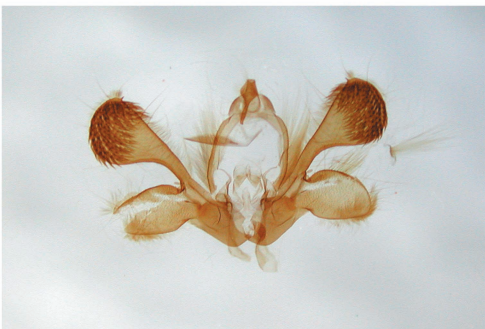
Genitalia de un macho de Mythimna unipuncta