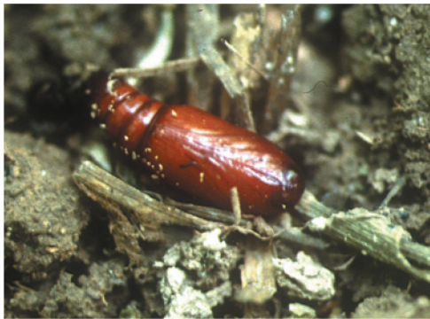
Crisálida de Mythimna unipuncta