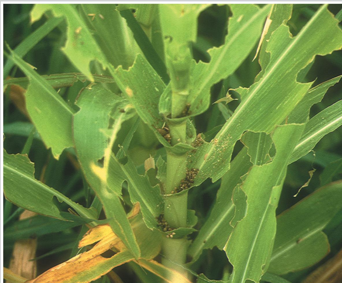
Daños de Mythimna sobre maíz y restos de excrementos