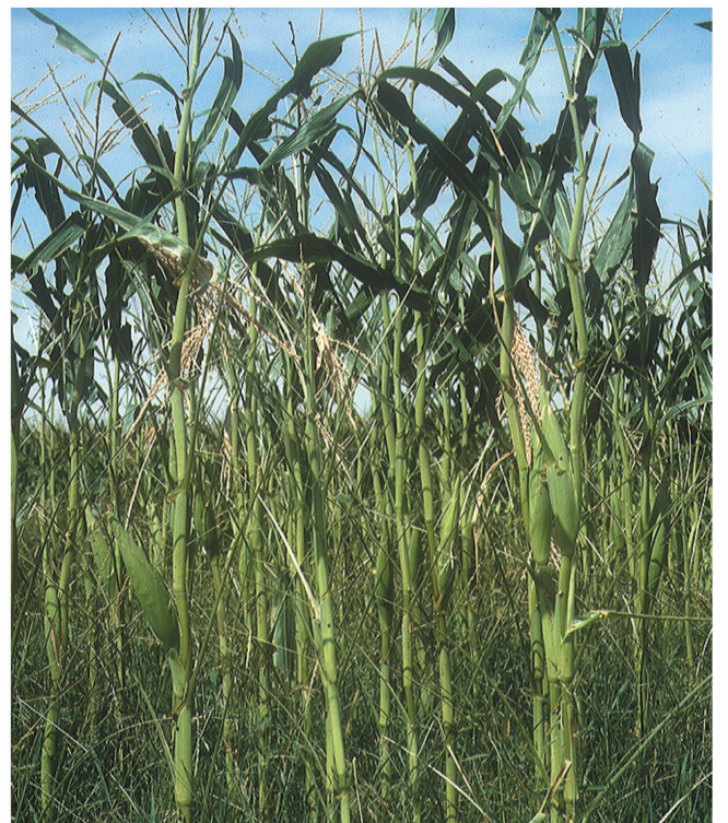
Parcela con alta infestación de malas hierbas y daños de Mythimna