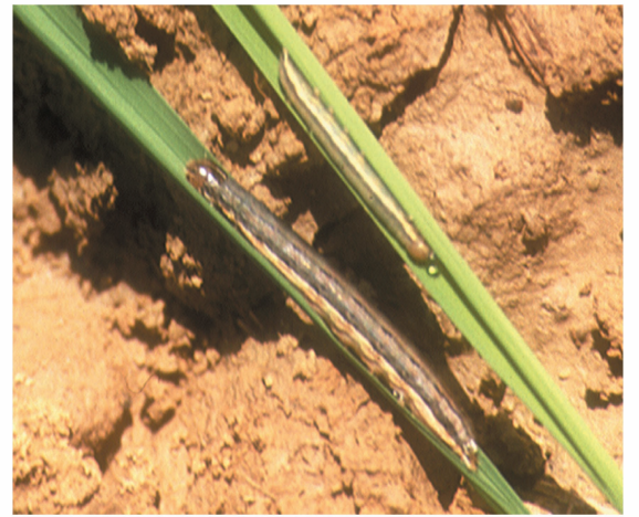
Larvas de Mythimna unipuncta sobre plantas de maíz (izquierda) y de arroz (derecha)