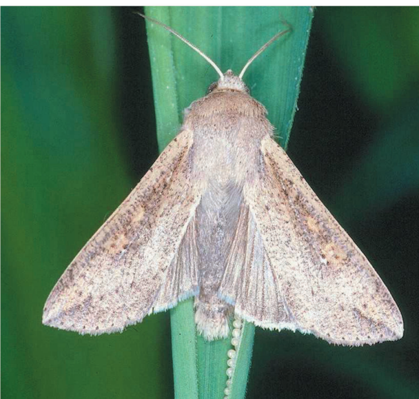
Adulto de Mythimna unipuncta y detalle de una puesta sobre maíz