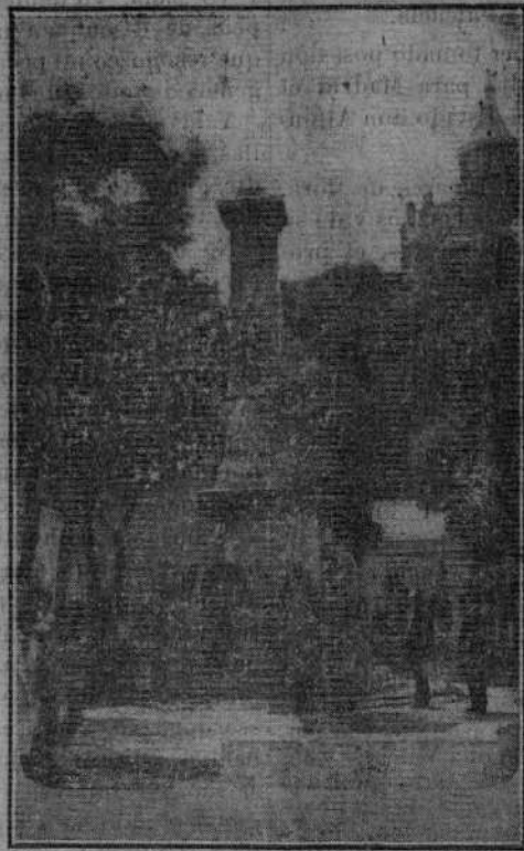
EL MONUMENTO A LOS HÉROES DEL 3 DE JULIO Y 4 DE AGOSTO, ERIGIDO EN LA PLAZA DE LA LIBERTAD