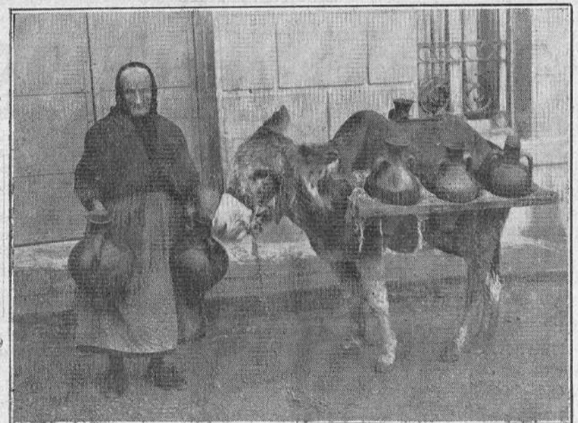
Decana de los aguadores de Teruel

murieron de viejos. Al tercero hubo que matarlo porque se le «enclavijaron» y no podía comer. —Y ahora ¿qué va usted a hacer con la borrica? —Venderla a los gitanos. —¿A los gitanos, precisamente...? —¡Sí, señor, porque es algo «guifosa». —¿Le ha roto muchos cántaros? —¡Ninguno! ¡Si es muy mansa! Pero es cuando está trabajando conmigo y por respeto a su ama, pero en cuanto se la llevan al campo no hay quien pueda con ella. (Sin duda—pensamos, y así se lo decimos a esta simpática viejecita—es que entonces la talentuda borrica echa de menos los coscurros y otras golosinas que tía