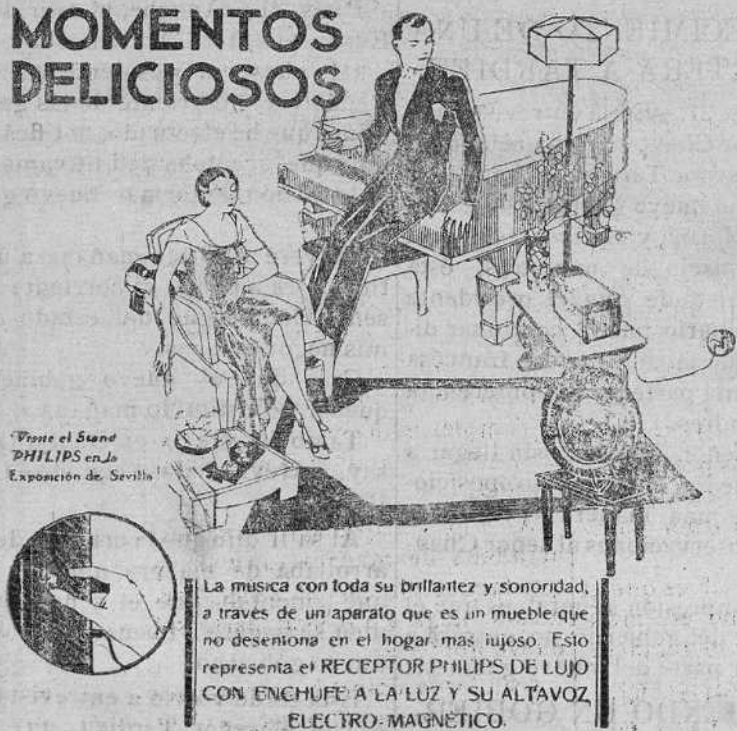
Viste el Stand PHILIPS en la Exposición de Sevilla

La música con toda su brillantez y sonoridad, a través de un aparato que es un mueble que no desentona en el hogar más lujoso. Esto representa el RECEPTOR PHILIPS DE LUJO CON ENCHUFE A LA LUZ Y SU ALTAVOZ ELECTRO-MAGNÉTICO.