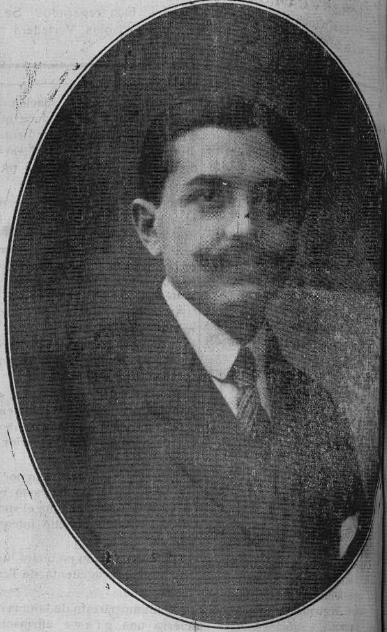
Presidente de la Excmo. Diputación de Teruel