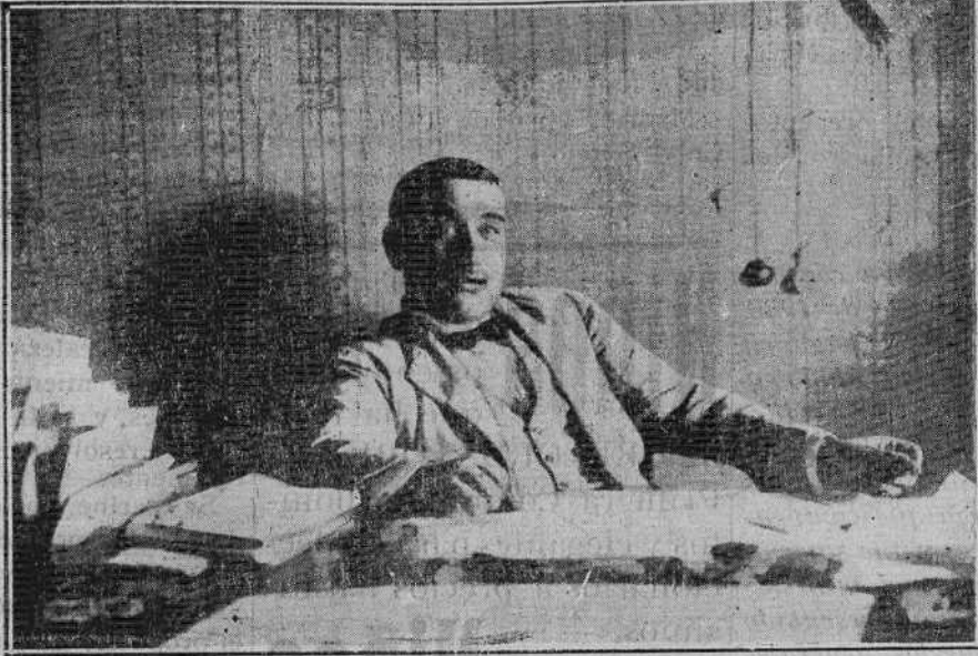
Alcalde presidente del Excmo. Ayuntamiento de Teruel