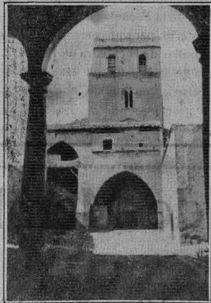
LA TORRE DEL HOMENAJE EN EL FAMOSO CASTILLO DE ALCAÑIZ.