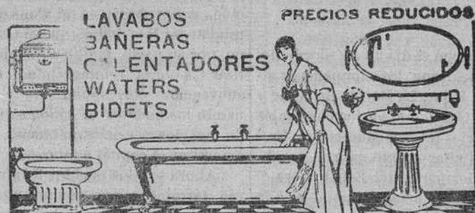
ERNESTO FERRER, BARCAS, 2-VALENCIA

Consúltense precios y presupuestos AINSAS, 2.—TERUEL