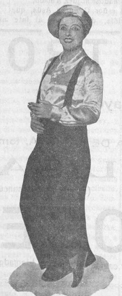
La popular y excelente su-pervetedete, que conocerá nuestro público en «Las Leandras»