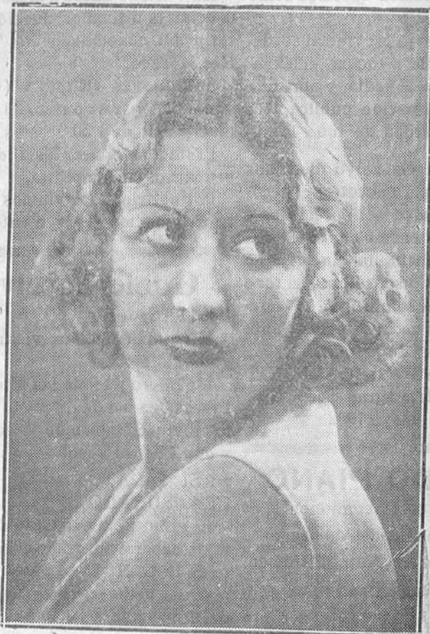
«Vedete» de la Compañía que debuta el martes en el Marín con «Las Leandras»