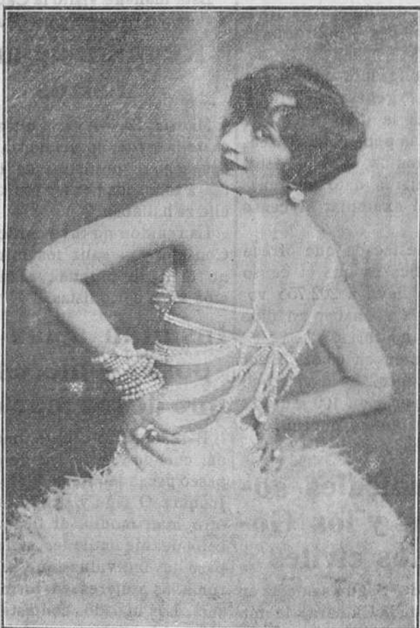
Balzarina internacional de la Compañía del Ruzafa que el martes debuta en el Marín con «Las Leandras»

«Boicot a la industria catalana»... Y a esto no hay derecho, señoras y señores. No hay derecho a que estén ustedes «hinchando el perro» de esta manera tan escandalosa. Este buen pueblo español ha inventado una frase, a la cual se le suele aplicar a aquellos que no juegan limpio... Y la frase, señoras y señores, es esta: «Se os ve el plumero». Yo, aunque un poco ignorante, sé por qué dirigís vuestros dardos contra Cataluña, contra esa región que hoy reclama, consciente de su capacidad intelectual e industrial, basándose en un principio netamente federalista, su autonomía, su libertad para vivir conforme a su fe en la doctrina de aquel gran republicano que se llamó don Francisco Pí y Margall... Sé por