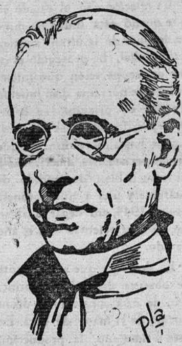
AYUDA A LAS FELICES INICIATIVAS

Y he aquí ahora otro objeto de vuestro papel.