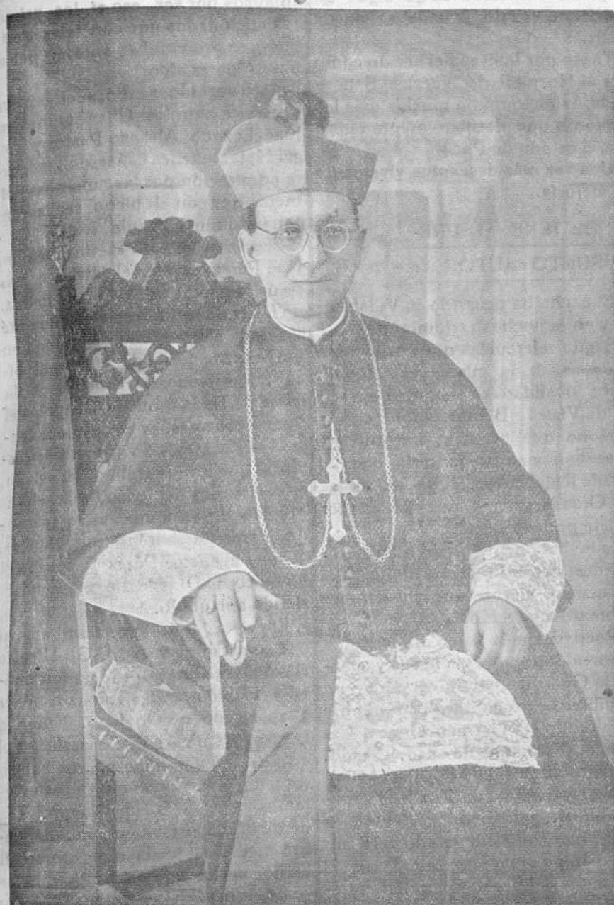
NUUESTRO AMANTISIMO PRELADO FRAY ANSELMO POLANCO Y FONTECHA

Asisten al acto las autoridades civiles, militares y eclesiásticas de aquella capital