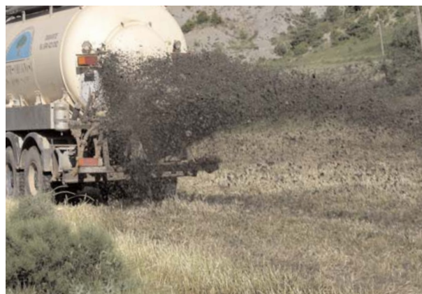
Distribuyendo purín.

Si utilizamos purín como fertilizante y no se dispone de análisis del mismo, una aproximación sería que las 170 unidades de nitrógeno orgánico que indica la norma están contenidas en unos 25-30 metros cúbicos de purín de cebadero o en unos 50 de purín de granja de producción de lechones, calculándose sobre unas riquezas medias del 6 al 7,5 kg de nitrógeno por metro cúbico en el primer caso y de 3,4 en el segundo.