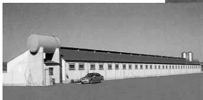
NAVE DE PORCINO