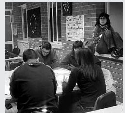
Taller somos jóvenes x igual

es preciso para que asimismo contribuyan al cambio social. Necesitamos vuestras voces,