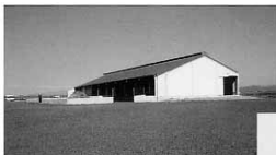
NAVE DE OVINO