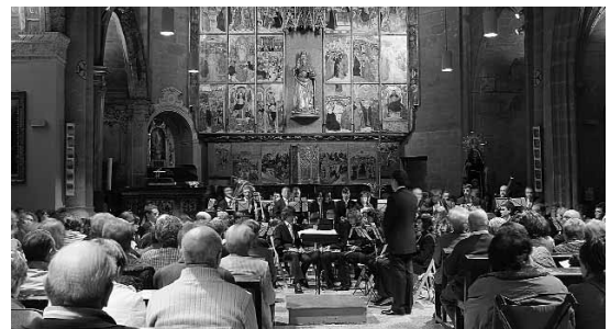
Actuación de la Banda de Música de Ejea.