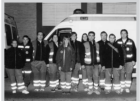
Voluntarios de la Cruz Roja de Ejea de los Caballeros.