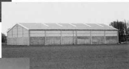
ALMACEN DE CEREALES