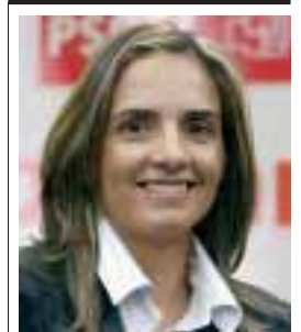
SUSANA Sumelzo ha sido elegida Senadora