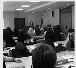
Curso de igualdad d género