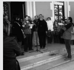
Lectura de manifiesto