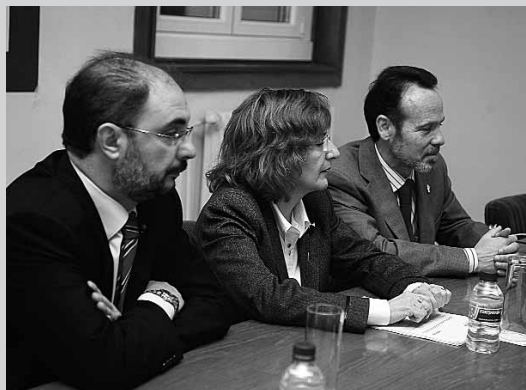
Javier Lambán, M. a Victoria Broto y Miguel Ángel Sánchez, Concejal de Nuevas Tecnologías, en la presentación de Ejea@conecta

El proyecto Ejea@conecta mejorará los servicios de gestión y atención al ciudadano desde la Administración local mediante su tramitación telemática. Uno de sus principales objetivos es la creación de una base de datos corporativa única de ciudadanos y de territorio y la implantación de un sistema íntegro de gestión en el que se digitalizarán trámites y servicios públicos.