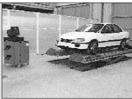
Alineación de direcciones