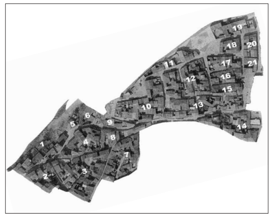
Zona de actuación de la primera fase del Área de Rehabilitación Integral del Casco Histórico de Ejea de los Caballeros