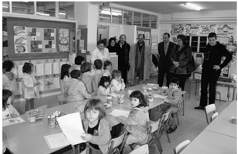
Visita al Colegio Público «Ferrer y Racaj».