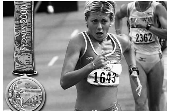
La marchadora María Vasco.