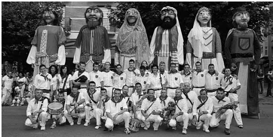
La Comparsa de Gigantes de Ejea estará en la Expo.