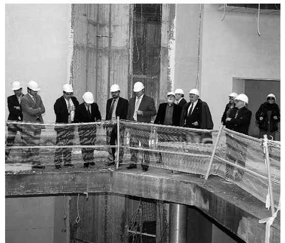
Momento de la visita al Centro Empresarial de Negocios.

El Centro Empresarial de Negocios fue promovido por el Ayuntamiento de Ejea y ha sido desarrollado por la empresa Inversiones Hermal. Su objetivo es ofrecer a las empresas del