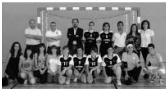
Equipo de balonmano femenino de Ejea.

excelente predisposición, una gran competitividad y un excelente espíritu de sacrificio, en sus diferentes encuentros deportivos.