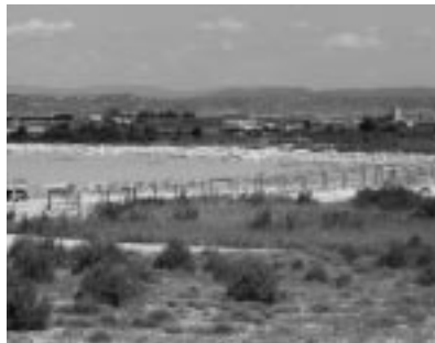
Pasarela en construcción.