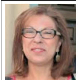
LA CONSEJERA de Ciencia y Tecnología abordó el futuro agroalimentario del municipio ejeano.