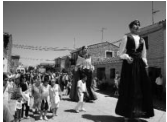
Comparsa de Gigantes de Tauste.