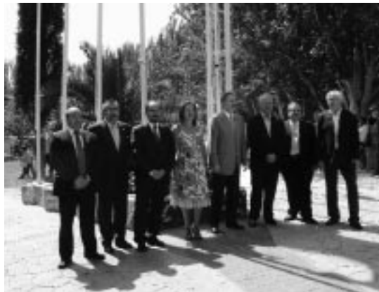
Autoridades en el Parque Central.

En ese sentido, justificó plenamente la subida de impuestos anunciada por el Gobierno, «que afectará a las rentas de capital y no a las del trabajo».