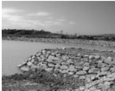
Mirador en la Estanca.

El presupuesto de esta obra ronda los 6 millones de euros.