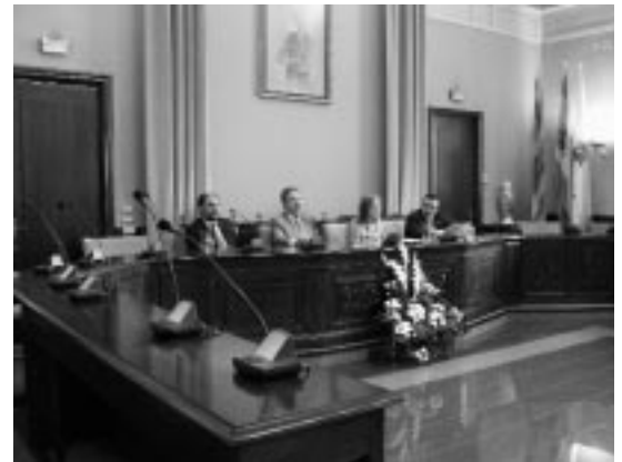
Acto Institucional en el Ayuntamiento.