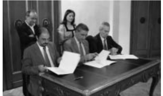
Firma del convenio con la UNED.