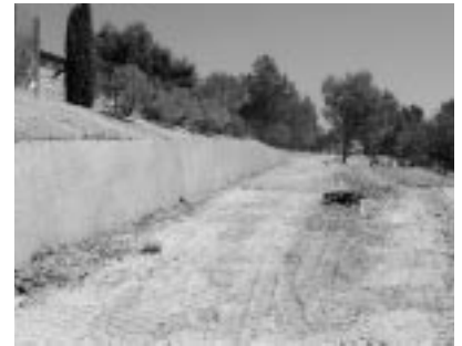
Accesos desde La Llana.