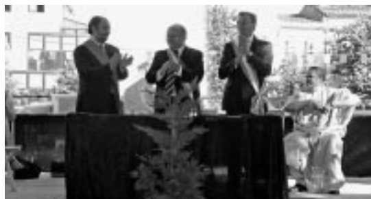
Alcaldes de Ejea, Marmande y Portogruaro.

Los deportes fueron magníficamente representados por el Club Acuático de Ejea, dos jóvenes triatletas femeninas ejeanas y el equipo femenino de balonmano. Todos ellos, y pese a su juventud, han hecho gala de una