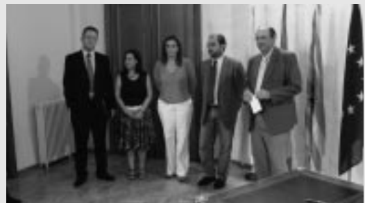
Representantes de Ibercaja y Fundación Elvira Otal.

La Fundación Elvira Otal, acogiendo a esta «4ª Convocatoria Ibercaja de Ayudas para Proyectos Asistenciales 2009», presentó el «Proyecto de Atención Personalizada en el Centro para Personas Gran Dependientes», dentro de los fines funcionales de la propia Fundación, que engloba la realización de obras de interés social y/o cultural en beneficio de la comunidad en la que realiza sus actividades y en concreto