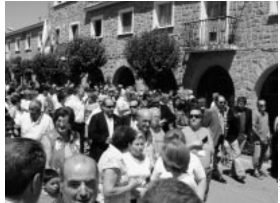
Alcaldes, Concejales y ciudadanos en Pinsoro.

Todos los años la Comarca celebra su día de forma rotativa en uno de sus pueblos.