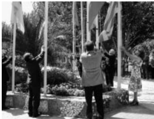
Izamiento de banderas.