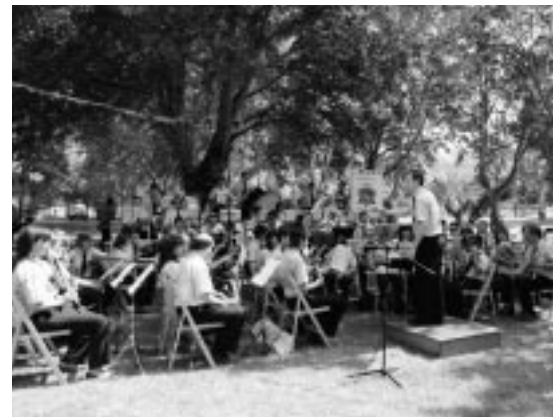
Actuación de la Banda de Música de Ejea.