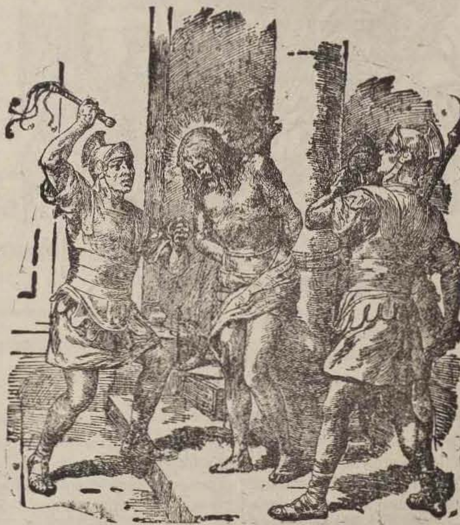
Jesús atado a la columna