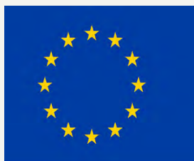
Fondo Europeo Agrícola de Desarrollo Rural: Europa invierte en las zonas rurales