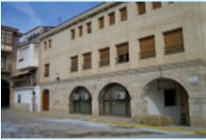
Imágenes del pueblo de Ballobar

Los mayores de la comarca del Bajo/Baix Cinca , fuimos invitados a participar en la jornada y fuimos muchos los que acudimos a la cita.