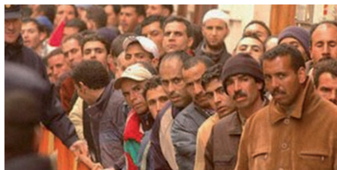
Inmigrantes en desempleo

Transformar lo negativo a positivo será una cura de humildad y no estará mal. ■