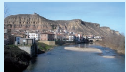
Imágenes del pueblo de Ballobar