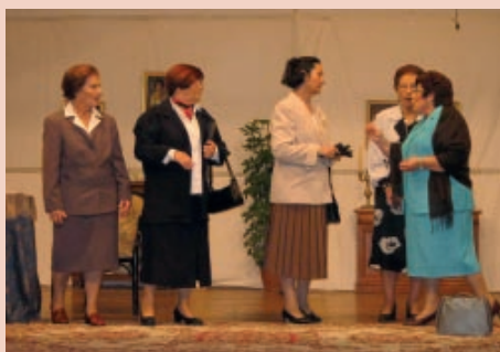
"Pensión para Señoras"

Finalmente, un grupo de ellas cantó y representó el "Coro de las Espi-