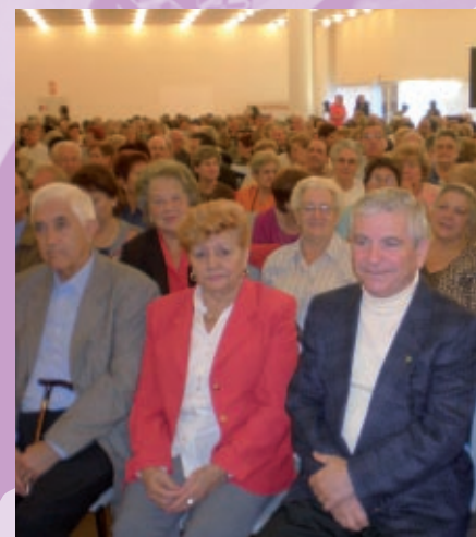
Foto del público

Gracias al IASS, a la Fundación La Caixa y a todos los que nos brindan estas oportunidades de encuentro con la vida cultural y social. Quienes más lo valoran son los mayores como protagonistas de los hechos. ■