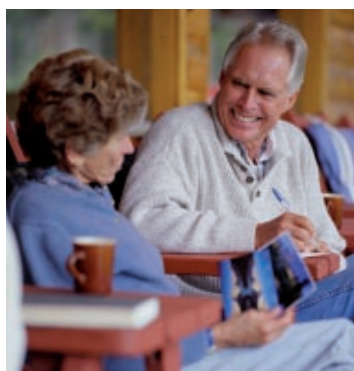
Mash. IASS Delicias

Ciclo económico: "dícese de la fluctuación del valor que toma una variable a través del tiempo". Según esta definición, entendemos crisis económica como una tendencia a la baja del valor de toda variable económica. En esta tendencia a la baja, podemos diferenciar dos fases distintas, que son la recesión y la depresión.