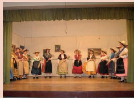
"Coro de las Espigadoras"

Pretendemos que, el grupo pueda tener continuidad y se amplíe con más socios que quieran formar parte del mismo. ■