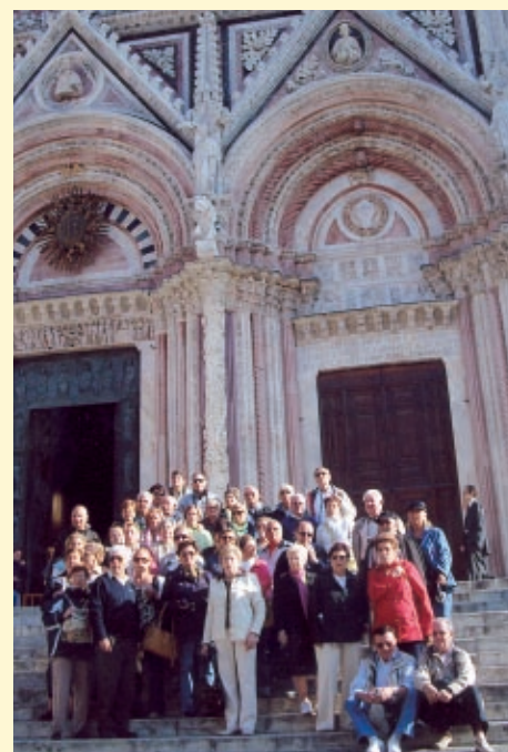
Foto del grupo durante el viaje

El viaje no careció de algún pequeño contratiempo, que con la buena fe de todos, se resolvió favorablemente. Todos los que fuimos nos hemos quedado con deseos de repetir. Si hubiera sido por nosotros nos habríamos quedado por allí un mes. Esperamos poder repetir otro viaje, si no igual, parecido. ■