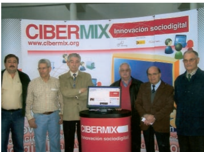
Socios del Hogar que acudieron a dicho foro

Las nuevas tecnologías fueron las protagonistas en el recinto ferial de Barbastro con Cibermix y Somonparty, dedicados a dar a conocer las ventajas del uso de estas herramientas. Durante 35 horas seguidas, los amantes del mundo de la informática pudieron ejercitarse y compartir información.