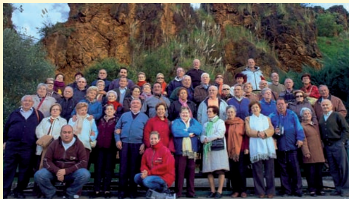
Foto del grupo en el parque de Cabárceno

Cómo cada año, en el Hogar de Andorra se organiza para finales de octubre un viaje sorpresa.