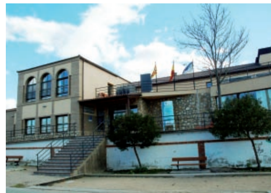
Hogar de Andorra

móvil, manejo de cajeros automáticos, cursos de informática, de Internet, risoterapia, cuentos terapéuticos, taller de memoria, taller de pintura, además de los juegos que podemos considerar tradicionales como pueden ser, billar, ajedrez, petanca, parchís, dominó, guiñote, etc. ■