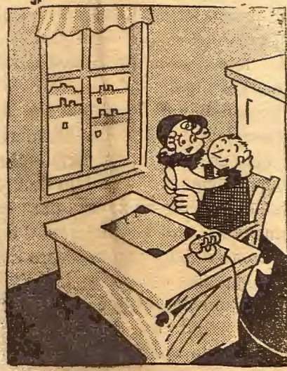
La taquimeca. - Y hoy me llevarás al cine, ¿verdad, riquín? El señor: ¡Ave María Purísima! De ninguna manera. Dícan en «La Sierra» que la película es inmoral.