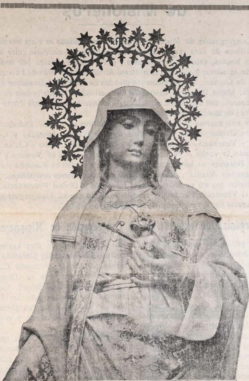
IMAGEN DEL CORAZON DE MARIA QUE SE VENERA EN SU TEMPLO DE BARBASTRO.