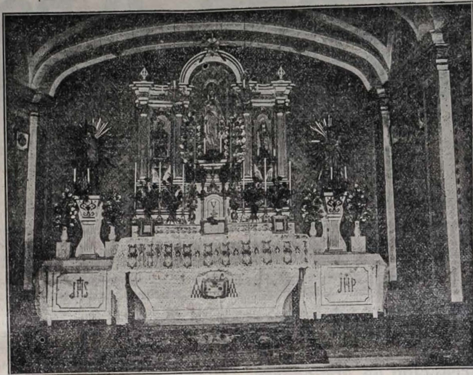
PP. Misioneros—Barbastro. Altar del oratorio de los postulantes.

Y no se le conoce porque no se le llama, ni se le busca, ni se le estudia. Esta es la ingratitud más horrible que existe, el más grande baldón de igno-