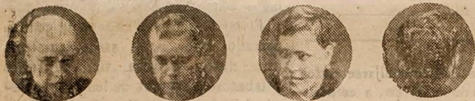
14 años calvo 8 meses tratamiento 10 meses Curado en 15 meses

Desde el año 1927 hasta la fecha se han curado más de 10.000 de todas edades, pudiendo garantizar que no ha fracasado ningún tratamiento. Exposición permanente de casos curados.—Consulta gratuita.—Diez y siete establecimientos funcionan en España y ocho en el extranjero.—Su inventor J. MOURADE, ha sido distinguido con las más altas recompensas y nombrado miembro honorario del Jurado de Sanidad en Francia y Londres.—La eficacia del Capilar J. MOURADE está reconocida por los médicos de España y del extranjero.