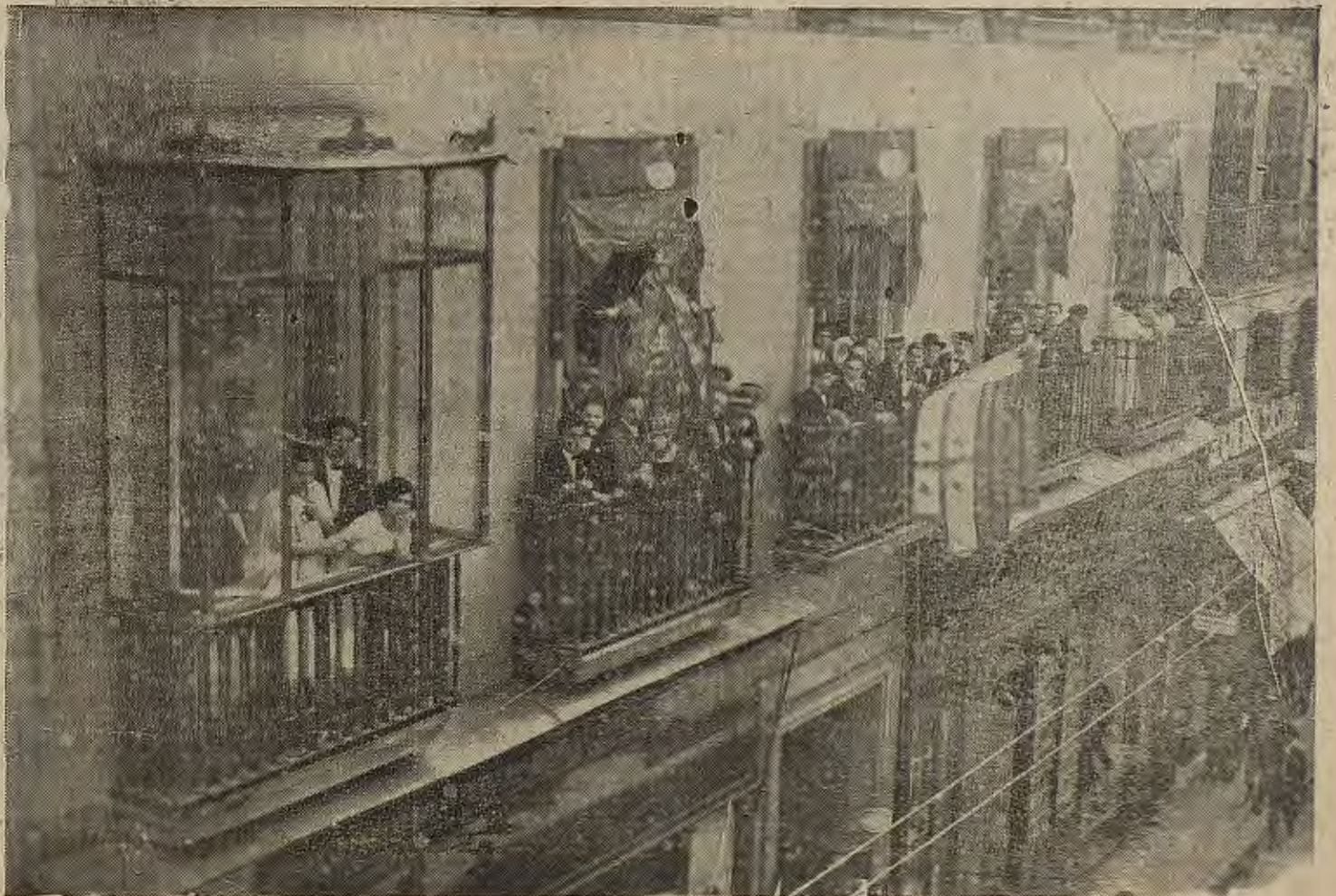
EL ORFEON ZARAGOZANO EN MADRID.—En los balcones del Círculo Aragonés con la bandera de dicha Sociedad y la del Orfeón