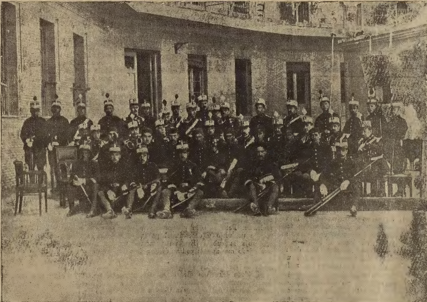
FIESTA DE LOS INGENIEROS PONTONEROS EN HONOR DE SU PATRON SAN FERNANDO. — Reparto de premios efectuado ayer en el cuartel de San Genís.

En Ascó (Tarragona), un vecino de la villa tuvo la desgracia de ser arrollado por un tren al atravesar la vía. Resultó con gravísimas heridas que hicieron necesaria la amputación de ambas piernas.