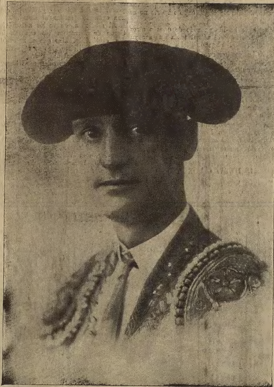
FIGURA DE ACTUALIDAD.—El matador de toros aragonés Nicanor Villalta a quien sus amigos y admiradores obsequian hoy con un banquete para celebrar los triunfos que ha alcanzado esta temporada