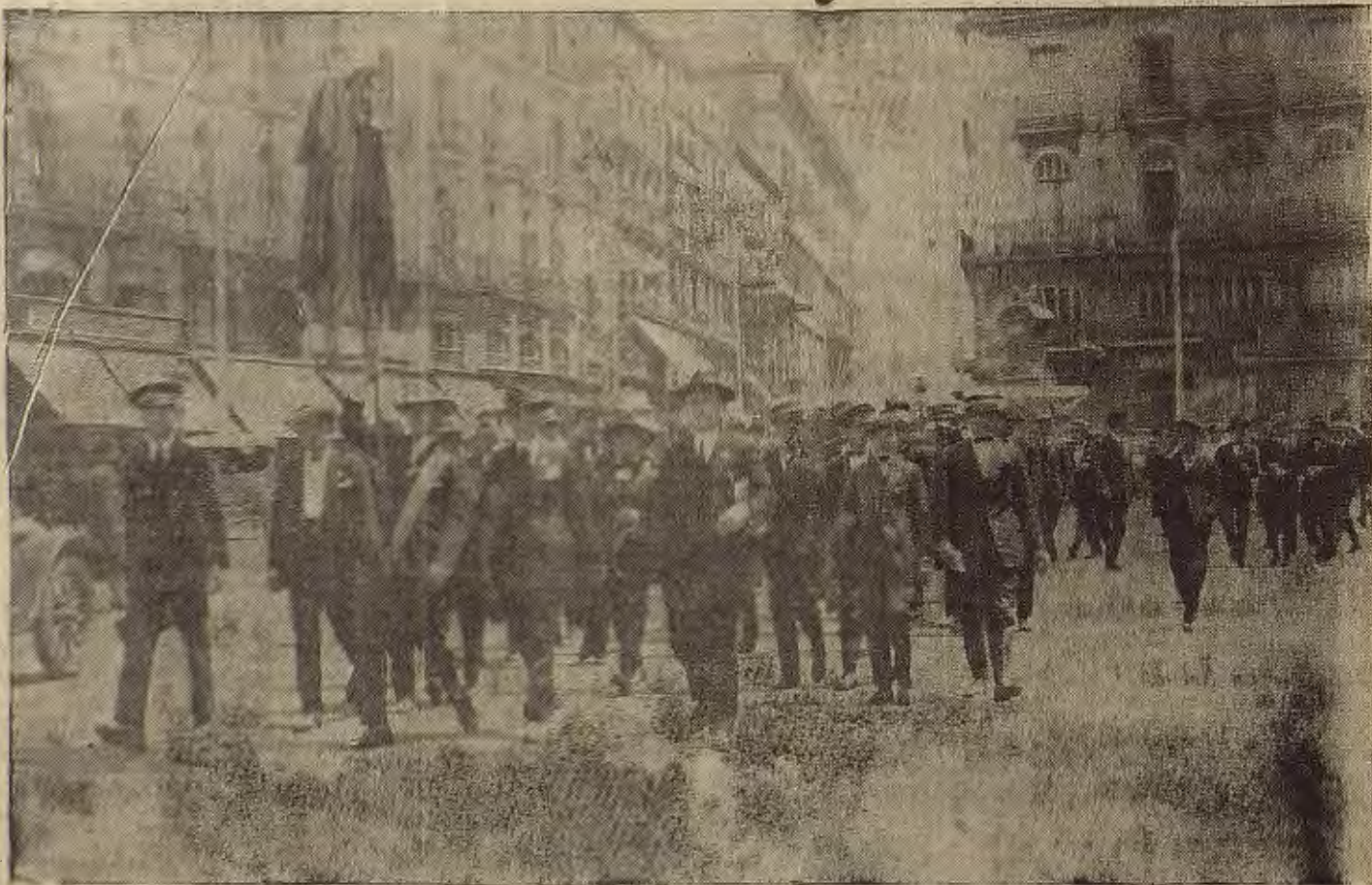
MADRID—El Orfeón Zaragozano al pasar por la Puerta del Sol con su estandarte

Suscríbase a LA VOZ DE ARAGÓN en sus oficinas, San Miguel, 3, Zaragoza No deje de leer ni un solo día LA VOZ DE ARAGÓN. A diario encontrará en ella información amplísima de los acontecimientos de todo el mundo y artículos de colaboración autorizados por las más reputadas firmas