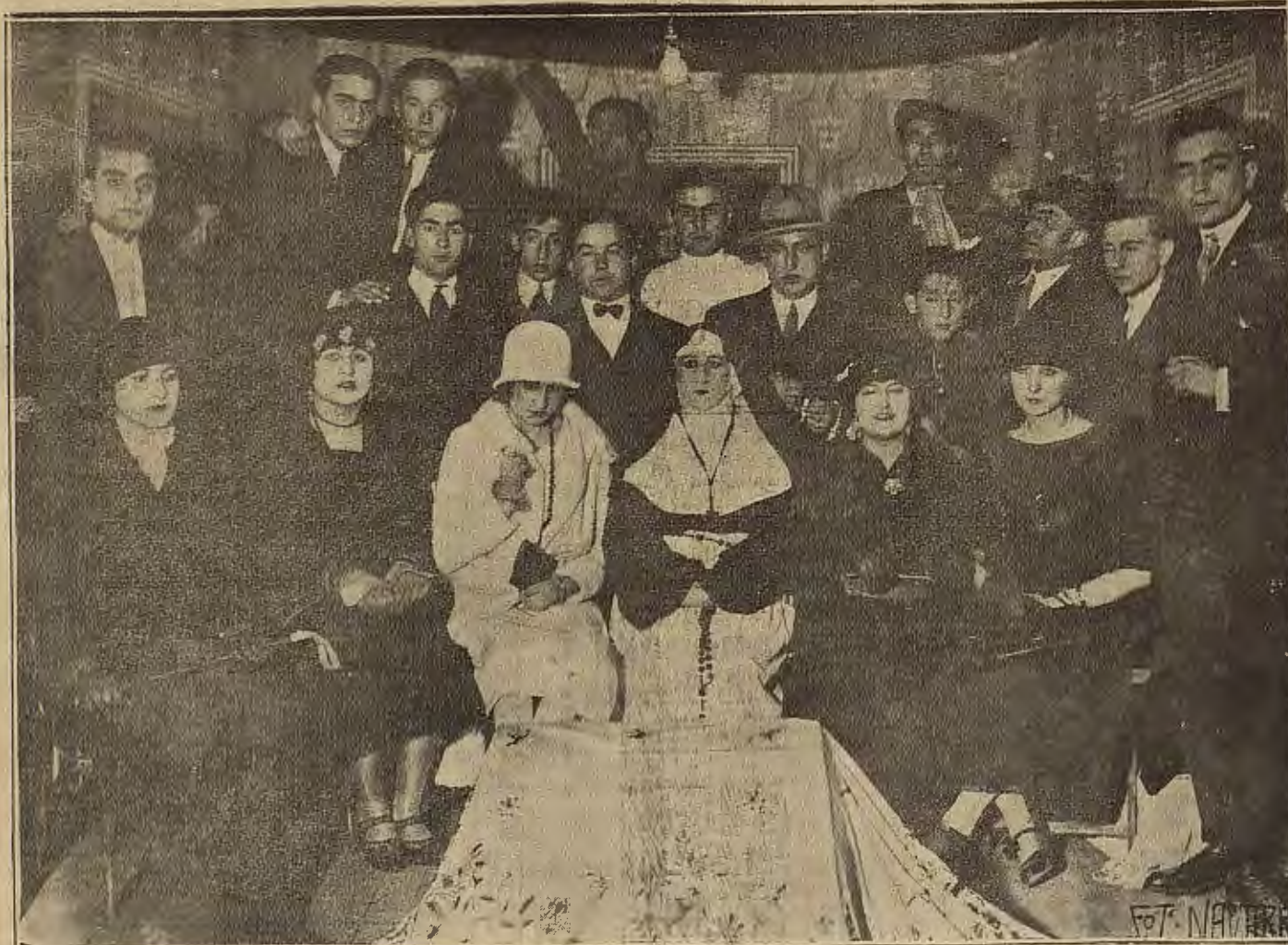
LA ALMUNIA DE DONA GODINA.—SEÑORITAS Y MUCHACHOS QUE TOMARON PARTE EN LA VELADA ARTÍSTICA QUE ORGANIZO EL CASINO PRINCIPAL (Foto Navarro).