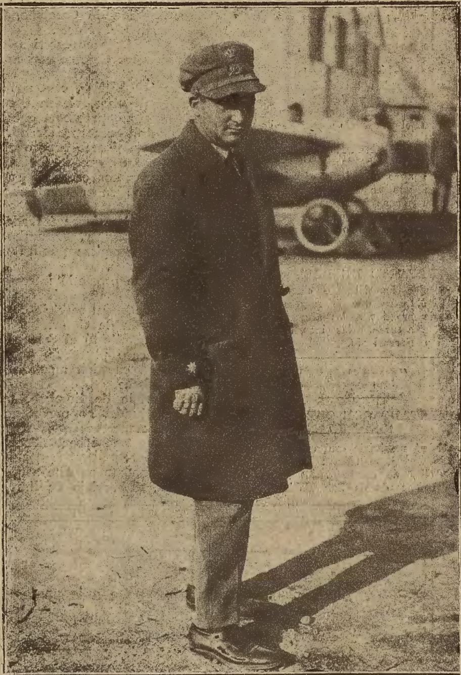
FIGURA DE ACTUALIDAD.—EL COMANDANTE FRANCO, QUE EN BREVE INTENTARÁ EL «RAID» DE AVIACION CADIZ-BUENOS AIRES.

los países que han recurrido a borrar la constitución para resolver los proble- mas que inquietaban su vida in- terior, les atrae de una manera ir- resistible.