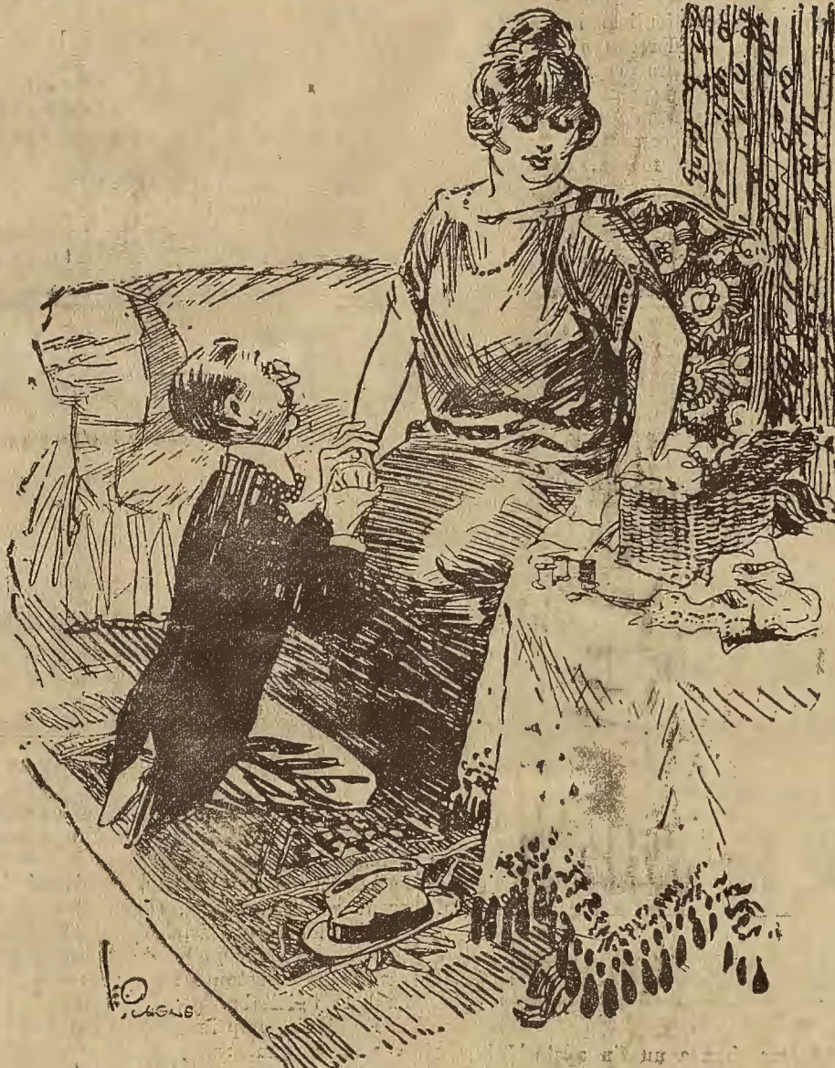
UNA MUJER PRACTICA

Este número ha sido sometido a la previa censura