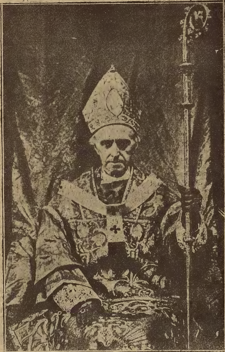
EL CARDENAL MERCIER, ARZOBISPO DE MALINAS, QUE FALLECIO AYER.

Su agresor fué detenido por la benemérita, que le puso a disposición del juez correspondiente.