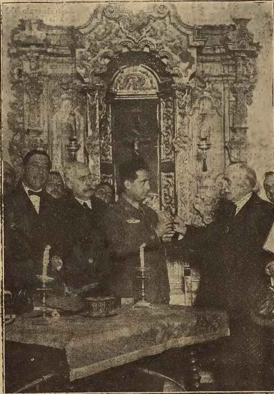
DEL RAID AEREO ESPAÑA-BUENOS AIRES. EN EL MONASTERIO DE LA RABIDA.—EL PRESIDENTE DE LA SOCIEDAD COLOMBINA ENTREGA AL COMANDANTE FRANCO UNA COPA DE ORO DESTINADA AL PRESIDENTE DE LA REPUBLICA ARGENTINA, Sr. ALVEAR