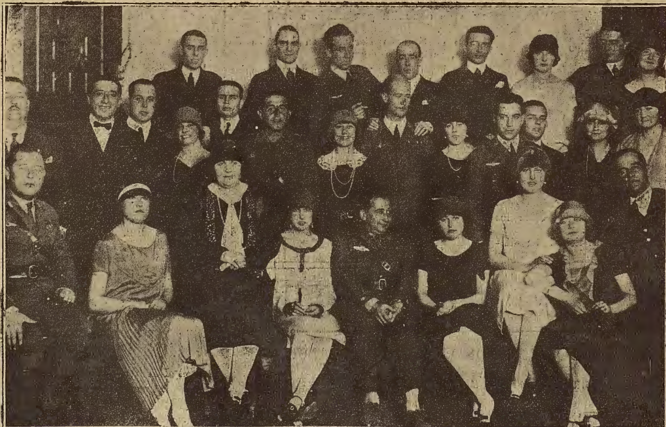
DEL RAID AEREO ESPAÑA-BUENOS AIRES. EN EL MONASTERIO DE LA RABIDA.—EL COMANDANTE FRANCO Y DEMAS AVIADORES CON LAS SEÑORITAS Y PERSONALIDADES ONUBENSES QUE ASISTIERON AL TE CON QUE FUBRON AGASAJADOS EN EL CASINO DE HUELVA.

Este número ha sido sometido a la previa censura