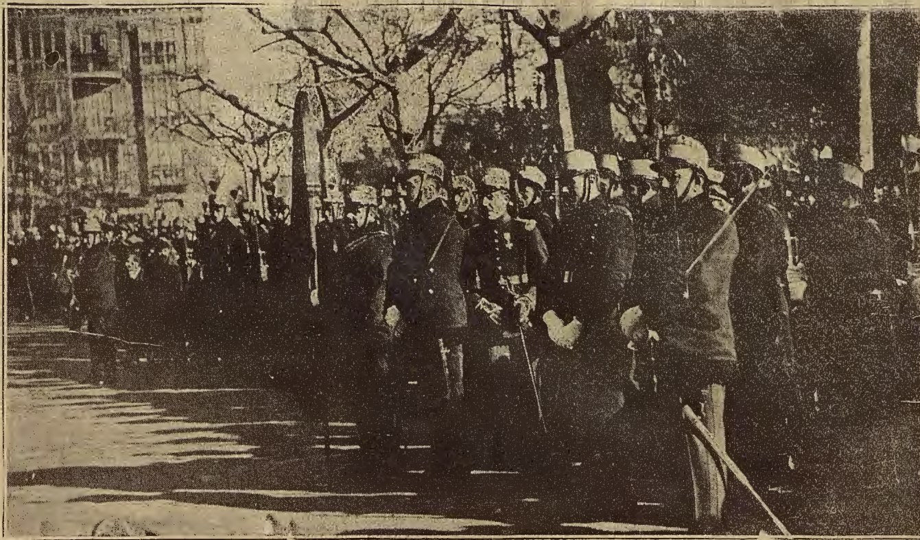
DE LA RECEPCIÓN DE AYER EN CAPITANÍA GENERAL. — EL PIQUETE ENCARGADO DE RENDIR HONORES

La discusión fué motivada sobre mejor derecho a unos pastos. San Higinio fué agredido por sus contendientes, resultando con una pequeña lesión en la espalda, producida con