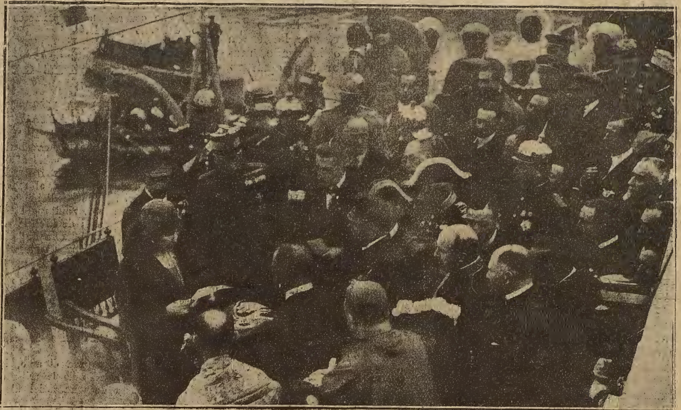
MALAGA.— La reina doña Victoria leyendo un discurso en el acto de entrega de la bandera regalada por la ciudad al cañonero «Cánovas del Castillo»

«Nube perfumada» se posa en una banqueta de patas retorcidas y con calados. Su