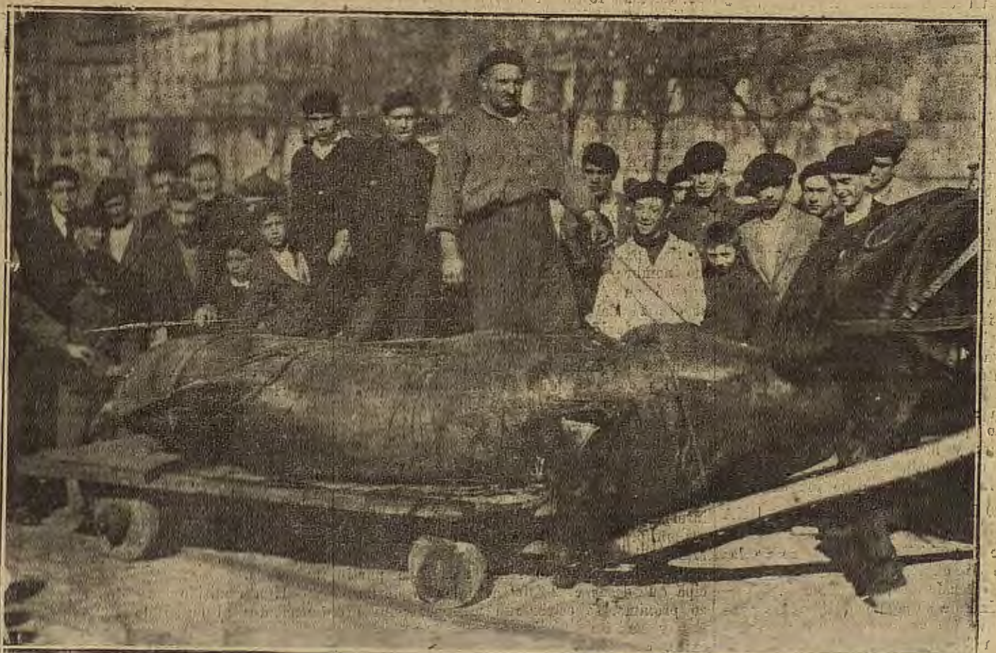
SAN SEBASTIAN.—El colayo de siete metros de largo y 1.200 kilos de peso, pescado en esta costa recientemente y remitido a Zaragoza

Bocadillos, Helados, Licores, Chocolatas, Repostería, Mariscos