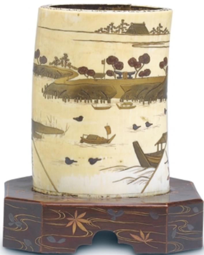
182. Portapinceles con decoración de laca Siwayama LACAS. Alt. 15 cm. Marfil y laca. Japón, s. XIX (Edo)