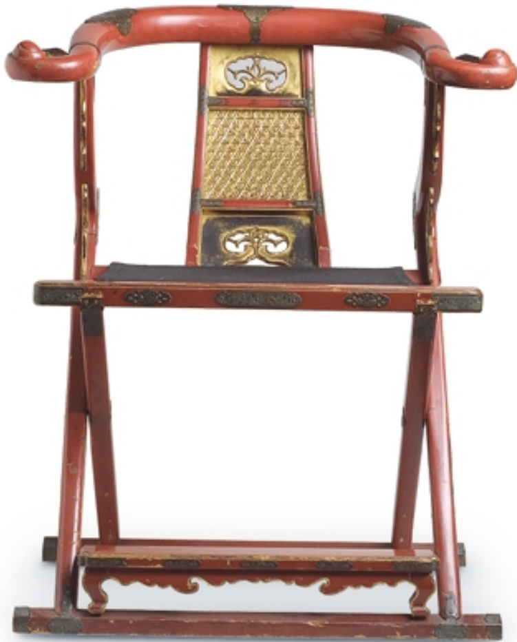
124. Sillón de dignatario en madera lacada roja y decorado en oro LACAS. 97 cm. x 76 cm. x 62 cm. Madera lacada y oro. China, s. XIX. (Quing)