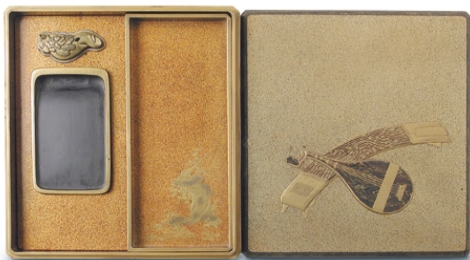
389. Suzuribako «Instrumentos musicales» LACAS. 22 cm. x 20 cm. Madera lacada. Japón, s. XVII (Edo)