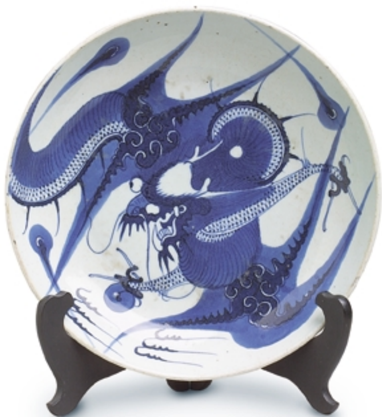
104. Plato con decoración de dragón PORCELANAS. Dia. 26 cm. Porcelana. Japón, s. XIX (Meiji)