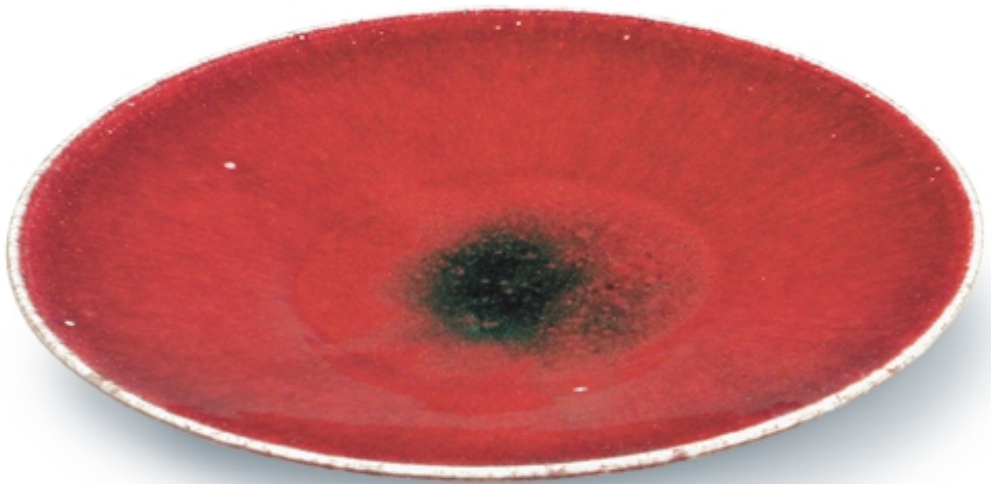
95. Plato con decoración de sangre de buey PORCELANAS. Dia. 26 cm. Porcelana. China, s. XVIII (Quing)