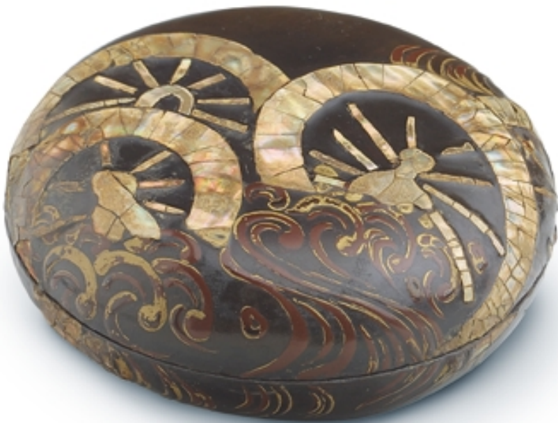
215. Caja para incienso con incrustaciones LACAS. Dia. 10 cm. Madera lacada, nácar. Japón, s. XVI. (Muromachi)