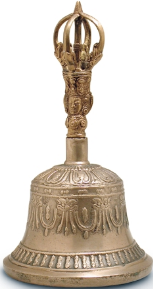
157. Campana ritual (Ghanta) BRONCES. 23 cm. Bronce. Tibet, s. XIX