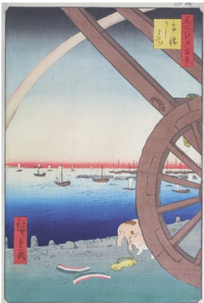
580. Demonios bajo un puente. Ushimachi, Takanawa UKIYO-E. Hiroshigue (1797-1858). Obán. Papel. Japón, s. XIX (Edo)