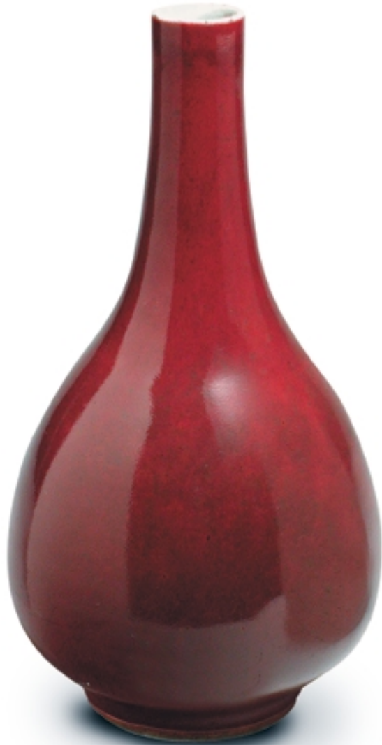
94. Jarrón pera con decoración de sangre de buey PORCELANAS. Alt. 23 cm. Porcelana. China, s. XIX (Qing)