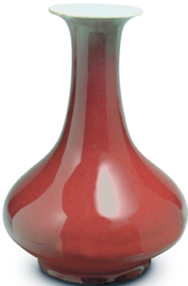
96. Jarrón de cuello con decoración de sangre de buey PORCELANAS. Alt. 19 cm. Porcelana. China, s. XIX (Qing)