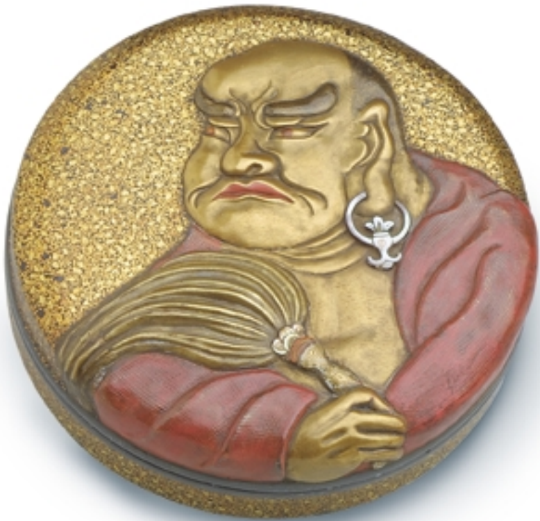
496. Caja redonda para incienso en metal lacado con relieve «Daruma» LACAS. Dia. 8 cm. Metal lacado. Japón, s. XVII. (Edo)