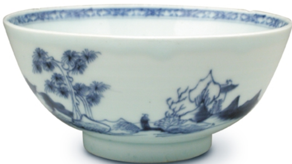
196. Cuenco con decoración azul de paisajes PORCELANAS. Dia. 16 cm. Porcelana. China, s. XVIII (Quing)