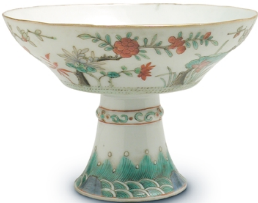
500. Copa con pie, decorada con flores de color PORCELANAS. 13 cm. x 10 cm. Porcelana. China, s. XVIII (fin.) (Quing)