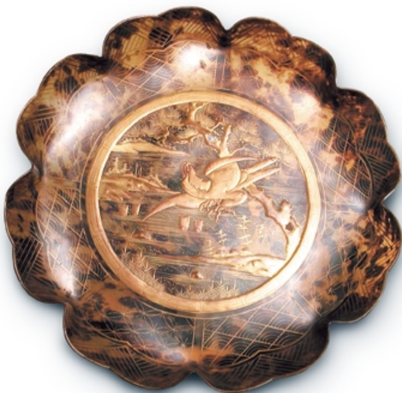
180. Bandeja decorada en oro LACAS. Dia. 34 cm. Concha y laca. Japón, s. XIX (Edo)