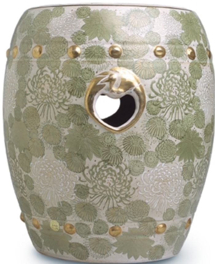
33. Asiento de jardín de Satsuma PORCELANAS. Alt. 40 cm. Porcelana. Japón, s. XIX. (Meiji)