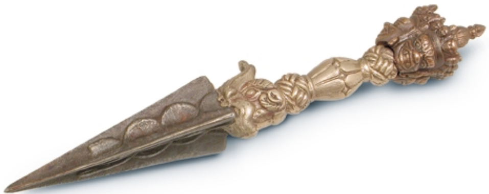
155. Puñal ritual (Phur-Bu) BRONCES. 28 cm. Hierro. Tibet (s. XVII-XVIII)