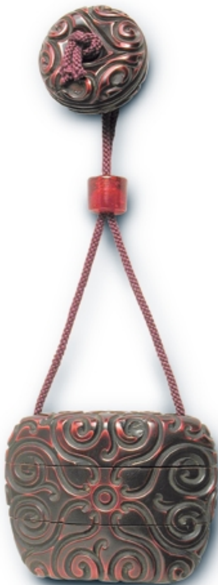
704. Tonkotsu «Guri». Netsuke y Ojime a juego INROS. 5 cm. x 7 cm. Madera lacada y tallada. Japón, s. XVII (Momoyama)