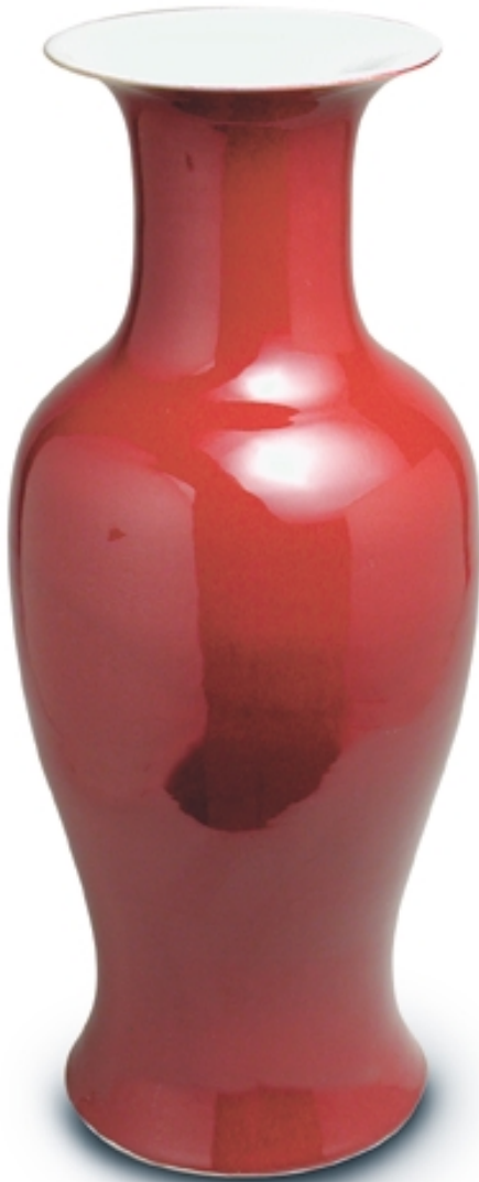
79. Jarrón con decoración de sangre de buey PORCELANAS. Alt. 62 cm. Porcelana. China, s. XX (República)