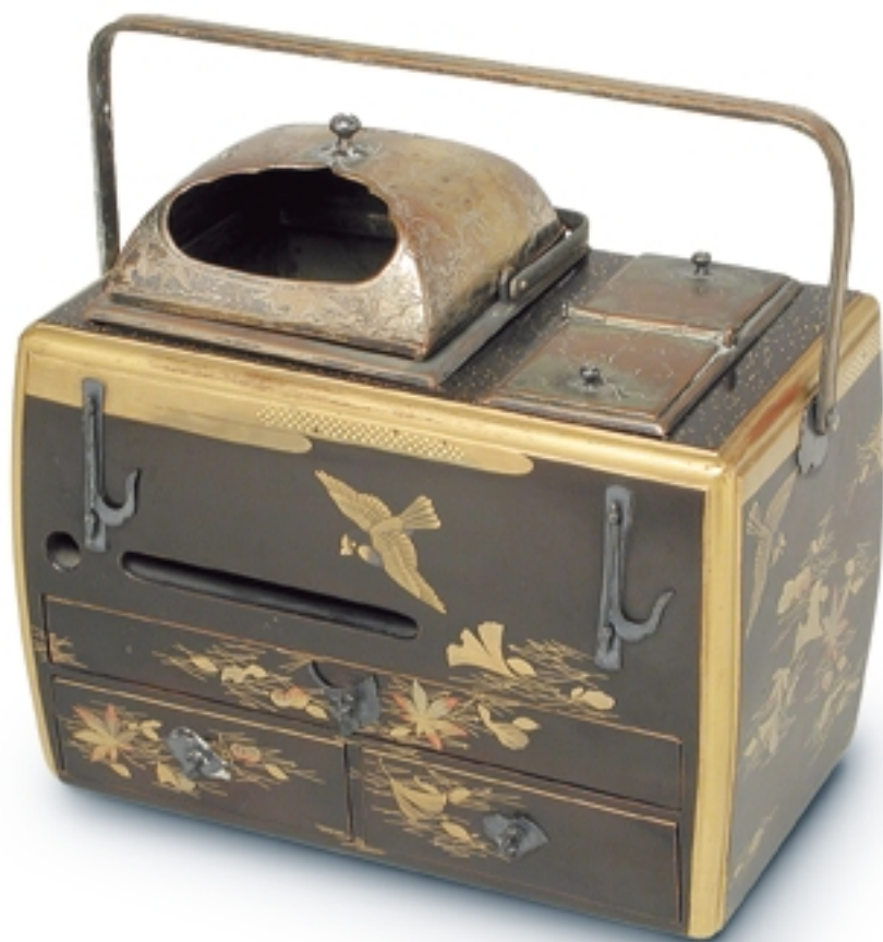
224. Servicio para fumar. Tabakobon. Contiene un Suzuribako y su pipa LACAS. 20 cm. x 20 cm. x 12 cm. Madera lacada negra, metal. Japón, s. XIX (Edo)