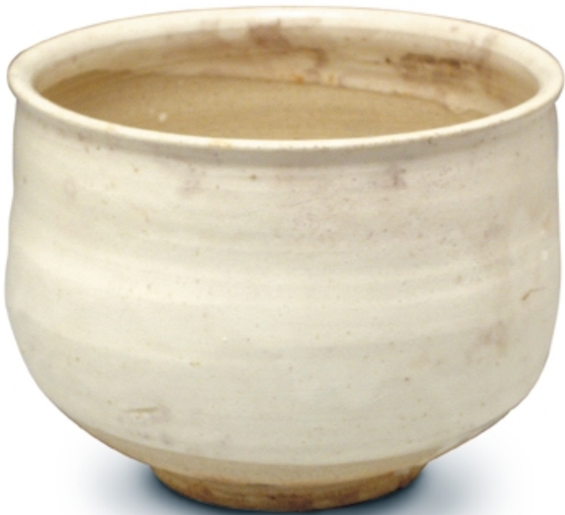
651. Cuenco de té. Chawan VARIOS. Dia. 12,5 cm. Gres. China, s. X (Song)