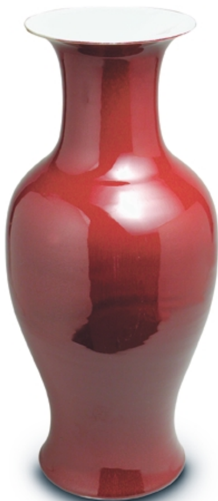
80. Jarrón con decoración de sangre de buey PORCELANAS. Alt. 62 cm. Porcelana. China, s. XX (República)