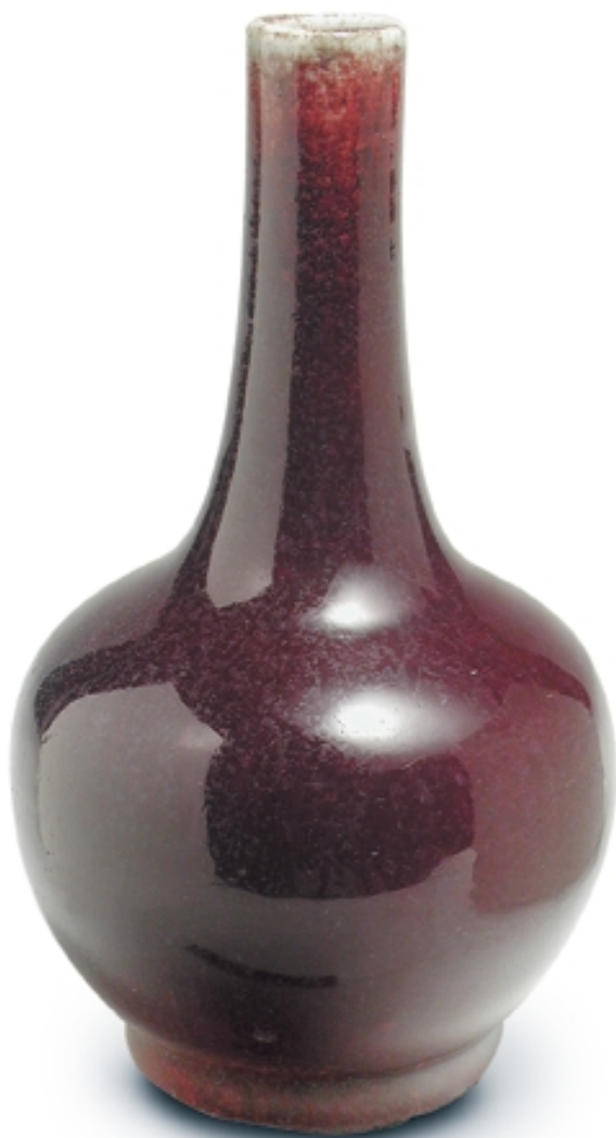
197. Jarrón globular con decoración de sangre de buey PORCELANAS. Alt. 20 cm. Porcelana. China, s. XVII (Quing)