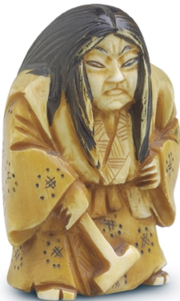
529. Figura de un actor (Netsuke) TALLAS. Alt. 5 cm. Marfil. Japón, s. XIX (Edo)