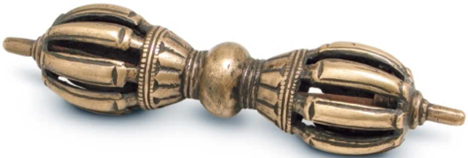
432. Arma ritual (Vajra) BRONCES. 16 cm. Bronze. Tibet, s. XVII