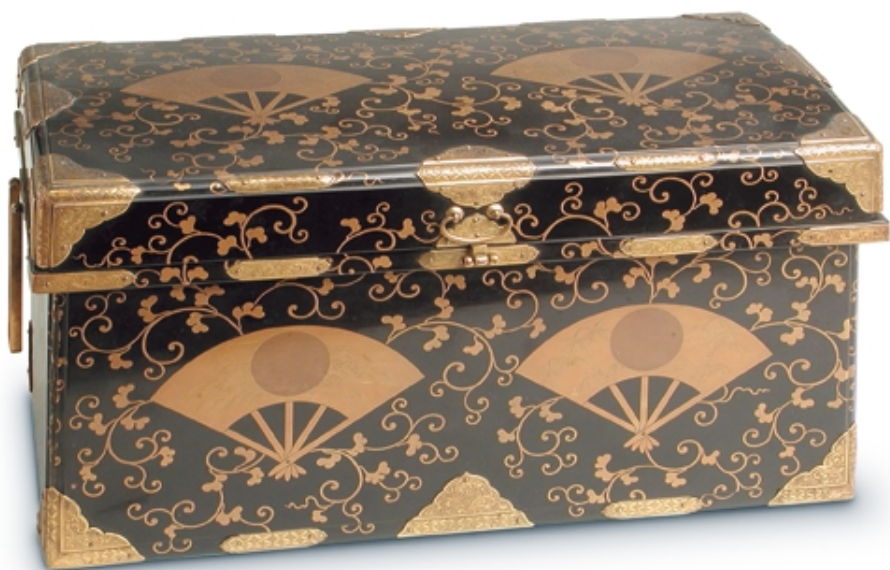
436. Arca de viaje pequeña negra y oro LACAS. 33 cm. x 17 cm. x 17 cm. Madera lacada. Japón, s. XIX (Edo)