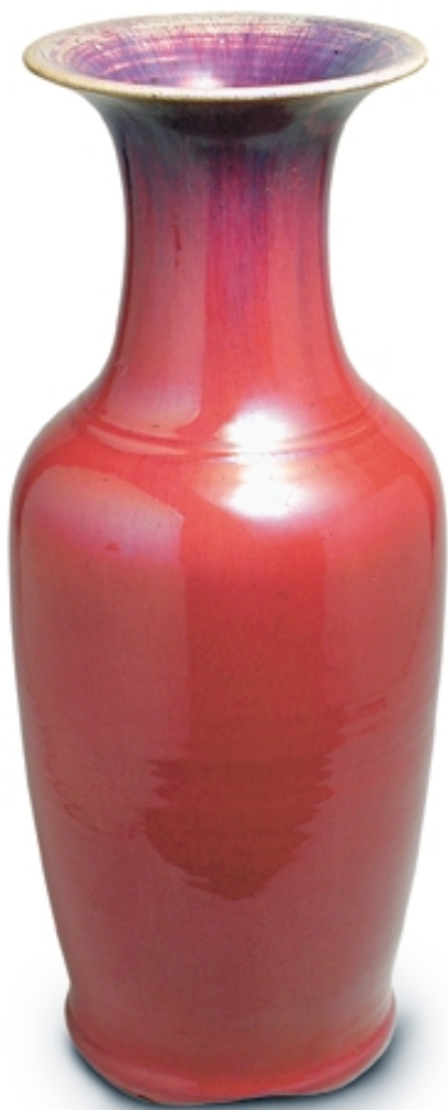
84. Jarrón con decoración de sangre de buey PORCELANAS. Alt. 58 cm. Porcelana. China, s. XVIII (Quing)