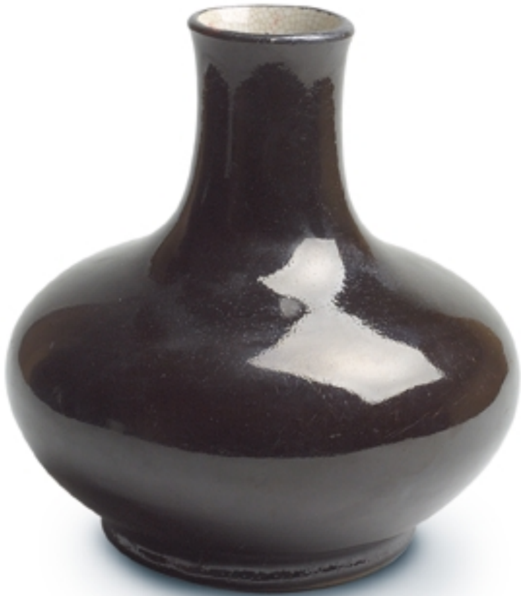
277. Jarrón globular negro especular PORCELANAS. Alt. 30 cm. Porcelana negra. China, s. XIX (Quing)