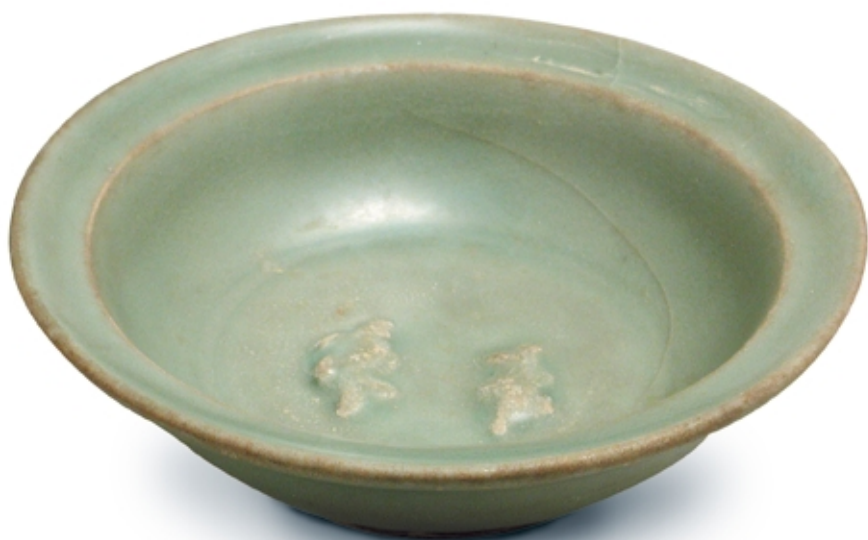
402. Copa celadón con peces PORCELANAS. Día. 13 cm. Porcelana. China, s. XIII (Yuan)