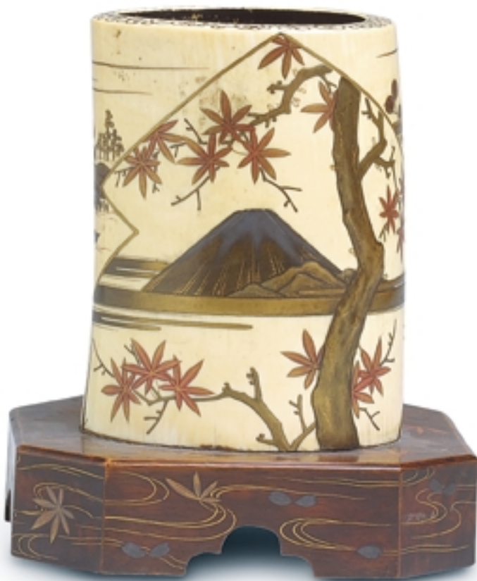
181. Portapinceles con decoración de laca Siwayama LACAS. Alt. 15 cm. Marfil y laca. Japón, s. XIX (Edo)