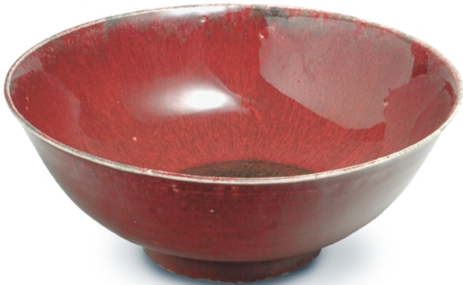
93. Cuenco con decoración de sangre de buey PORCELANAS. Dia. 23 cm. Porcelana. China, s. XVIII (Qing)