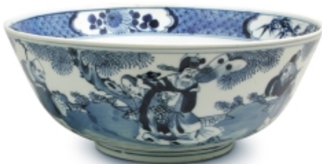
328. Cuenco con decoración de figuras y pájaros PORCELANAS. Dia. 23 cm. Porcelana. China, s. XVIII-XIX (Quing)