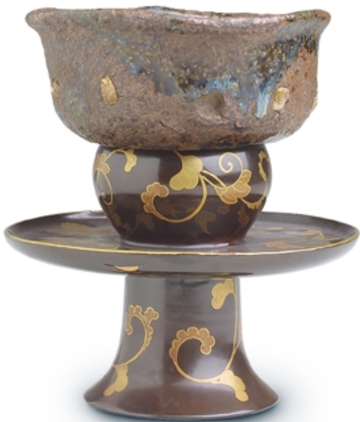
219 y 209. Soporte para taza negro y oro y chawan LACAS Y PORCELANAS. 12 cm. x 15 cm. y Dra. 13 cm. Madera lacada y cerámica de Shigaraks. Japón, s. XIX y XVII (Edo)