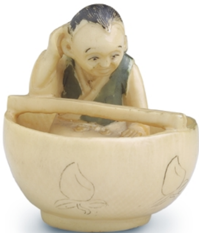
518. Figura de un hombre en una cáscara de nuez (Netsuke) TALLAS. Alt. 4 cm. Marfil. Japón, s. XX (Meiji)