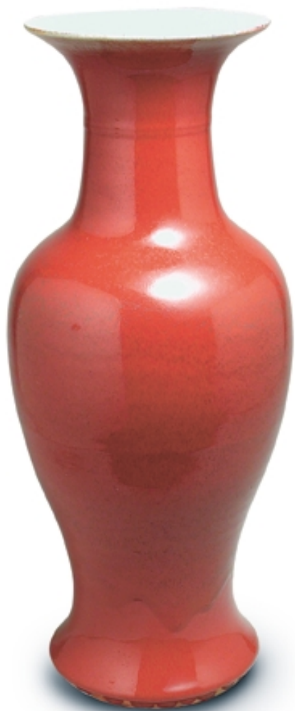
83. Jarrón con decoración de sangre de buey. PORCELANAS. Alt. 56 cm. Porcelana. China, s. XVIII (Quing)