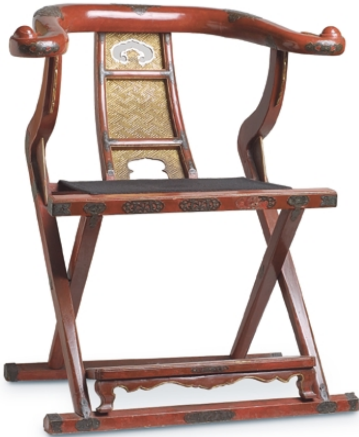
123. Sillón de dignatario en madera lacada roja y decorado en oro LACAS. 97 cm. x 76 cm. x 62 cm. Madera lacada y oro. China, s. XIX. (Quing)