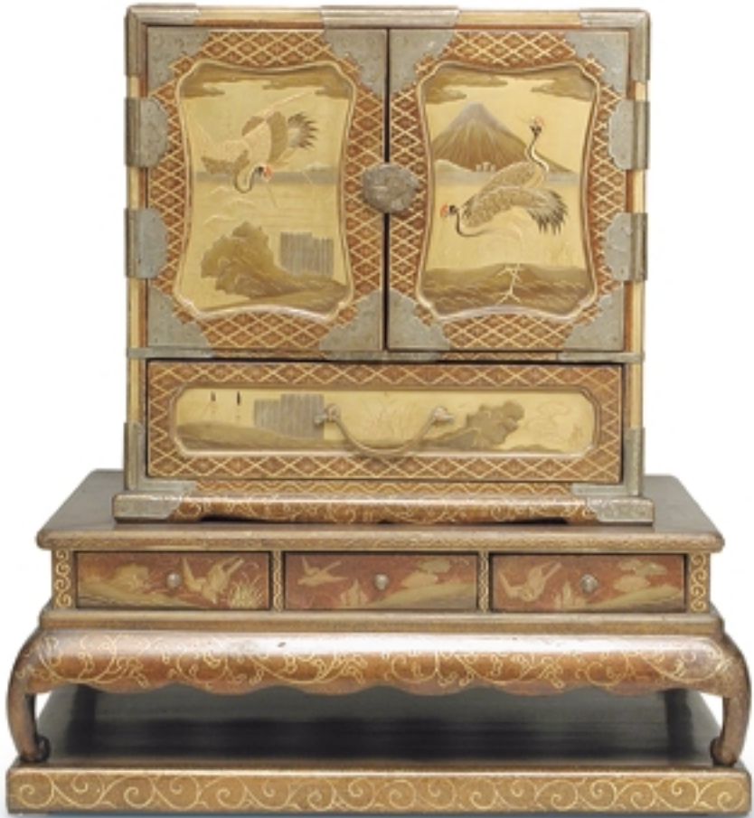
440. Cabinet marrón y oro con decoración de pájaros LACAS. 42 cm. x 40 cm. x 30 cm. Madera lacada. Japón, s. XVIII-XIX (Edo)