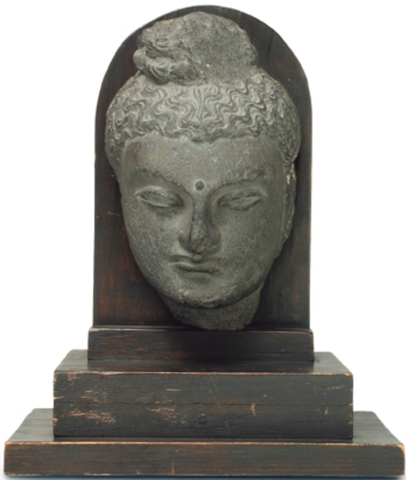
305. Cabeza de Buda de Gandhara TALLAS. Alt. 22 cm. Pizarra. Pakistán (Gandhara), s. III