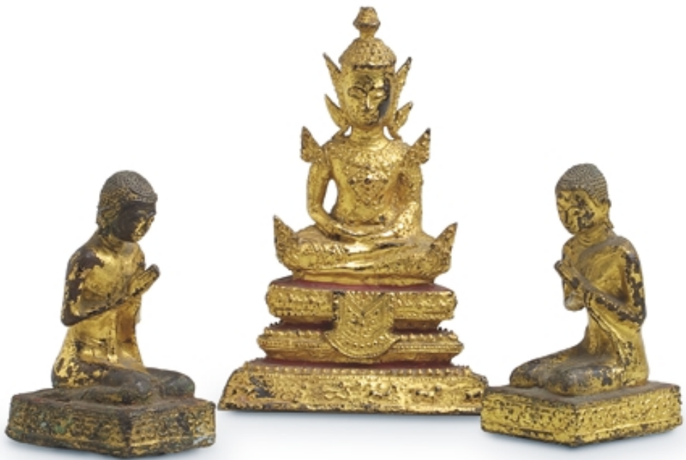
415. Buda entronizado con dos orantes BRONCES. Alt. 17 cm. Bronce dorado. Tailandia, s. XIX