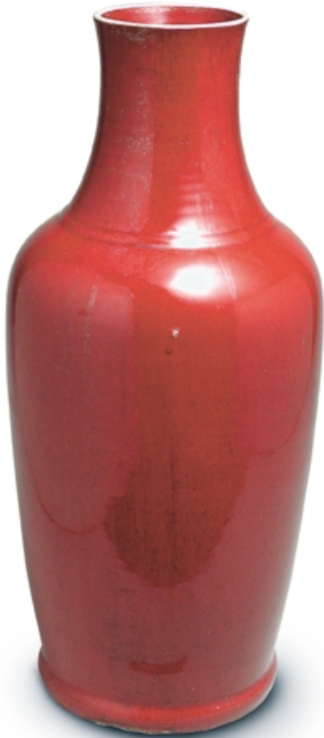
82. Jarrón con decoración de sangre de buey PORCELANAS. Alt. 55 cm. Porcelana. China, s. XVIII (Quing)