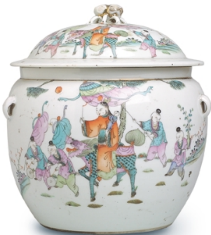
102. Recipiente con tapa y asas decorado con figuras de la familia rosa-verde PORCELANAS. Alt. 23 cm. Porcelana. China, s. XIX (Quing)