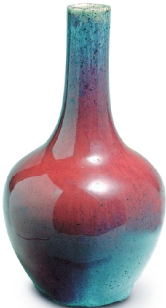
98. Jarrón pera con decoración de sangre de buey PORCELANAS. Alt. 20 cm. Porcelana. China, s. XVIII (Quing)