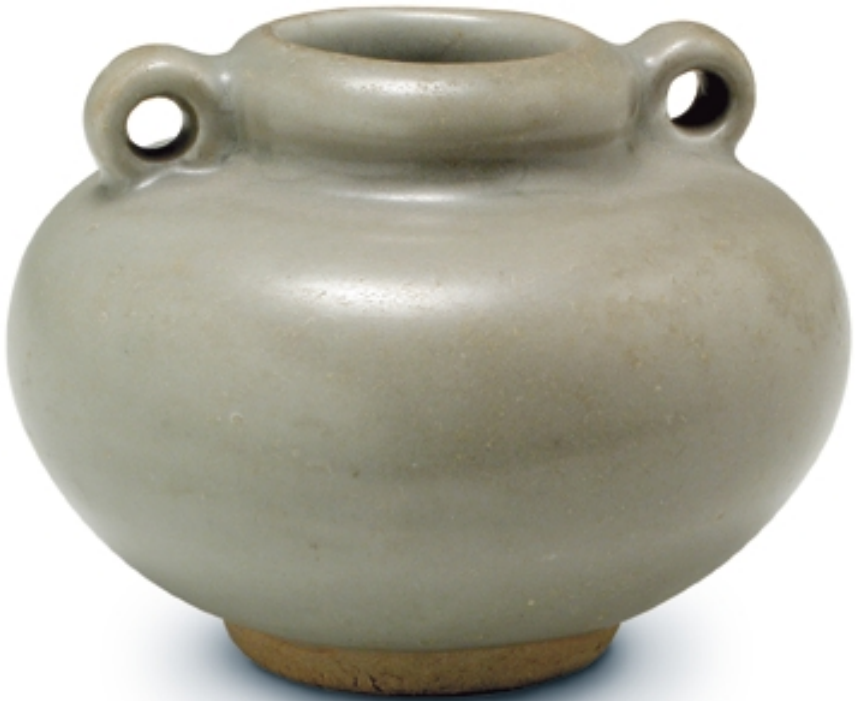
403. Tarro celadón para ungüentos VARIOS. Alt. 5 cm. Gres. China, s. X (Song)