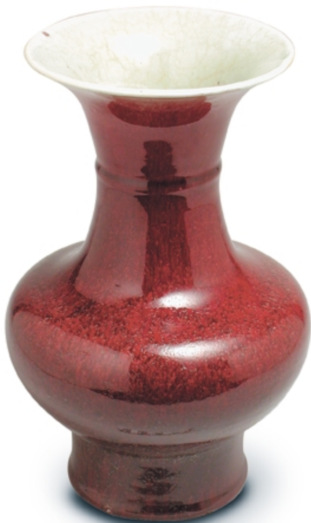
89. Jarrón globular con decoración de sangre de buey PORCELANAS. Alt. 32 cm. Porcelana. China, s. XVIII (Qing)