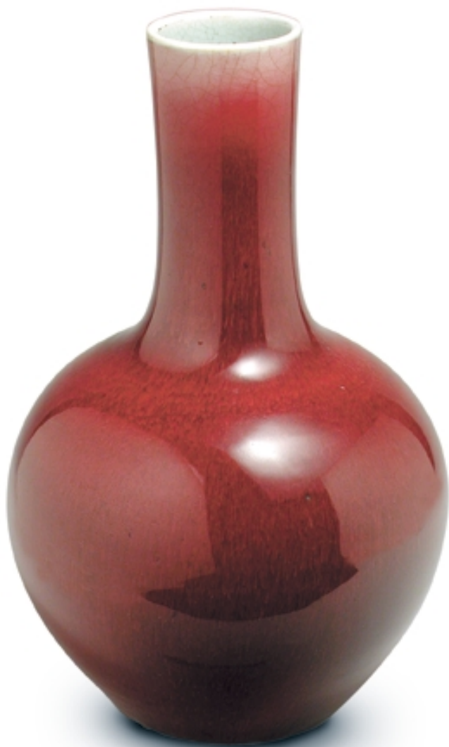
309. Jarrón globular decorado con sangre de buey PORCELANAS. Alt. 50 cm. Porcelana. China, s. XVIII (Quing)