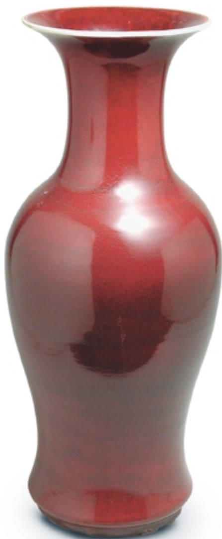
85. Jarrón con decoración de sangre de buey PORCELANAS. Alt. 54 cm. Porcelana. China, s. XVIII (Quing)