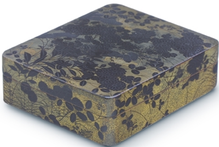
488. Caja rectangular negra y oro «Grillos» LACAS. 9 cm. x 8 cm. x 3 cm. Madera lacada. Japón, s. XVIII (Edo)