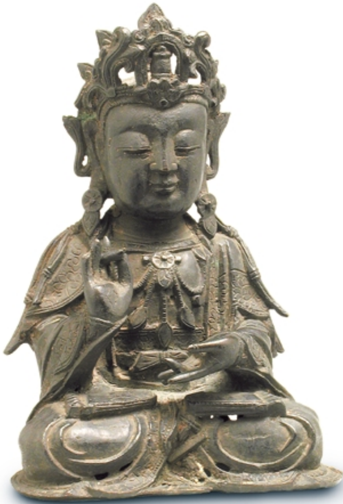
275. Bodisattva (Buda). Maitreya BRONCES. Alt. 23 cm. Bronze. China, Tibet. s. XV (Ming)