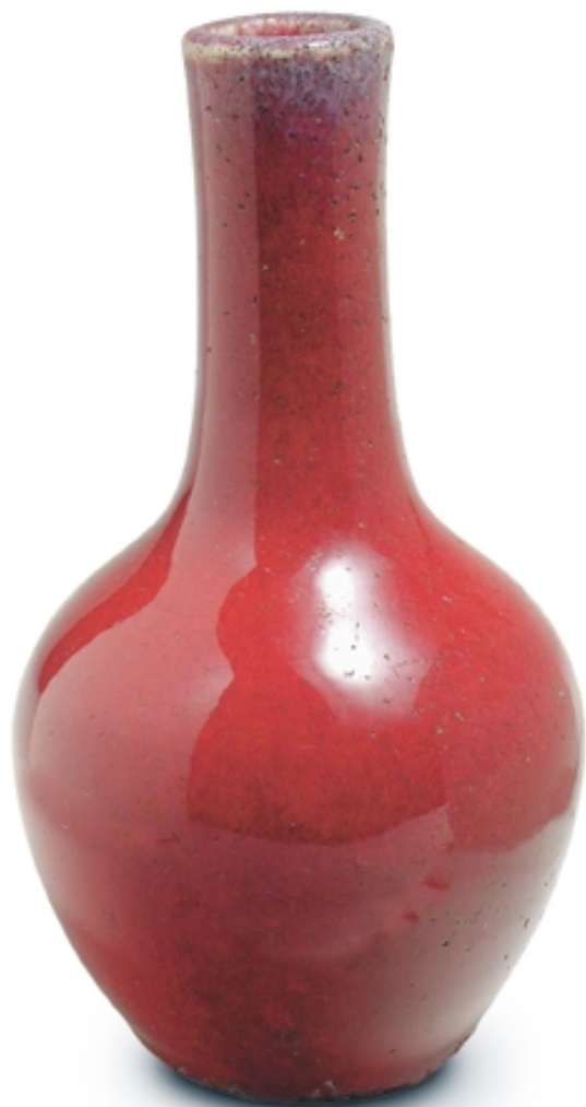
410. Jarrón pequeño decorado con sangre de buey PORCELANAS. Alt. 13 cm. Porcelana. China, s. XVII (Quing)