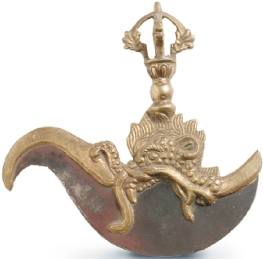
156. Hacha ritual (Katrikâ) BRONCES. 18 cm. Hierro. Tibet, (s.XIX)