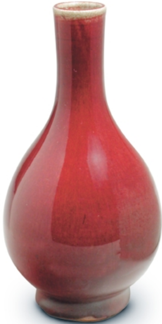
411. Jarrón decorado con sangre de buey PORCELANAS. Alt. 15,5 cm. Porcelana. China, s. XVII-XVIII (Qing)