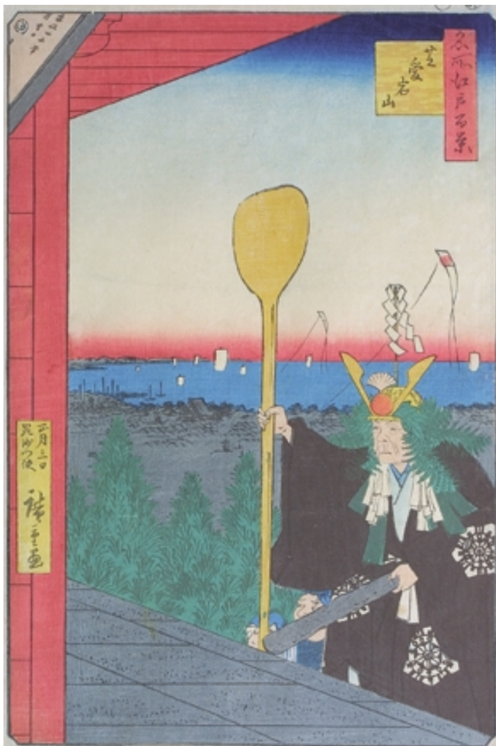
604. El monte Atago en Shiba. Posible autorretrato de Hiroshige UKIYO-E. Hiroshigue (1797-1858). Obán. Papel. Japón, s. XIX. (Edo)