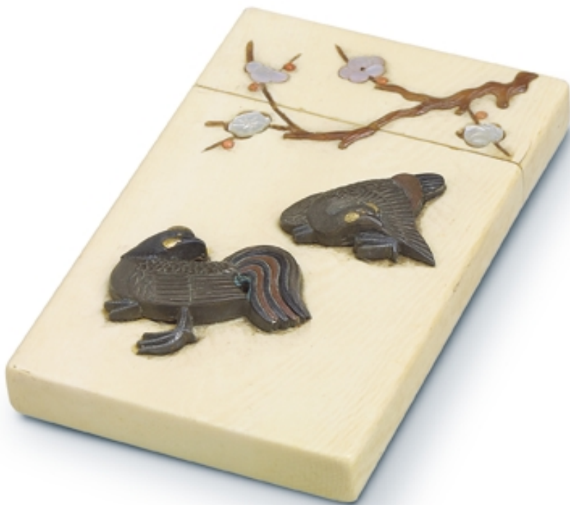
640. Tarjetero en marfil Siwayama. Con incrustaciones lacadas VARIOS. 10 cm. x 6 cm. Marfil, lacado con incrustaciones. Japón, s. XIX (Edo)