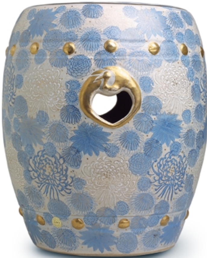
32. Asiento de jardín de Satsuma PORCELANAS. Alt. 40 cm. Porcelana. Japón, s. XIX. (Meiji)