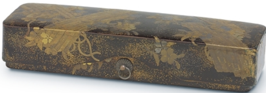
387. Caja rectangular negra «Troncos de oro» LACAS. 22 cm. x 8 cm. Madera lacada. Japón, s. XVIII (Edo)