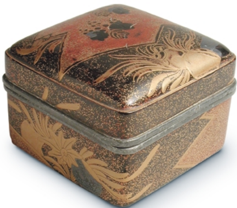
495. Caja cuadrada «Momoyama», montada con estaño LACAS. 7 cm. x 7 cm. x 5 cm. Madera lacada. Japón, s. XVI (Muromachi)