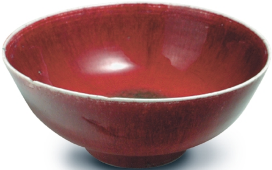
97. Cuenco con decoración de sangre de buey PORCELANAS. Dia. 16 cm. Porcelana. China, s. XVIII (Qing)