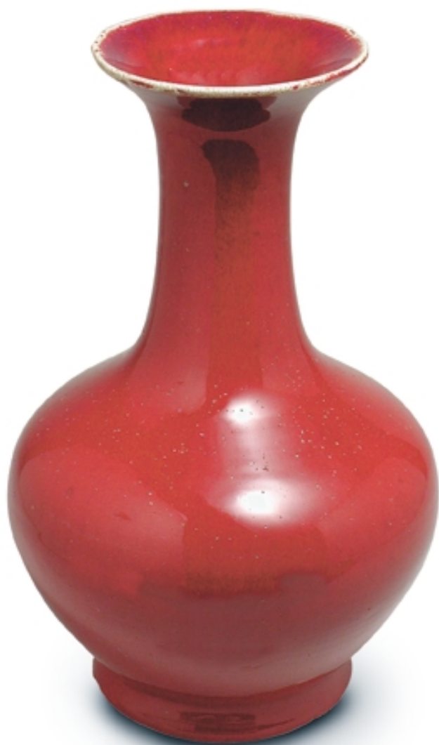
88. Jarrón globular con decoración de sangre de buey PORCELANAS. Alt. 35 cm. Porcelana. China, s. XVIII (Quing)