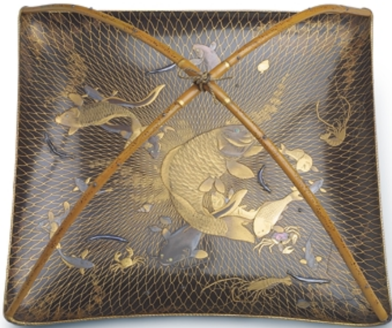
186. Bandeja en forma de red con decoración de peces LACAS. 23 cm. x 23 cm. x 16 cm. Madera lacada. Japón, s. XVIII. (Edo)