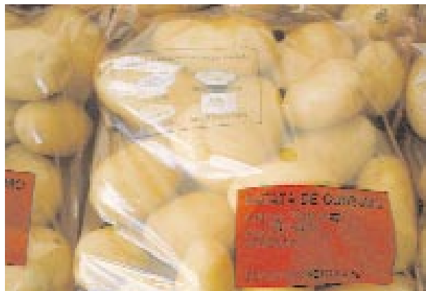
Información detallada de la variedad y usos culinarios recomendados.

Aunque como en los casos anteriores la Información Técnica nº 72/99 explica el porqué de las exigencias de calidad para la patata lavada y embolsada, como recordatorio, en el cuadro nº 5 quedan resumidas las escalas de valores para cada uno de los criterios de calidad, a fin de facilitar la interpretación de los cuatro últimos cuadros donde se recogen las características de los tubérculos de todas las variedades ensayadas en los campos de Zaragoza, El Temple y Terrer los años 1999 y 2000 con la valoración final de aptitud que han recibido.