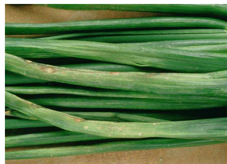
Mildiu – Peronospora destructor