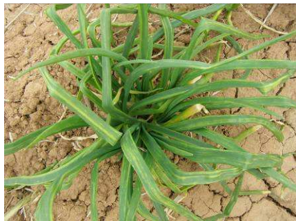
Onion Yellow dwarf virus