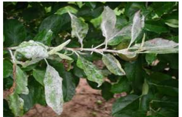
Brote de manzano afectado por oidio

Desde la prefloración, los manzanos son sensibles al oidio y es muy importante mantener las plantaciones protegidas con productos eficaces contra esta enfermedad. En caso de encontrar brotes afectados, tal y como aparecen en la imagen, les recomendamos la retirada manual de los mismos como una manera de evitar las infecciones secundarias que a partir de ellos se producen