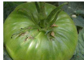
Daños de Tuta absoluta en hojas y frutos