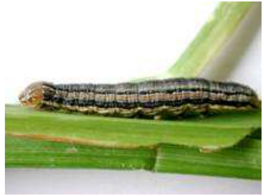
Larva de Mythimna unipuncta