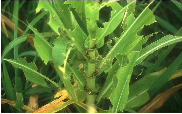
Daños de Mythimna unipuncta

insecticidas autorizados en el cultivo afectado, respetando los plazos de seguridad establecidos.