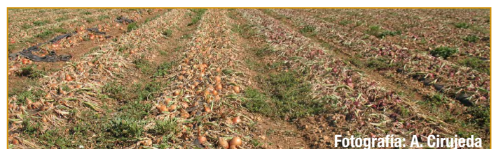
Malas hierbas en cebolla