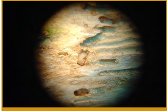
Barrenillo del olivo

Los barrenillos del olivo que pasan el invierno entre la corteza, salen de sus refugios al subir la temperatura y buscan leña de poda para realizar la puesta. En caso de no encontrar ese tipo de madera, la realizarán en ramas rotas o árboles debilitados, pudiendo dar lugar, en caso de graves ataques, a la muerte de dichos árboles.