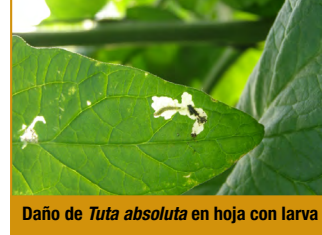
Daño de Tuta absoluta en hoja con larva

7.- Eliminación manual de hojas, frutos y brotes afectados por la polilla y destruirlos de forma segura.