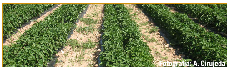
Malas hierbas en pimiento