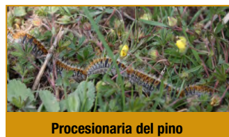
Procesionaria del pino

Durante el inicio de la primavera, las orugas han alcanzado ya su desarrollo en el interior de los bolsones, es en este momento cuando comenzarán a abandonarlos dirigiéndose hacia el suelo, dando lugar a las características procesiones.