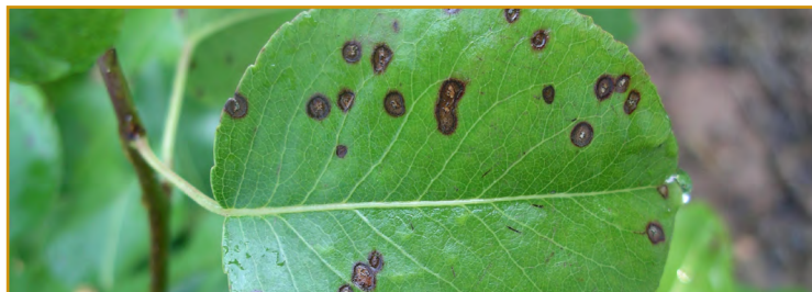
Septoria en peral

Durante la campaña de 2016, aumentaron los daños causados por septoria en algunas zonas de Aragón, pero a la vez se redujeron en otras, probablemente por los cambios que se llevaron a cabo en cuanto a la estrategia de control. Algunas sustancias utilizadas en el control del moteado, están mostrando desde hace años un escaso control de la enfermedad, por ello las parcelas con antecedentes de esta enfermedad deben protegerse contra septoriosis desde el mes de abril, especialmente en zonas húmedas o si se dan periodos de lluvias frecuentes. Para ello les recomendamos el uso durante la primavera de captan 47,5%SC y 80%WG (varios), clortalonil 50%SC (varios), metil tiofanato 70%WG, 70%WP y 50%SC (Varios) o metiram 80%WG (POLYRAM DF-Basf), hay que tener en cuenta que esta última sustancia no debe aplicarse a algunas variedades de peral como Blanquilla, Ercolini y Castell, puesto que puede producir fitotoxicidad. No todas las formulaciones 50%SC de clortalonil y de metil tiofanato están autorizadas en este cultivo.