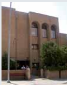
Centro de Barbastro

La Asamblea general ordinaria del IASS, en Barbastro, puso sobre la mesa distintos temas que preocupan a los socios del centro, entre otras cosas, la construcción del pabellón multiusos. Asimismo, se informó de las actividades realizadas en el 2007 y las previstas para el 2008, con proyectos de ciberaula para formación de voluntarios, iniciación a la informática, dinamización de telecentros, ludoteca, colaboraciones en el boletín "Andamos", servicio de gestiones, etc.