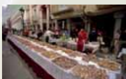
Crespillada en Barbastro

Los crespillos son un postre típico del Somontano de Barbastro, que se prepara a partir de una hoja de borraja rebozada en una masa compuesta fundamentalmente por huevo, harina y azúcar. Esta tradición ha sido potenciada en los últimos años, convirtiéndose en fiesta gastronómica.