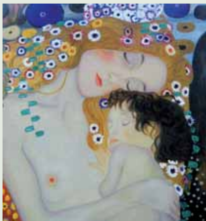
Las tres edades de la mujer detalle por Gustav Klimt

En esta etapa de mi vida, cuando se tiene la madurez de la edad dorada, miro hacia mi infancia, que fue tan feliz, y mis recuerdos hacen que cada día admire más a los padres que tuve. Esta carta, aunque sea dedicada a mi madre, es un homenaje a los dos.