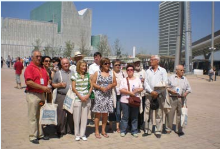
El Palacio de Congresos y la Torre del Agua sirve como telón de fondo a los directores de los centros IASS de Huesca y Teruel.