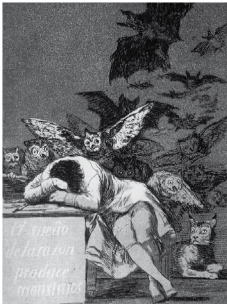
El sueño de la razón produce monstruos.