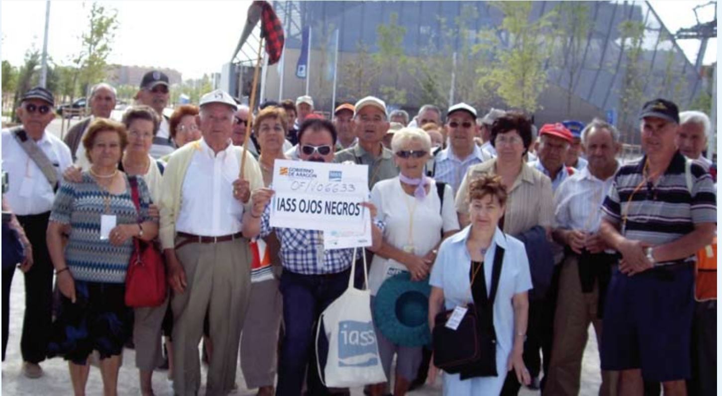
Los socios del centro IASS de Ojos Negros llevaron como reclamo para ir agrupados un cachirulo.