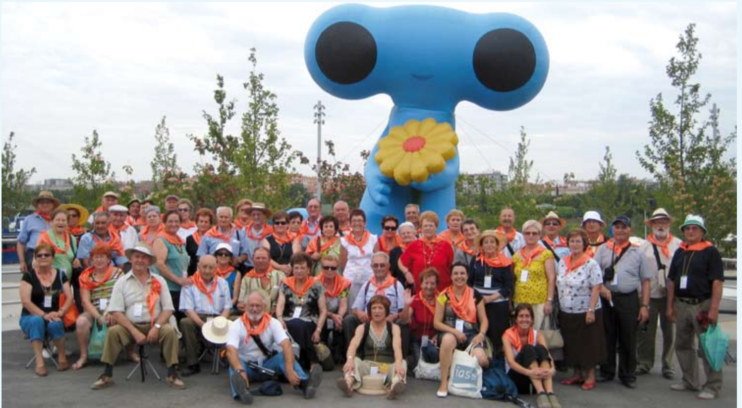
Fluvi, la mascota de la Muestra Internacional acogió al centro IASS de Fraga.