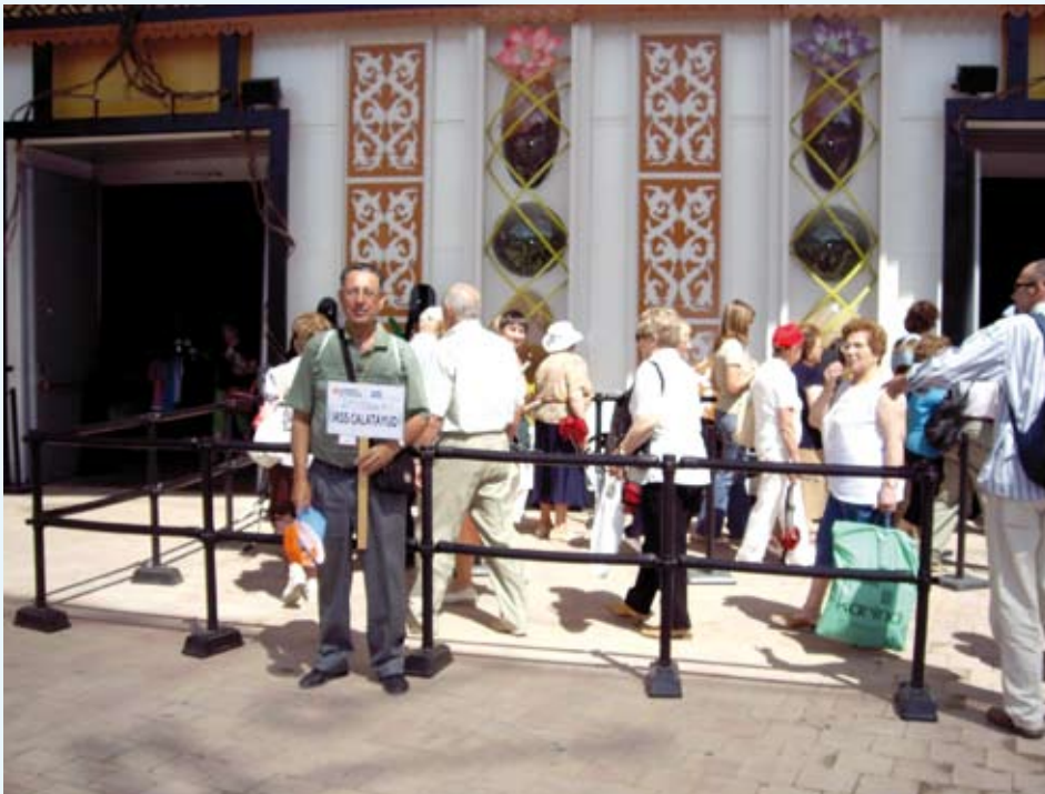
No tuvieron que hacer mucha cola para entrar en el pabellón de Marruecos, los visitantes del centro IASS de Calatayud.

Los mayores de Aragón fueron protagonistas por partida doble en la Expo de Zaragoza. Por un lado, 1700 de ellos "invadieron" con su curiosidad y alegría el recinto de Ranillas. Por otro, fueron sus propios compañeros de varios centros del IASS los encargados de hacer de guías.