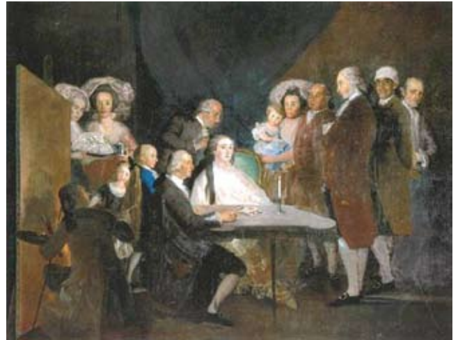
La familia del Infante don Luís de Borbón.

de su época. Se pueden contemplar más de 350 obras, de las que 89 son de Goya. Entre las obras destacadas y traídas ex profeso para la exposición se hallan “La familia del Infante don Luís de Borbón”, “El sueño de la razón produce monstruos” o “Los caprichos”.