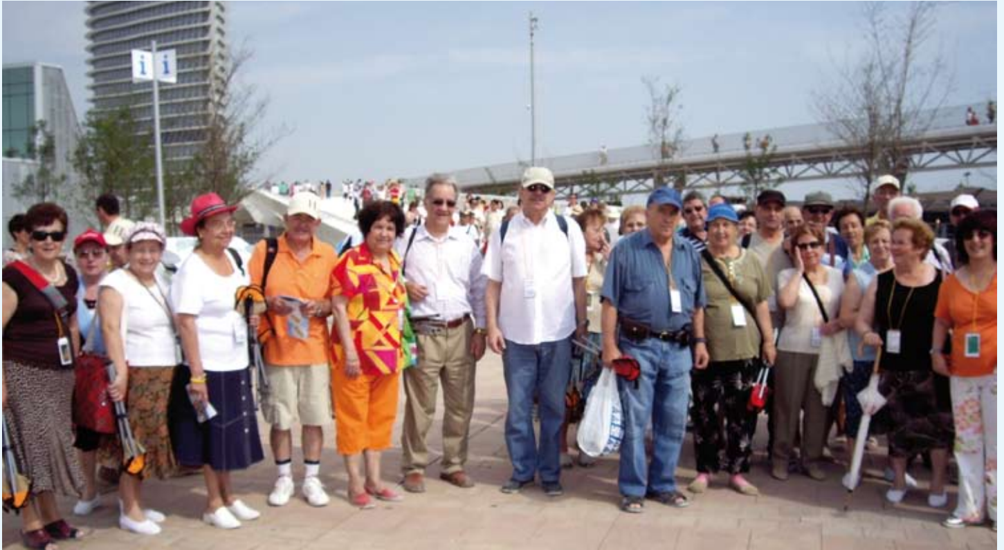
Los socios del centro IASS de Delicias de Zaragoza.