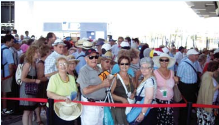
Las colas se vivieron con una sonrisa.

Los 32 grupos de 55 personas cada uno, dispusieron de tarjetas identificativas, con su nombre, centro de pertenencia y teléfono de incidencias. Tuvieron personal de apoyo durante las jornadas y cada centro utilizó su imaginación para hacerse más visibles por el recinto; etc. pero quizás el elemento más distintivo a la vez que más agrupante, fueron los taburetes que el IASS proporcionó para hacer más llevaderas las filas para entrar en los Pabellones.