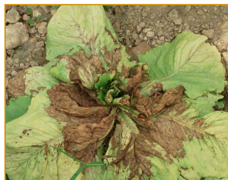
VIRUS DEL BRONCEADO

- Retirar las plantas afectadas del campo en sacos cerrados para evitar que sean focos de dispersión de la enfermedad.