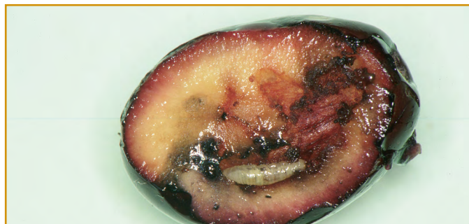
Daños de Bactrocera oleae

La segunda generación suele tener más incidencia por que se da en época con temperaturas más suaves que favorecen la actividad de la mosca, se informara semanalmente de los tratamientos a realizar. En el caso de que aumente y se generalice el porcentaje de picada, se procederá a dar aviso para un tratamiento total.