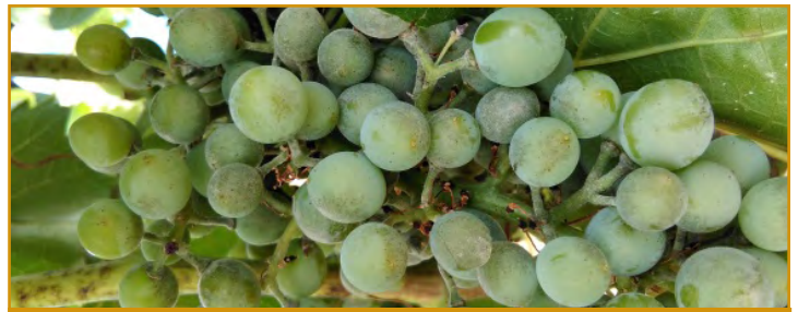
Daños de oidio

Seguimos en periodo de máxima sensibilidad en la mayoría de las zonas vitícolas, como es el estado de maduración de la uva, que, unido a lluvias y tiempo húmedo son las condiciones favorables para que se desarrolle esta enfermedad. Si se dan estas condiciones, se recomienda mantener protegido el cultivo con alguno de los productos recomendados en el Boletín nº 4 realizando un buen recubrimiento de los racimos para asegurar la eficacia del tratamiento, debido a que,