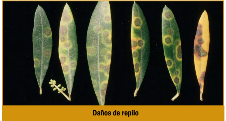
Daños de repilo

Utilizar los productos recomendados en el Boletín N° 1, teniendo en cuenta las limitaciones de uso que se establecen en la etiqueta del producto.