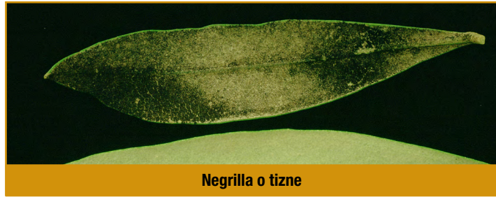
Negrilla o tizne

Es un hongo que vive asociado a la cochinilla, recubre la hoja del olivo a modo de hollín, dificultando la respiración y la función clorofílica, en caso de parcelas con daño de este hongo se utilizará Azufre (VARIOS-Varias).