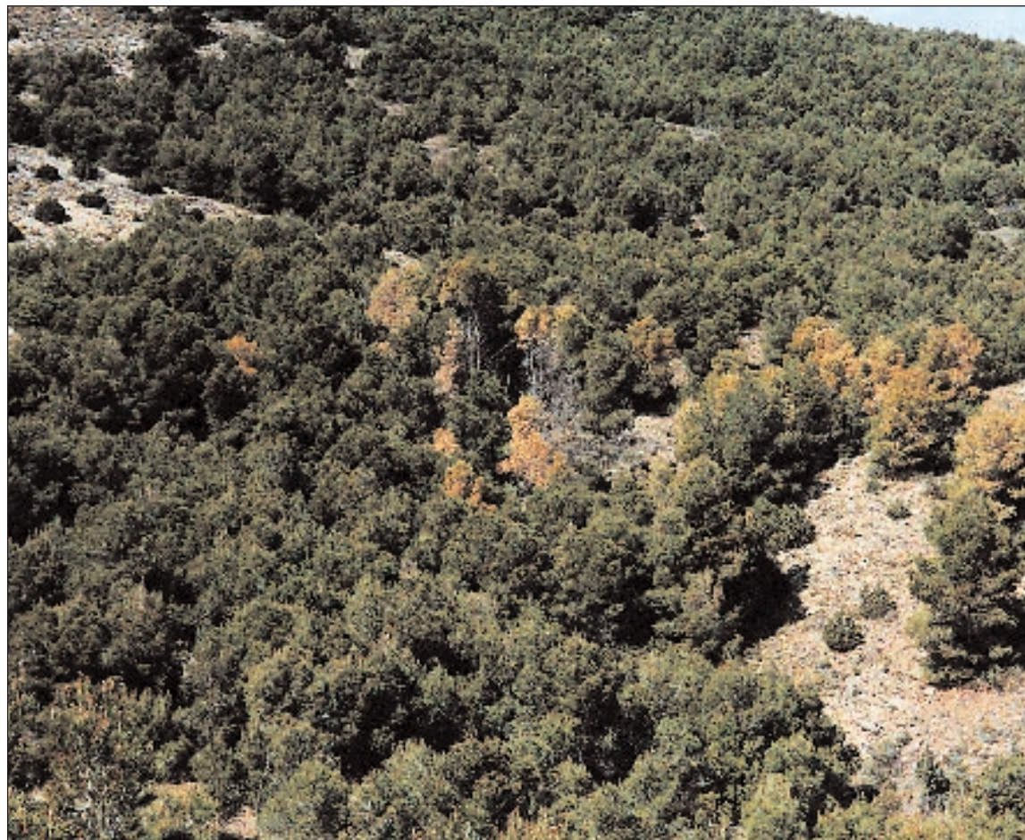
Foto 1.- Repoblación de pino carrasco afectada por Orthotomicus erosus .