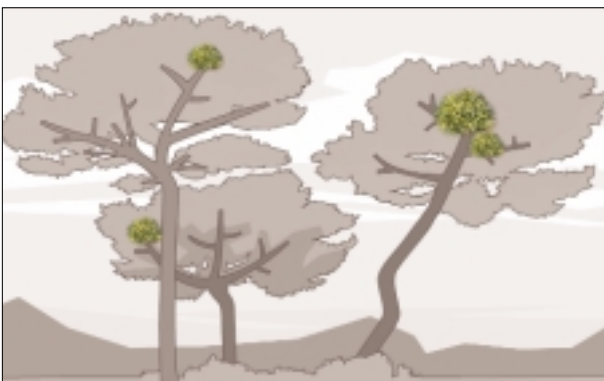
Nivel 2. Generalización del ataque del muérdago por la masa.