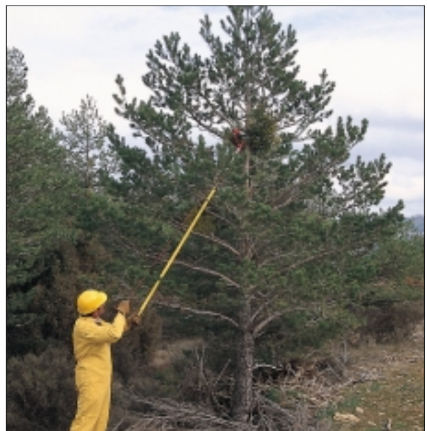
Foto 9. Eliminación de ramas con matas de muérdago.