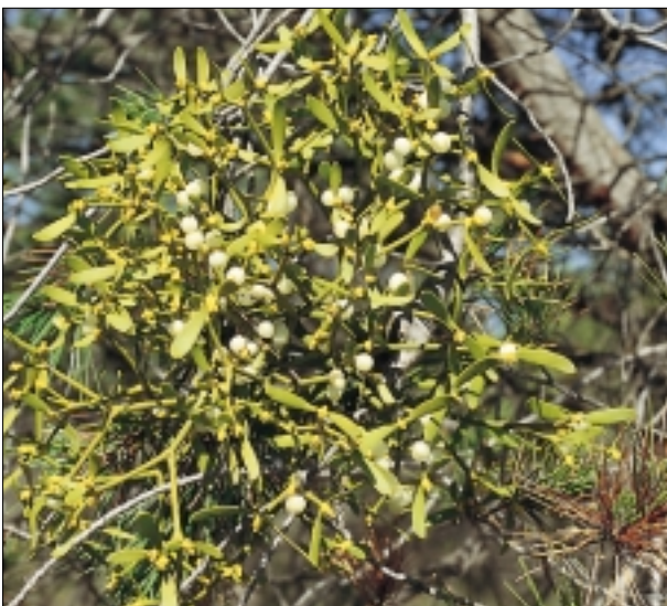
Foto 4. Mata de muérdago con frutos.