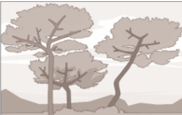
Nivel 0. Ausencia de muérdago.