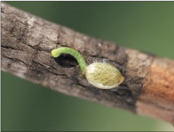
Foto 2. Semilla de muérdago iniciando la germinación.