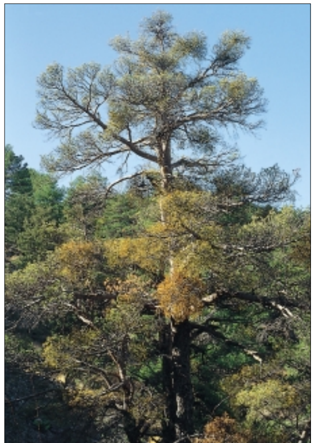
Foto 5. Pinus sylvestris muy atacado por el muérdago en una zona de nivel 3.