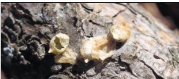
Foto 8. Predación sobre semilla de muérdago.