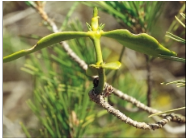
Foto 3. Mata joven de Viscum album .