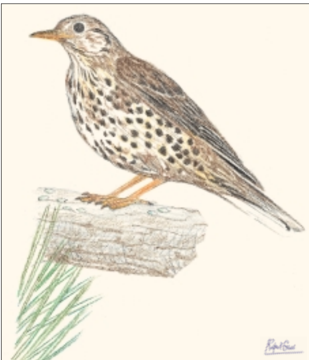
Fig. 1. Turdus viscivorus (zorzal charlo), principal propagador de las semillas del muérdago.