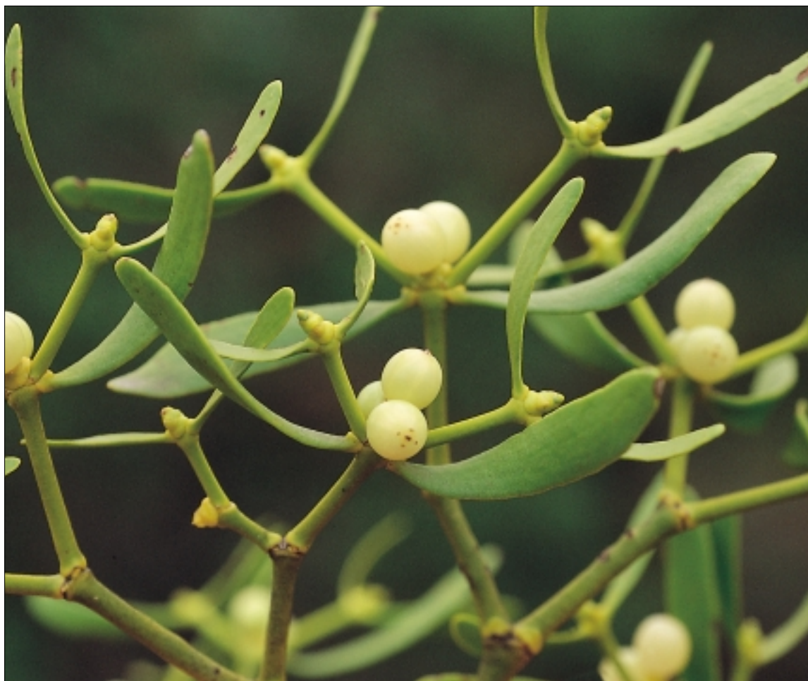
Foto 1. Mata de Viscum album con sus frutos.