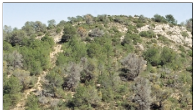
Foto 6. Dominancia de muérdago con árboles muertos, nivel 3.