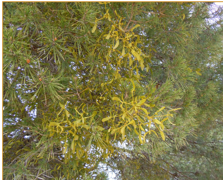
Detalle del ramillo del muérdago

Esta planta hemiparásita se localiza principalmente en pinos y abetos, aunque también se encuentra afectando a diversas frondosas como chopos, acacias y tilos entre otras. En muchas zonas constituye un problema importante por su extensión y por el debilitamiento que provoca en los árboles, ante fenómenos de estrés hídrico y ataque de otros organismos nocivos perjudiciales. Como medida de control se pueden eliminar periódicamente las ramas afectadas.