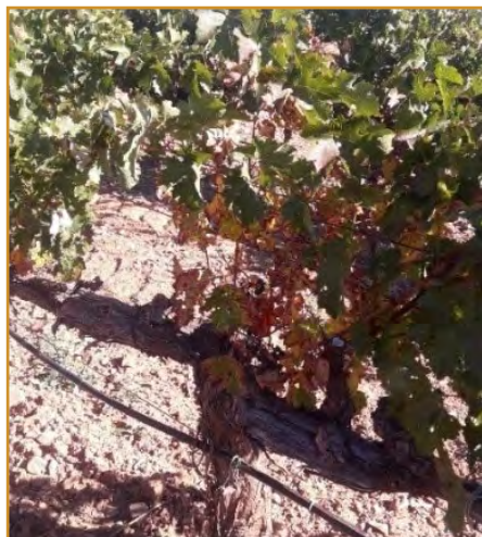
Daño de enfermedad en campo