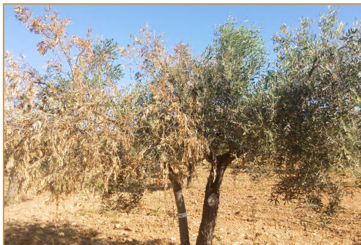
Decaimiento lento por Verticillium

Es altamente virulenta en plantaciones de menos de 10 años, por lo que se asocia a nuevas plantaciones de regadío, aunque también afecta, en menor medida a parcelas viejas de secano. Es muy importante adquirir planta sana, con pasaporte fitosanitario, y plantar en suelos no contaminados.