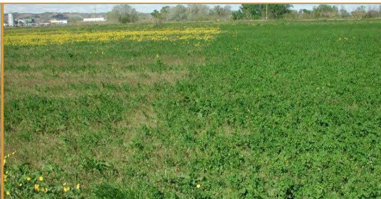
Imagen de una niveladora (izda.) y comparación entre zonas con y sin corte invernal en una parcela de alfalfa (dcha.). La mitad de la parcela donde se llevó a cabo el corte invernal (mitad derecha) muestra una importante reducción en la infestación de malas hierbas en el primer corte.