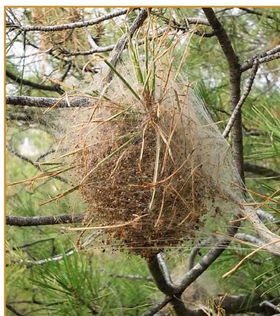
Formación de bolsones

En este momento empiezan a ser reconocibles los bolsones blancos, donde las orugas se refugiarán de las bajas temperaturas. Se pueden eliminar los bolsones extremando las precauciones durante su manipulación, ya que las orugas presentan pelos urticantes muy desarrollados. En zonas en las que sea necesario su control, se pueden realizar tratamientos químicos dirigidos al bolsón, con los productos autorizados.