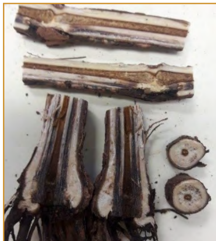
Daño de enfermedad en madera

Debido a la imposibilidad del control y sin medios de lucha, las medidas preventivas y culturales son las herramientas que tenemos en nuestras manos para limitar y controlar los daños en nuestras plantaciones.