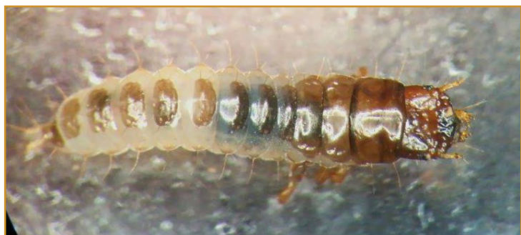
Larva de Zabrus

Las incidencias de zebro han aumentado en los últimos años en gran parte de las zonas cerealistas de Aragón. Los daños más importantes se realizan en los primeros estados del cultivo, desde la nascencia hasta el estado de tres hojas. Debido a la gravedad de los daños que puede ocasionar, se recomienda aumentar la vigilancia en los primeros estados del cultivo y en aquellas zonas donde se hayan visto afectadas uno o varios años.