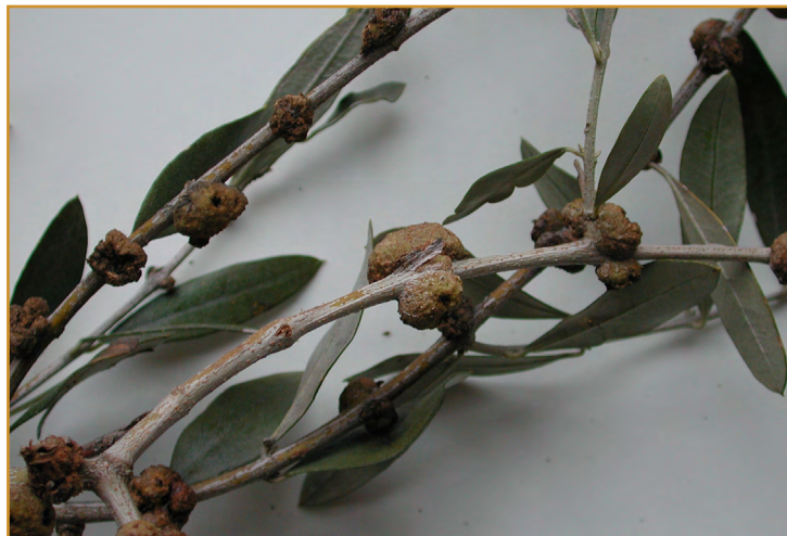
Tuberculosis en rama de olivo

Dichos tumores dificultan el paso de la savia, por consiguiente, los brotes se secan, y las ramas afectadas se debilitan. El árbol sufre un decaimiento, la producción merma en relación a la intensidad del ataque y los frutos pierden calidad.