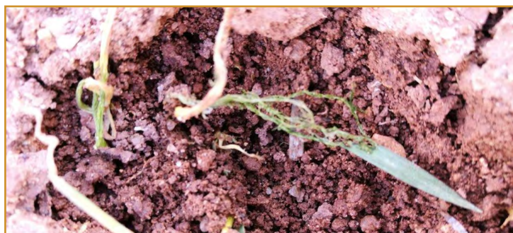
Detalle de orificios originados por Zabrus