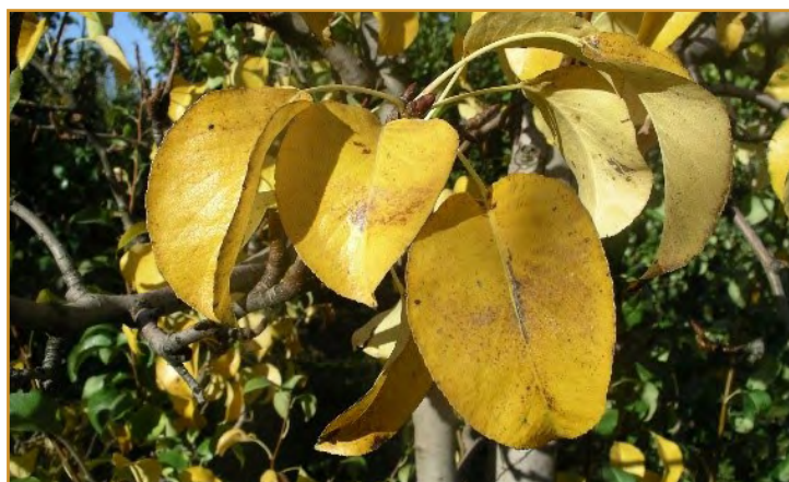
Hojas de peral a punto de desprenderse

Es pues recomendable utilizar compuestos de cobre de la lista siguiente, realizando 1 o 2 tratamientos durante la caída de la hoja, efectuando el primero cuando haya caído el 50% y el segundo cuando la caída casi haya concluido. Si se opta por realizar una sola aplicación, es preferible efectuarlo con el 75% de la hoja caída.