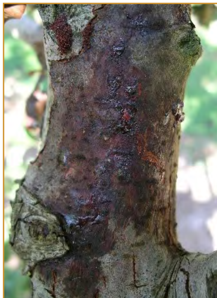
Chancro en rama de peral, producido por fuego bacteriano

La bacteria causante de la enfermedad conocida como fuego bacteriano, puede atacar a plantas ornamentales, silvestres y frutales como membrilleros, perales, manzanos y nísperos. La fácil dispersión de la enfermedad y los escasos métodos químicos de control, hacen que los daños sean muy graves, pudiendo provocar la muerte de la planta en un corto periodo de tiempo. Para evitar su propagación y su introducción en las plantaciones, se deben aplicar con la máxima diligencia y rigor todas las medidas profilácticas y de cultivo, como son las medidas culturales, la eliminación