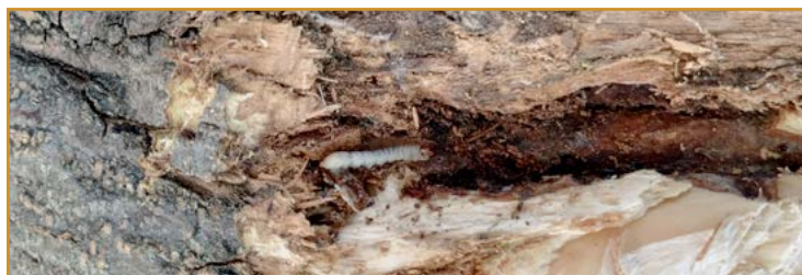
Oruga de euzophera en galería

En caso de realizar tratamientos se harán mojando ramas principales, cruz y tronco del olivo con los productos indicados en la tabla siguiente: