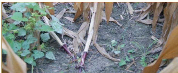
Cuellos de ganso. Daños producidos por Diabrotica virgifera virgifera

El método más eficaz y rentable para el control y prevención de esta especie es la rotación de cultivos.