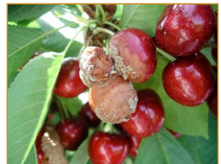
Monilia en fruto del cerezo

SERENADE MAX-Bayer, 0 y 3 días respectivamente), boscalida+piraclostrobin 26,7%+6,7%WG (SIGNUM FR-BASF, 3 días), ciprodinil 50%WG (CHORUS-Syngenta, 7 días), ciprodinil+fludioxonil 37,5%+25%WG (SWITCH-Syngenta y ASTOUND-Nufarm, 7 días), difenoconazol 25%EC (varios, 7 días), fenbuconazol 2,5%EW y 5%EW (IMPALA STAR e IMPALA-Corteva, 3 días) solo hasta el 30 de abril de 2022, fenhexamida 50%WG (TELDOR-Bayer, 1 día), fenpirazamina