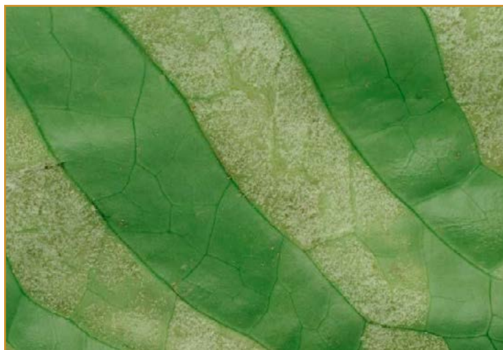
Daños de mildiu en lechuga