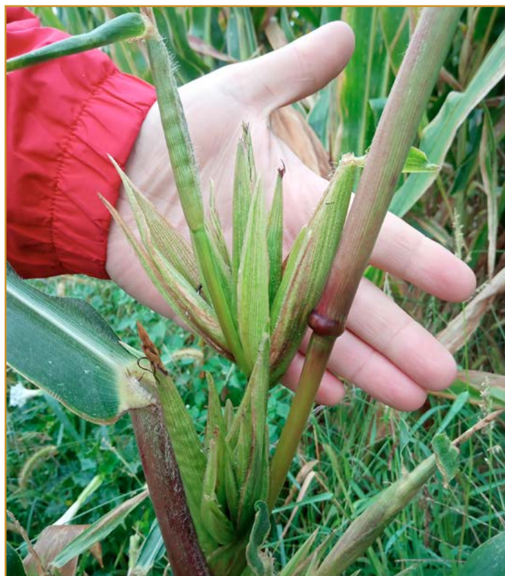
Detalle del tamaño y de la cantidad de mazorcas que produce el teosinte

Detalle del tamaño y de la cantidad de mazorcas que produce el teosinte.