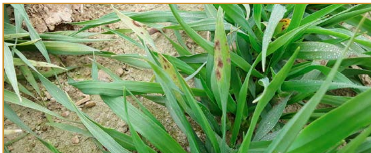
Daños de Helminthosporium spp. en cereal

esto hay que añadir, en el mes de febrero, los primeros síntomas de rinosporium en cebada y de septoria en trigo.