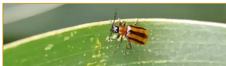
Adulto de diabrotica

En España se detecta en la provincia de Lérida en la primera quincena de julio de 2021 y pocos días después en las comarcas de Los Monegros, Bajo Cinca/Baix Cinca y Cinca Medio.