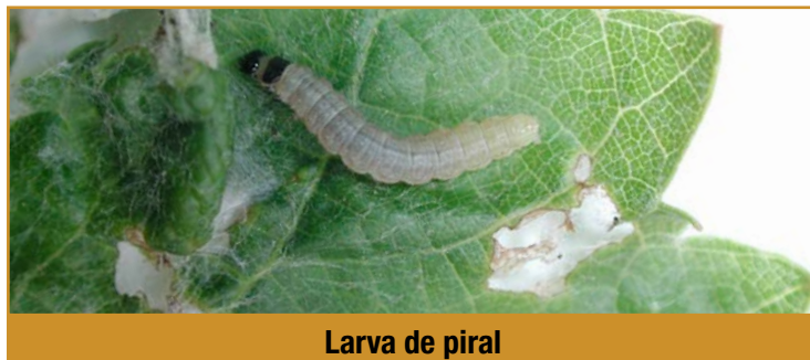
Larva de piral

Para su control, es muy importante la vigilancia de las parcelas y la detección temprana de las larvas. El tratamiento se recomienda realizarlo una semana después de ver la primera larva. El umbral de tratamiento será valorado por el técnico de ATRIA. En parcelas con ataques severos el año anterior, se aconseja repetir el tratamiento a los 15 días.