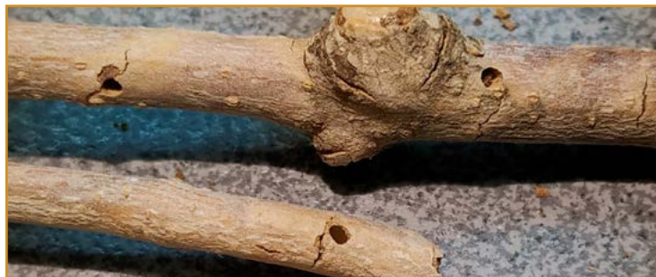
Ramas afectadas de Hylesinus oleiperda

En el caso del Barrenillo negro ( Hylesinus oleiperda ) se debe controlar la evolución para conocer la época de salida del adulto del interior de la madera. Desde el CSCV se dará el pertinente aviso para realizar el tratamiento.