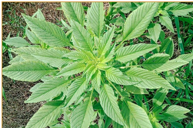
Imagen izda.: plantas de Amaranthus palmeri donde se aprecian los peciolos más largos que el haz de las hojas basales Imagen dcha.: característica disposición radial y sin superponer de las hojas de A. palmeri .

Desde el Centro de Sanidad y Certificación Vegetal se recomienda llevar a cabo las siguientes actuaciones: