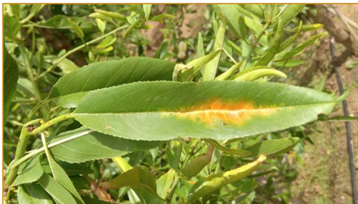
Sintomas de mancha ocre

El momento oportuno para realizar los tratamientos contra esta plaga, se comunicará mediante un aviso por correo electrónico. Las materias autorizadas para luchar contra esta plaga son aceite de parafina* (varios), lambda cihalotrin 1,5%CS, 10%CS y 2,5%WG, (varios) piretrinas* (varios) y spirotetramat 10%SC (MOVENTO GOLD-Bayer).