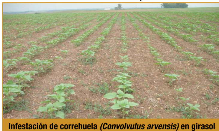
Infestación de correhuela ( Convolvulus arvensis ) en girasol

Cuando se repite el cultivo del girasol en una misma parcela también proliferarán otras especies de malas hierbas adaptadas a este cultivo. Pueden aparecer problemas de Xanthium spp. (cachorreras) frecuentes en