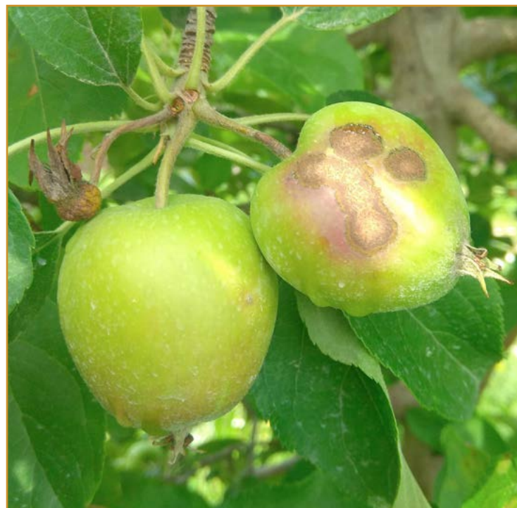
Daños de moteado en manzana

En el resto de variedades, las aplicaciones se deberán realizar después de cada periodo lluvioso o de manera periódica si las plantaciones permanecen mojadas debido al rocío de la mañana. Existen tres tipos de tratamientos: los preventivos que se efectúan con tiempo seco en previsión de que llueva o haya rocío, los denominados de "stop" que se efectúan en las 36 horas posteriores al comienzo de la lluvia con fungicidas penetrantes y los curativos , que se hacen con fungicidas penetrantes o sistémicos, teóricamente capaces de impedir la progresión del hongo pasadas las 36 horas siguientes al inicio del riesgo.