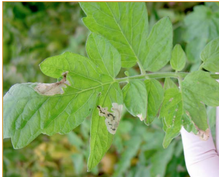
Daños de Tuta absoluta