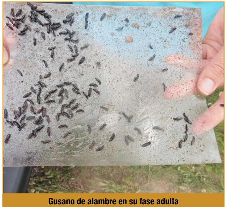
Gusano de alambre en su fase adulta

El control químico se efectuará mediante la aplicación en el momento de la siembra: