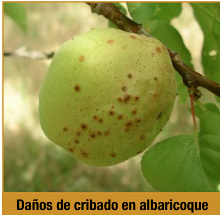
Daños de cribado en albaricoque

Si la plantación presenta habitualmente problemas de oídio se recomienda el uso de aceite de naranja* 6%ME y 6%SL (LIMOCIDE-Manica y PREVAM-Nufarm), boscalida+piraclostrobin 26,7%+6,7%WG (SIGNUM FR-BASF), bupirimato 25%EC (ABIR-Massó y NIMROD QUATRO-Adama), ciflufenamid 5,13%EW (varios), fenbuconazol 2,5%EW