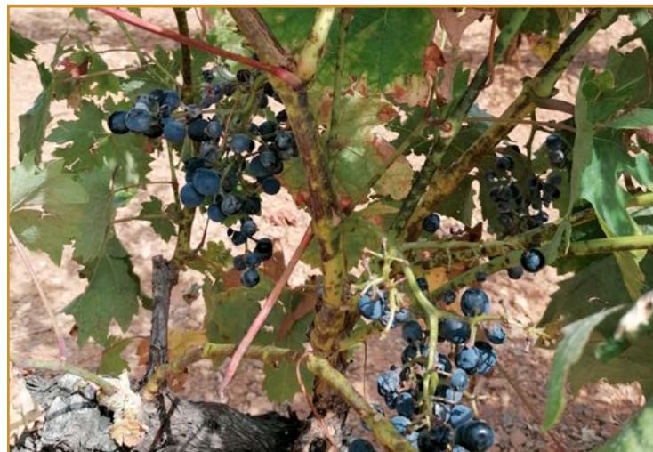
Oidio en sarmiento y racimo

Para evitar la aparición de resistencias, se aconseja no realizar más de 2 tratamientos por campaña con productos de un mismo grupo químico.