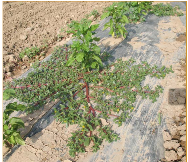
Imagen izda.: plántulas de tomatito ( Solanum nigrum ) en cebolla de transplante. Imagen dcha.: verdolaga ( Portulaca oleracea ) creciendo en el agujero de transplante de pimiento sobre acolchado.