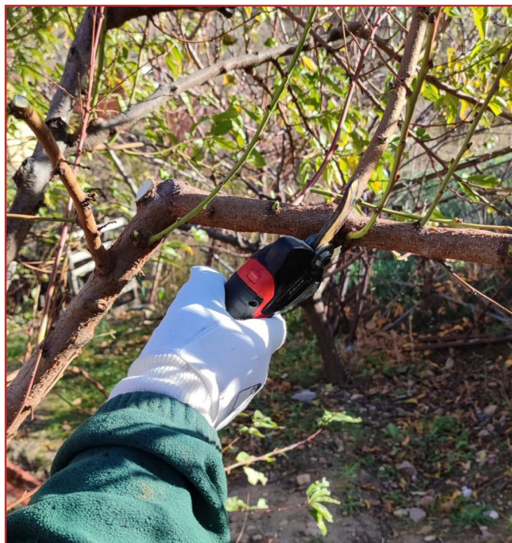
Tareas de poda en melocotonero

Aquellas parcelas que no reciben el mantenimiento cultural adecuado, pueden ser entrada de plagas o enfermedades, que pueden afectar a las plantaciones colindantes. En caso de detectarse parcelas de este tipo, es conveniente informar de su existencia a la Oficina Comarcal Agroambiental correspondiente.