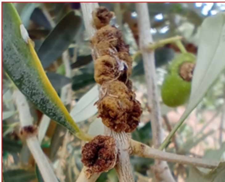
Síntomas tuberculosis del olivo

Para facilitar las labores de control y registro de las transacciones de productos fitosanitarios, el Ministerio de Agricultura Pesca y Alimentación ha desarrollado una aplicación informática denominada Registro